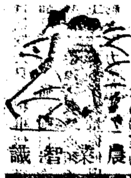
農 業 智 識