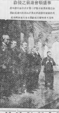
華盛頓會議之前接洽