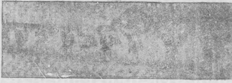
英代古國兵機紀念祭 (其一)