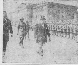
德總統親臨閱軍隊

外蒙政府之對外宣傳，自一九二一年之二十二年，即開始其反對共管之運動。其時，外蒙政府曾發起「五卅運動」，以抗議列強之共管。此後，外蒙政府之反對共管運動，更趨發達。一九二一年之二十二年，外蒙政府曾發起「三一八運動」，以抗議列強之共管。此後，外蒙政府之反對共管運動，更趨發達。