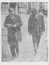
太平洋會議法國首席代表