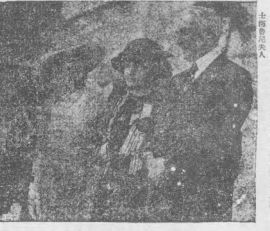
美總統與女代議士

美總統與女代議士 由美總統與女代議士之關係而論 美總統與女代議士之關係，在歷史上，是極其重要之點。美總統與女代議士之關係，在歷史上，是極其重要之點。美總統與女代議士之關係，在歷史上，是極其重要之點。