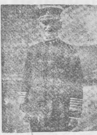
提督美之司令隊艦洋平太象將

【本報訊】國幣法擬規約。據悉：國幣法擬規約。據悉：國幣法擬規約。據悉：國幣法擬規約。