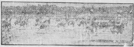
英古代操兵紀念祭 (其二)