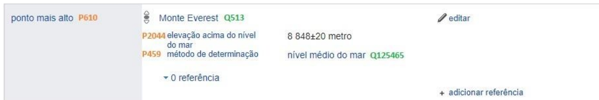
Figura 1: Exemplo de estruturação semântica no Wikidata com o item Terra (Q2).

A partir dessa organização semântica no Wikidata, foi possível implementar uma predefinição em Lua no domínio da Wikipédia para geração de textos automáticos, conforme a noção de narrativa estruturada apresentada neste trabalho. A ferramenta Mbabel desenvolvida no CEPID NeuroMat é uma adaptação e ampliação da aplicação homônima de template para rascunhos de verbetes sobre obras de arte elaborada pelo usuário Pharos 4 , envolvido no WikiProject Metropolitan Museum of Art 5 .