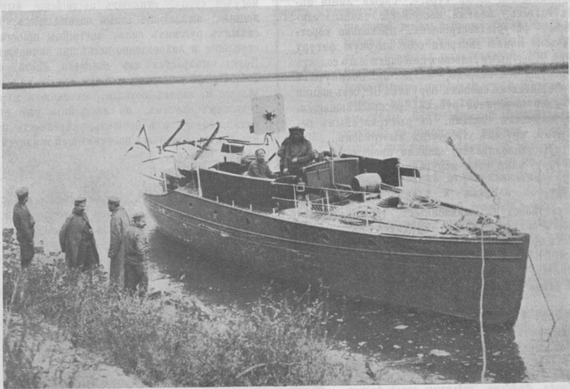
Военный катеръ на Вислѣ, вооруженный пулеметами.

Поэтому, казалось бы, что двухъ мнѣній о потерѣ орудій въ бою быть не можетъ и, разъ потеря эта имѣла мѣсто послѣ того, какъ былъ вполне использованъ ихъ