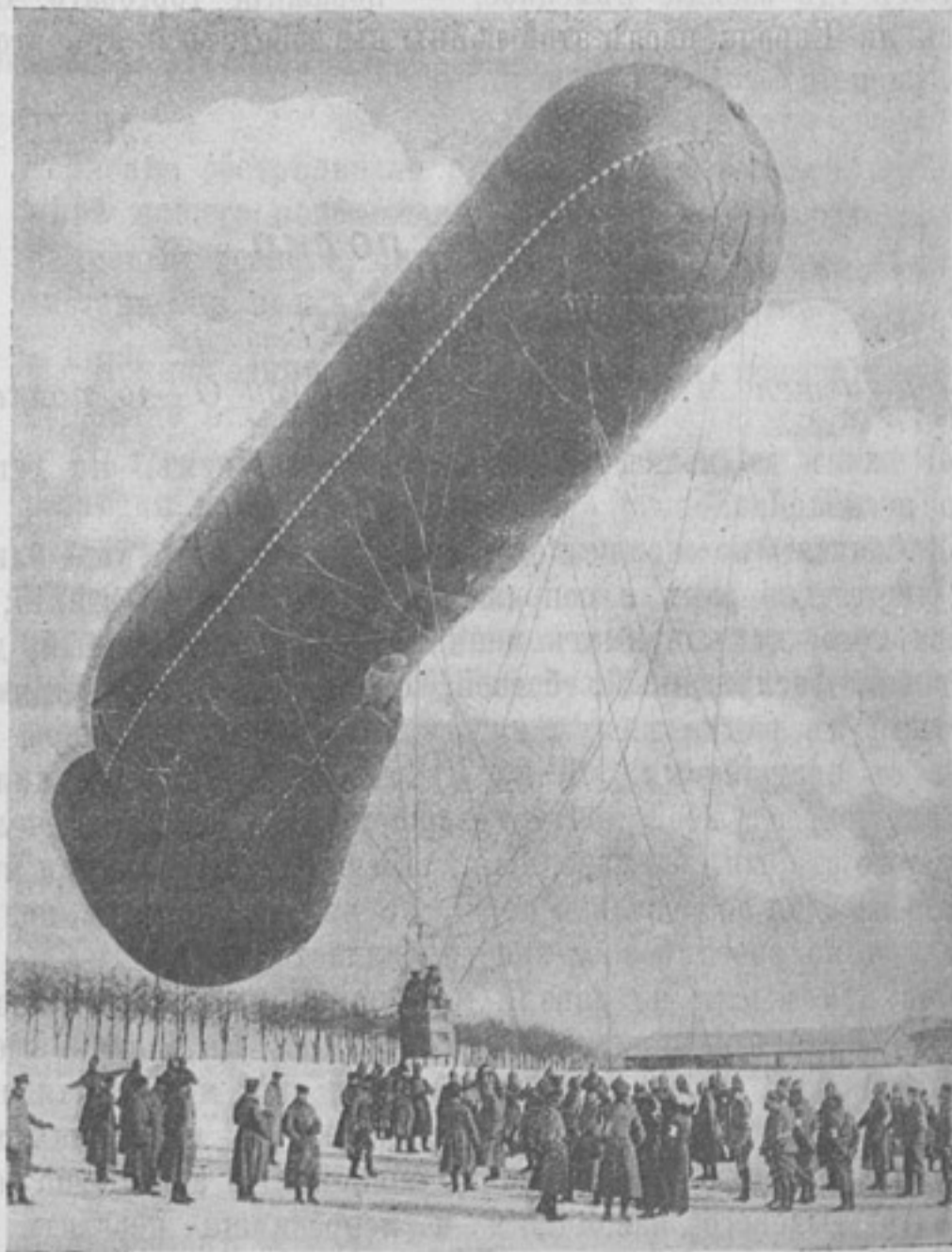
Подъемъ змѣинового аэростата на одной изъ германскихъ позицій. („Welt-Spiegel“).

Точно также въ Болгаріи завѣтныя стремленія болгаръ къ Македоніи почему-то счастливо совпадаютъ съ нѣмецкимъ направленіемъ политики Фердинанда, и кто тамъ разберется, что въ этой политикѣ преобладаетъ: сокровенныя ли наклонности нѣмецкаго царя или народныя вождѣлѣнія о Македоніи. Вѣдь и младенцамъ видно, что помимо Македоніи несравненно болѣе лакомая добыча влечетъ Болгарію въ дру-