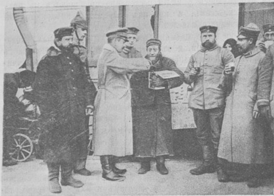
Еврей одного изъ занятыхъ германцами городовъ Польши ведетъ бойную торговлю съ нашими врагами. („Welt-Spiegel“).