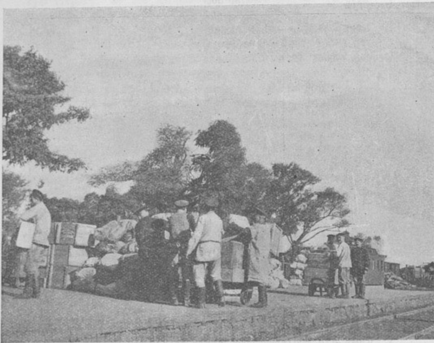
Сортировка посылокъ послѣ выгрузки изъ вагоновъ въ Волочискѣ.

кустахъ и сладкахъ мѣстности, быстро продвигались наши лихіе развѣдчики. Лицо его было, какъ и всегда совершенно спокойно и серьезно... Я быстро спряталъ письма въ карманъ, всталъ и подошелъ къ командиру. Онъ протянулъ мнѣ руку и поздоровался тѣмъ-же спокойнымъ, пріятнымъ тономъ, какъ и всегда. Я смотрѣлъ ему въ лицо; ни одинъ мускулъ не выдавалъ ни малѣйшаго волненія. Можно было подумать, что онъ искренно не замѣчаетъ допавшихся кругомъ него снарядовъ. Вдругъ я услышалъ противное, тошнотворное, характерное шипѣніе несущагося на насъ снаряда... Ближе, ближе... я почувствовалъ, какъ сердце во мнѣ замерло... вдругъ все вокругъ меня стало пусто, точно все отошло на второй планъ, а на первомъ планѣ, все заполняя собою, выдвинулось это наглое, злорадно-торжествующее шипѣніе несущейся на насъ смерти... Мигъ и гдѣ-то близко, близко разорвался воздухъ, грохотъ, свистъ, вой, яркій блескъ огня... сѣрая кобыла дико шарахнулась въ сторону и взвилась на дыбы. Рыжій мотнулъ бѣлолобой мордой и, повернувъ направо кругомъ, далъ нѣсколько скачковъ; лошади ординарцевъ, какъ испуганныя овцы, заматались на одномъ мѣстѣ.