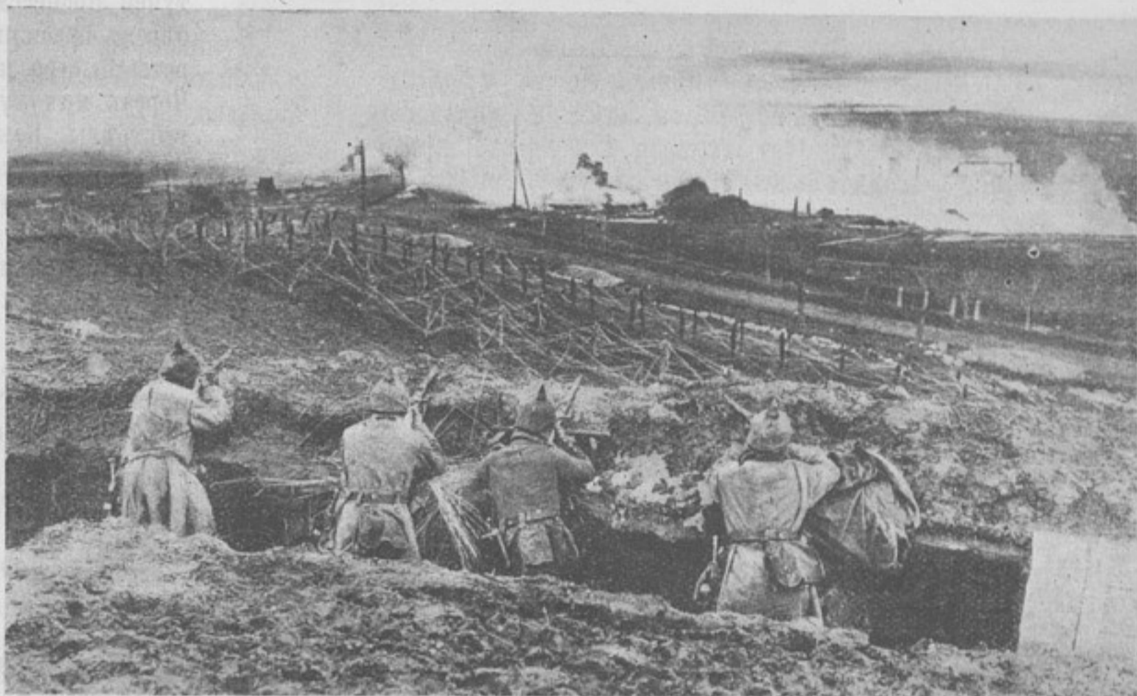
Нѣмецкій окопъ, усиленный проволочными загражденіями. („Welt-Spiegel“).

Не принимая боя, австрійцы отступали передъ нами послѣ незначительныхъ ружейныхъ перестрѣлокъ и только