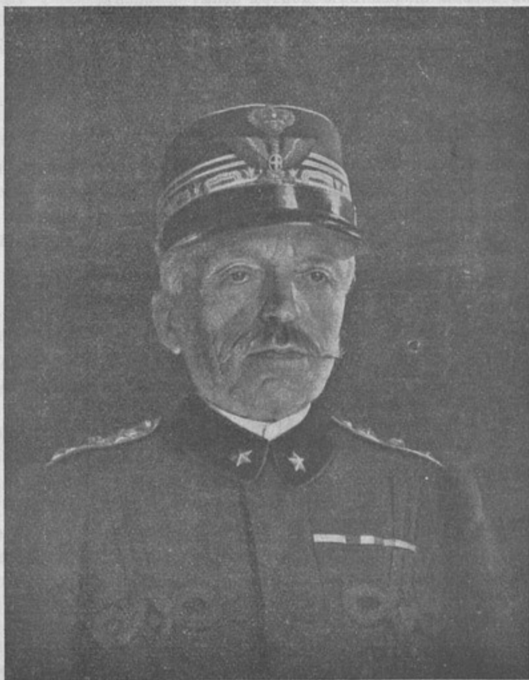
Италіанскій главнокомандующій, генераль Кадорна.

На Днѣстрѣ нами одержанъ крупный успѣхъ ниже Нижніова. Австрійцы перебросили черезъ Днѣстръ весьма значительныя силы, съ коими наши войска находились въ упорномъ бою со 2-го іюня на фронтѣ Остра—Коропець—Космѣржинъ—Сновидувъ—Возилувъ—Унишь. На разсвѣтъ 8-го іюня эта борьба закончилась нашимъ полнымъ успѣхомъ.