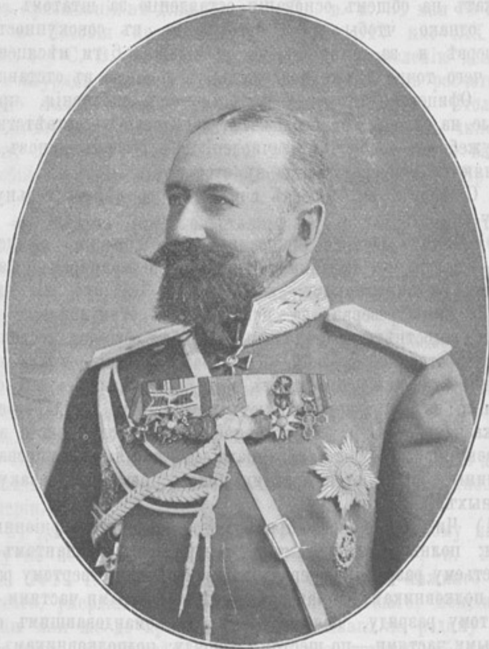
Управляющій военнымъ министерствомъ, генераль-отъ-инфантеріи Алексѣй Андреевичъ ПОЛИВАНОВЪ.