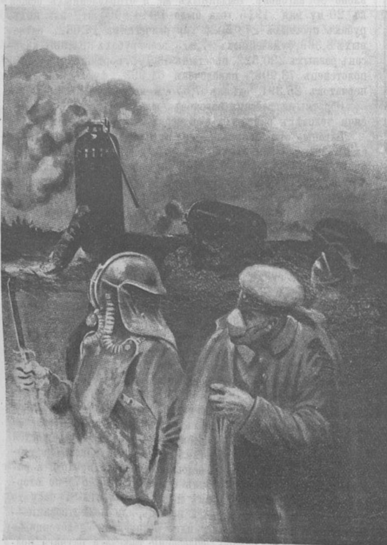
Выпускъ германцами ядовитыхъ газовъ на позиціи.

7-го іюня. Въ шавельскомъ районѣ существенныхъ перемѣнъ не произошло. Болѣе упорные бои велись на рѣчкѣ Рингова, гдѣ мы нѣсколько продвинулись впередъ. На наревскомъ фронтѣ подъ прикрытіемъ сильнаго артиллерійскаго огня небольшія силы нѣмцевъ безуспѣшно пытались наступать между рр. Омудевымъ и Оржицемъ. На лѣвомъ берегу Вислы на разсвѣтъ 7-го іюня непріятель перешелъ въ на-