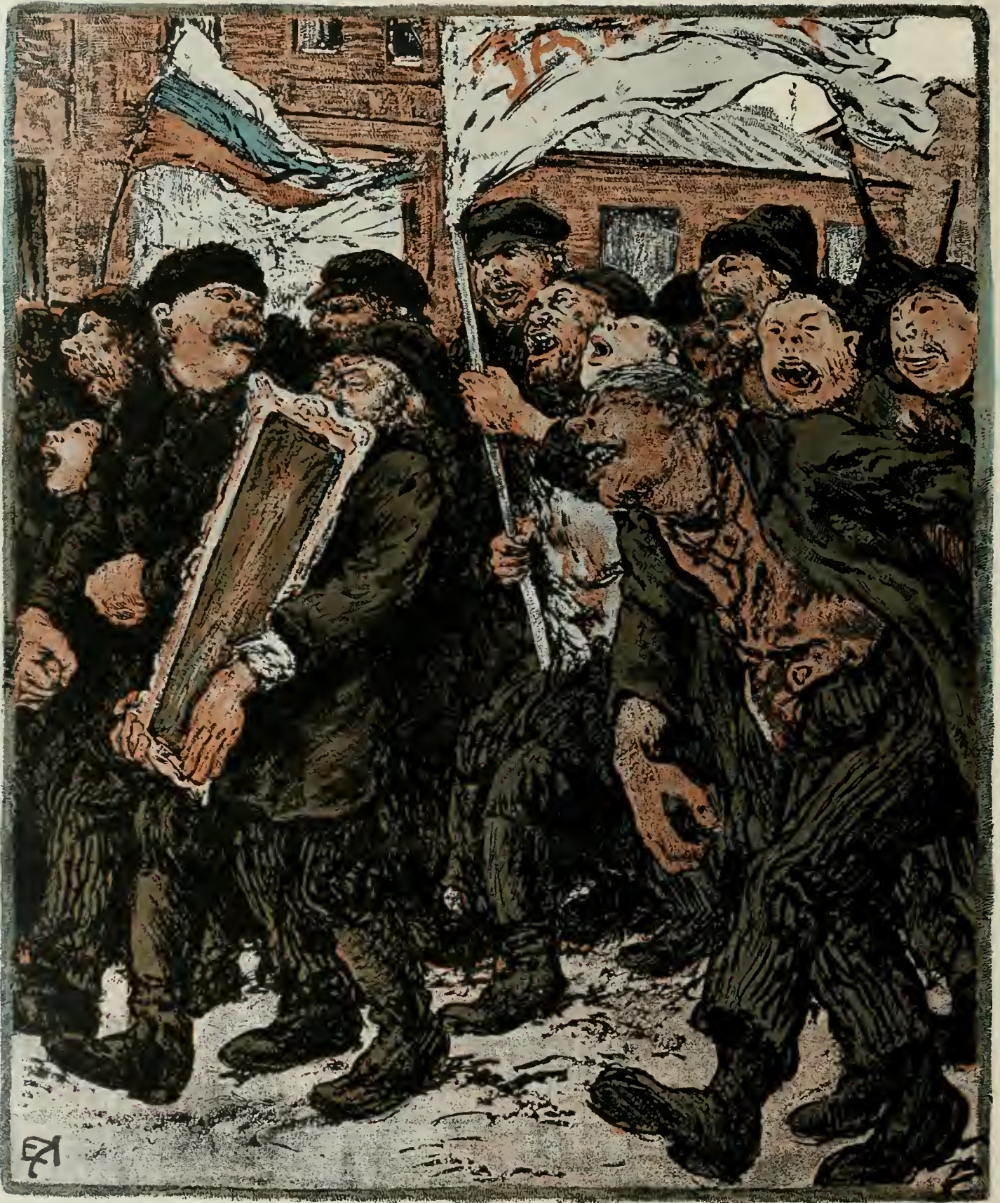
Радость на землѣ основныхъ законовъ руги.