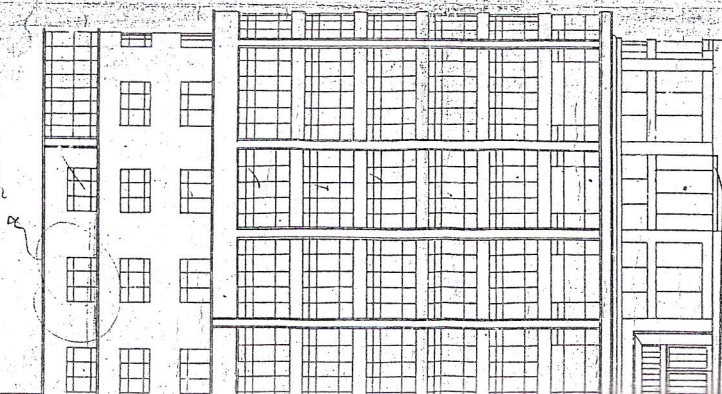
LA AVENIDA JIMENEZ DE QUESADA - Esc. 1:100