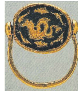
Морський дракон серед риб. Перстень із Пантікалея. Середина IV в. до н.е.

Дивно, але саме від часу окупації Криму цей міф став активно поширюватися в інформаційному просторі. Кому це вигідно? Звісно, імперській пропаганді, яка оперує фальшивими твердженнями: «Крым – сакральная российская территория», «крещение российского князя Владимира», «исконно русская земля», «свободное волеизъявление крымчан», «город русской славы», «киевская хун-