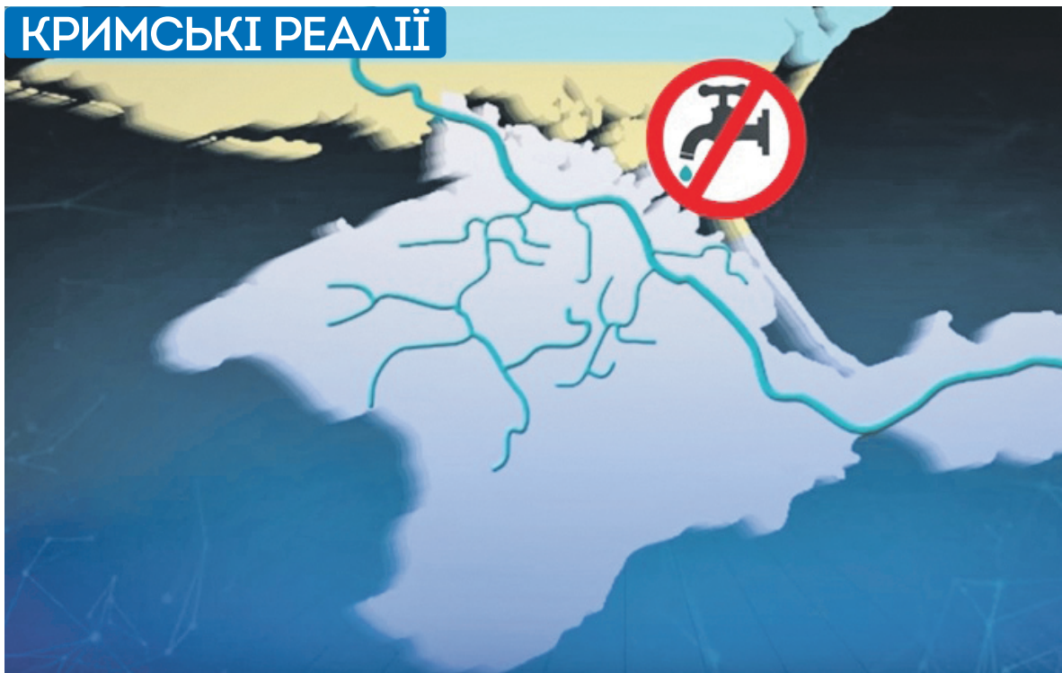
«Чтобы ни капли воды с "нэньки" не досталось "сепаратистам"» – скриншот з відеозапису телепередачі «Паралелі» (телеканал «Крим 24», 02.02.2018 р.)