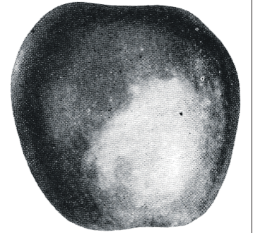
Єдина ілюстрація яблука Козу-баш, що збереглася у праці «Помологія» Левка Симиренка

Зрозуміло, що використовувати найсприятливіші природні умови та кращі землі потрібно для вирощування найкращих і найцінніших сортів. Але чи багато у нас таких місцевостей? Саме через це плоди місцевих кримських сортів (окрім хіба що Кандиль синап) менш якісні, порівняно з більш витонченим французьким сортом. Але ж перші сорти більш адаптовані і мають, як правило, більш могутні дерева. Їхні невибагливість та витривалість – це ті якості, які у місцевих татарських сортів ніхто не піддає сумніву. Тож шкода буде, якщо Козу-баш та деякі інші аборигенні сорти врешті-решт зникнуть з кримських садів. Говорячи про Козу-баш, необхідно наголосити на його високій стійкості листя та плодів до головного інфекційного захворювання яблуні – шолудів (парші). Цим захворюванням плоди ніколи не уражаються. Досить цікаве видовище мав сад Овак улітку 1888 року. Тоді плоди всіх західноєвропейських сортів були суцільно уражені цим грибовим захворюванням і мали потворний вигляд. У той час як лиш один Козу-баш вражав своєю чистою черво-