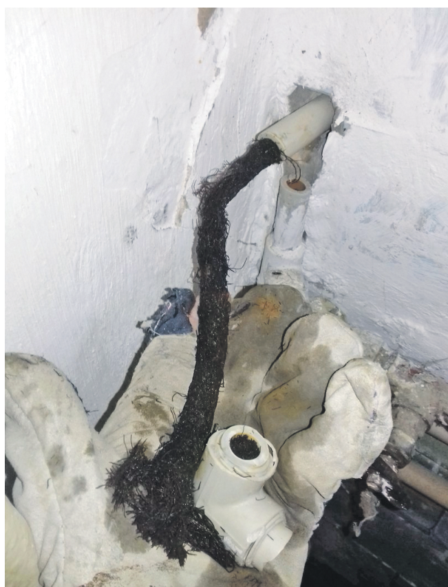
Ось так морська вода з водоростями просочується до водогонів Красноперекопська