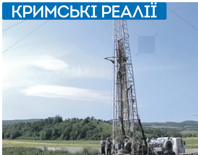
«Первая скважина после того, как Крым получил независимость» (травень 2014 р.) – скриншот з відеозапису телепередачі «Паралелі» (телеканал «Крим 24», 02.02.2018 р.)