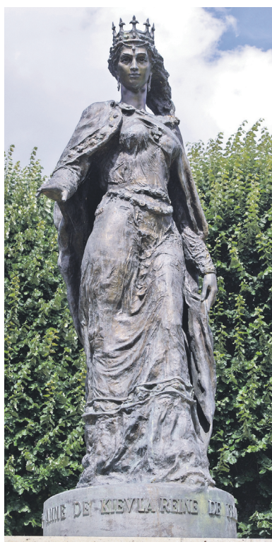
ФОТО З ВІДКРИТКИ ДЖЕРЕЛ

*** Я не здивована, що стільки зла І ще не зібране каміння – Авжеж... Століттями Москва Рубала нам і голови, й коріння. Я не дивуюсь, що хабар Бере суддя попри закони – Століттями попи і цар Топили в крові всі кордони. Я не дивуюсь, що «язык» Несеться вітром, мов полова, І начебто скажений бик Витоптує копитом мову. Я не дивуюсь, що краде Чиновник пенсію у баби, І що негідники... цабе... Приперлися до залу Ради. Я не дивуюсь, що товпа На гасла проміняла мозок, І жінку прив'язала до стовпа, І став кумиром відморозок. Я... вражена!! Бо двоголовий кат Не переміг козацький дух І міцність стовікових ґрат Руйнують воля і обух. Я вражена – царя загнали в кут, Здуває щоки путінська арта, І полетів російський культ Кудись униз, в далекий Тартар... Я вражена... зняли хомут! Відкинутий навіки цар. ...Неначе хлопчики із Крут Спустилися з небес в «Айдар». Я вражена, бо став юнак, Вчорашній менеджер, солдатом. Все це, напевне, Божий знак – Нас вже ніколи не здолати. Звичайно, буде непростим І довгим бій з паханом клану. І нам іще звільняти Крим, Донбас і королеву Анну. ...Нехай іще багато зла І ще не зібране каміння – Іде у небуття Москва І день за днем міцнішає коріння!