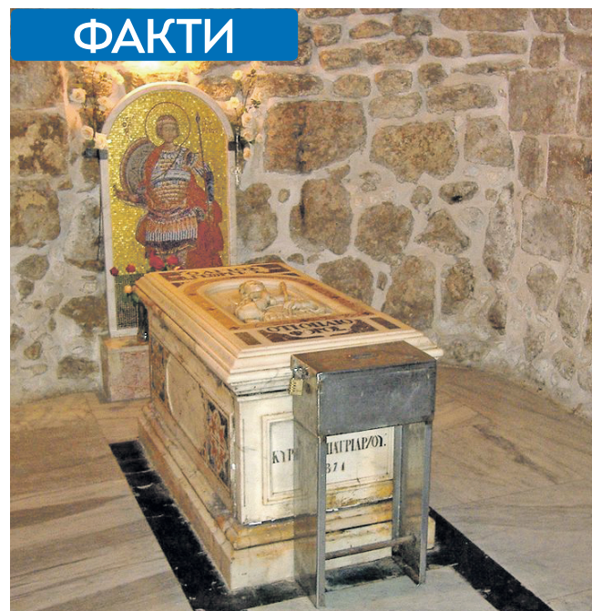
Гробниця Св. Георгія в Лоді, Ізраїль

Справжній Георгій народився наприкінці 3 століття від Різдва Христового у Малій Азії; він був вправним військовим і навіть досягнув генеральської посади в імперській армії у свої двадцять з лишком років. Та це аж ніяк не пов'язане з подвигом, за який його канонізовано, бо перемогу свою Ге-