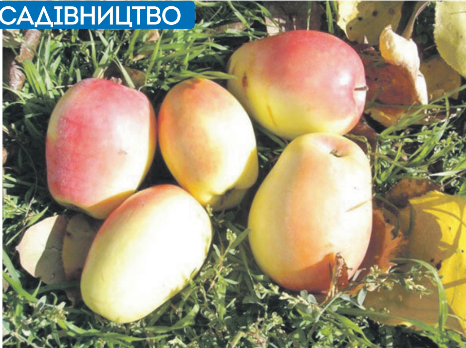
Кандиль синап – один із найвідоміших сортів кримських яблук

Евлія Челебі. Книга подорожі. Крим і суміжні області. 1678 р. (Уривки з твору турецького мандрівника XVII століття).