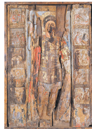
Ікона Св. Георгія, яка була вивезена з Георгіївського монастиря, що на мисі Фіолент

живим (а було йому трохи за двадцять років)... Він не відрікся від Христа, не визнав «рідної національної віри» – за що його піддали страшним тортурам, які тривали сім днів: били батогами з во-