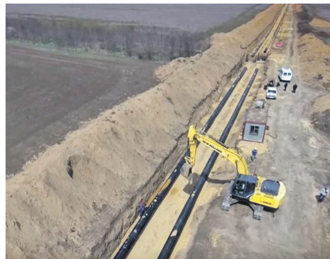
«Повернення цивілізації»: прокладання водогону на сході Криму (2017 р.) – скриншот з відеозапису телепередачі «Паралелі» (телеканал «Крим 24», 02.02.2018 р.)