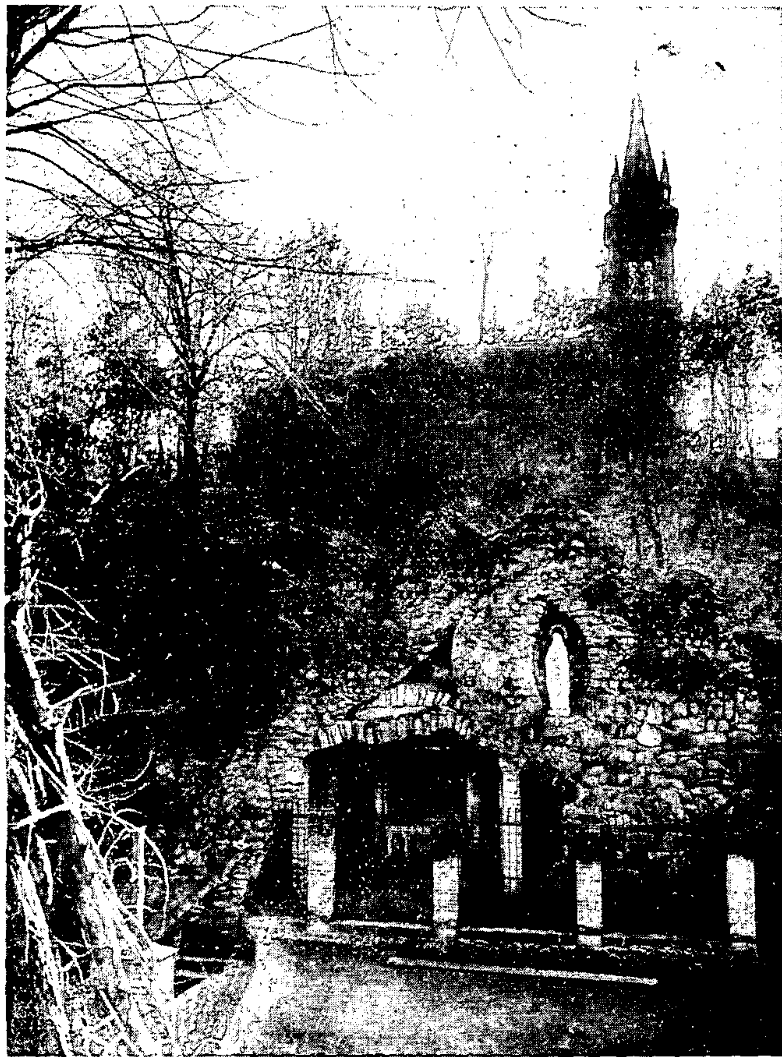
吉 林 聖 母 山 洞 及 聖 堂