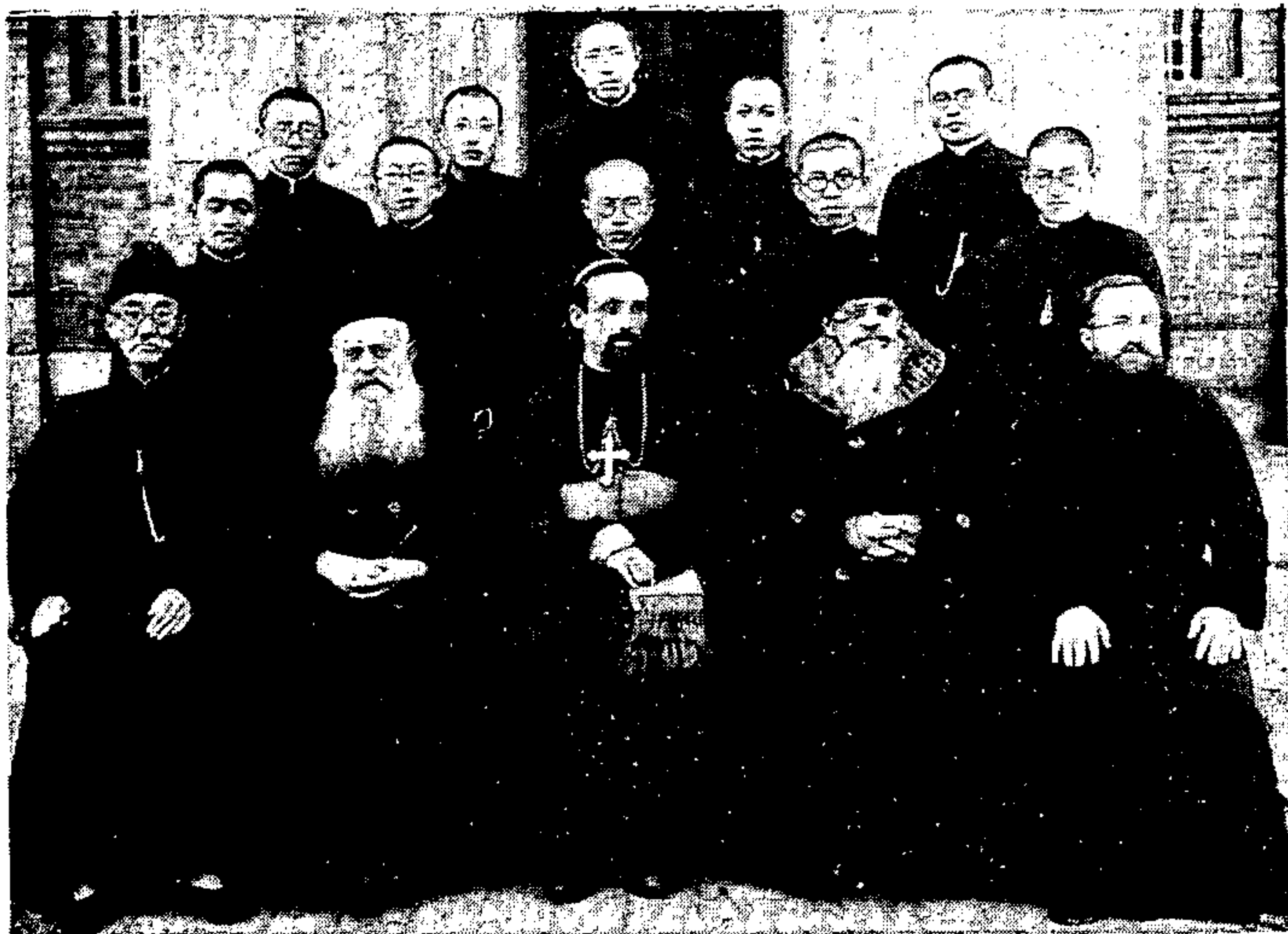
日廿月二十年九三九一學生院修羅神林吉