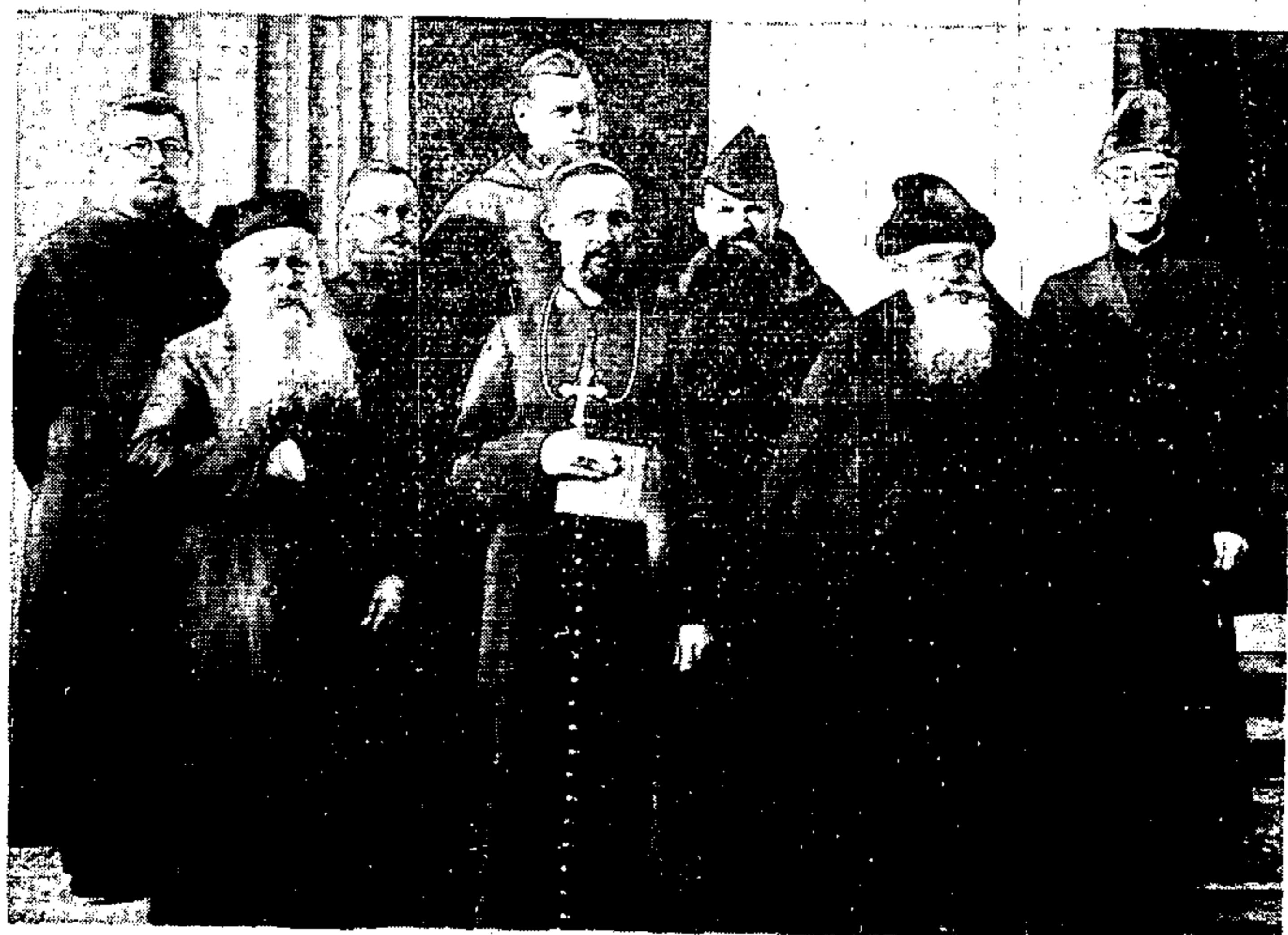
吉林神羅修院：惠主教及諸位教授司鐸合影 一九三九年十一月廿日