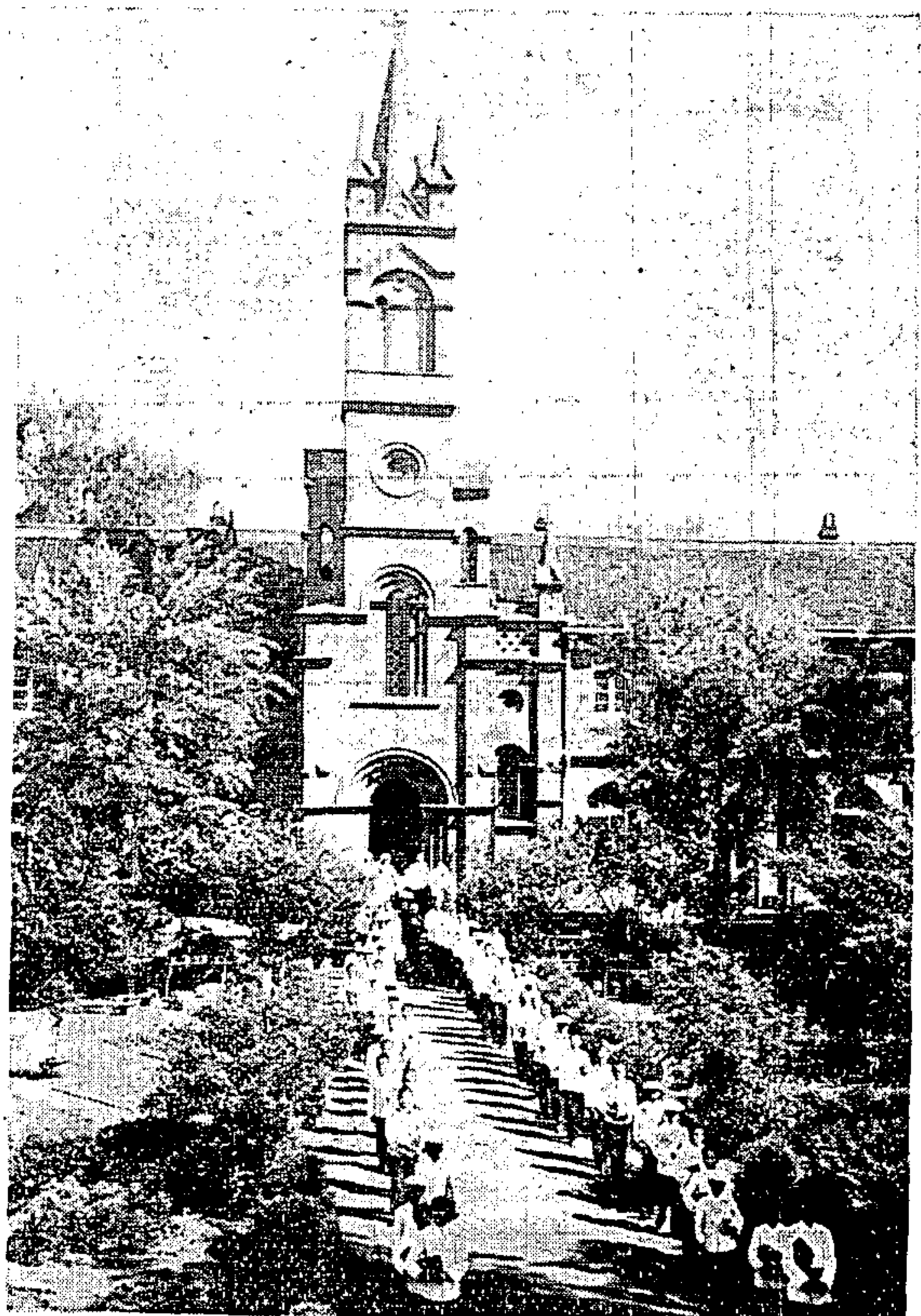
吉林神羅修院聖堂