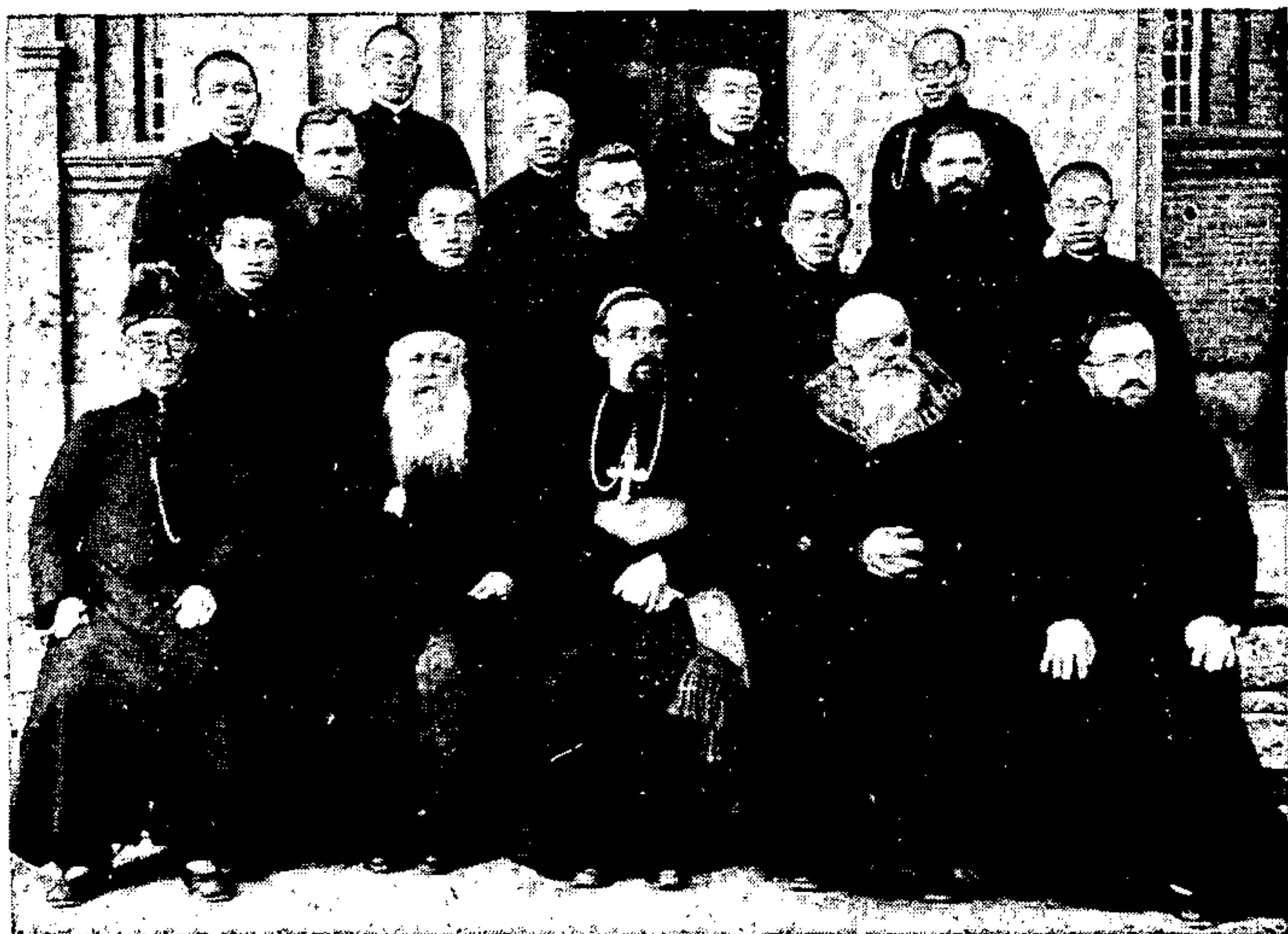
日廿月二十年九三九一學生院哲院修羅神林吉