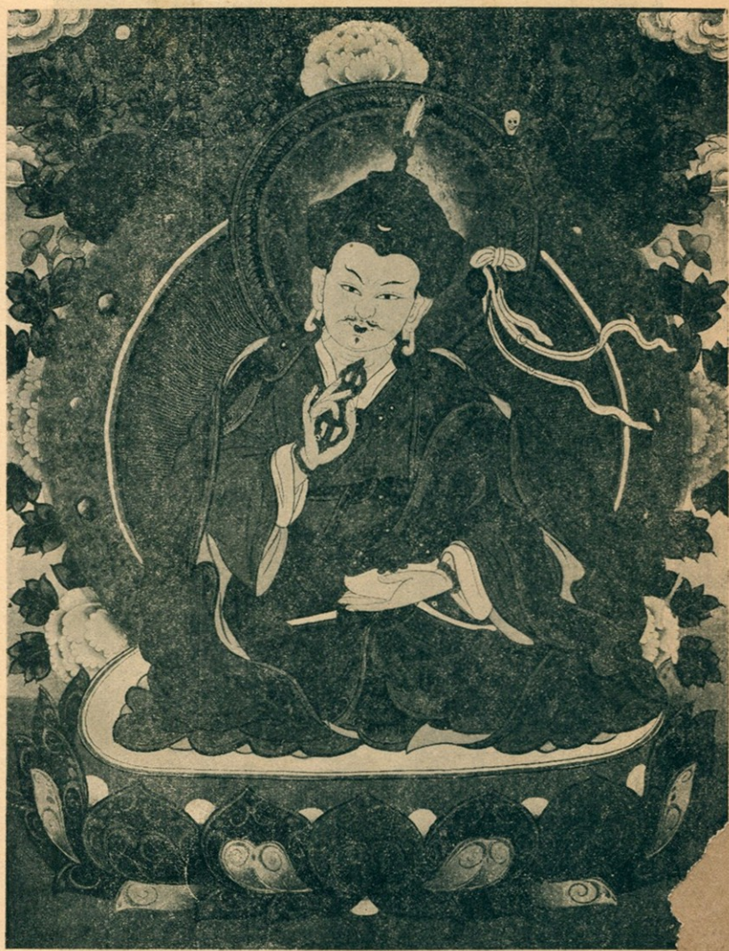
紅 教 祖 師 蓮 華 生