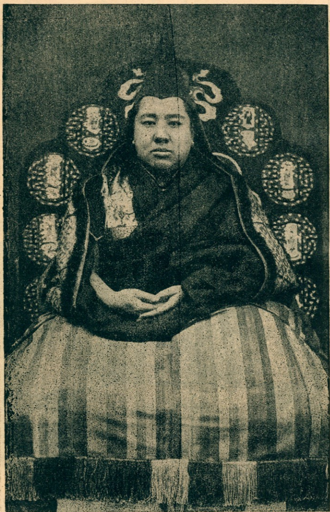
灌頂普善廣慈宏濟光明昭因闡化綜持 黃教淨覺輔教大國師章嘉呼圖克圖