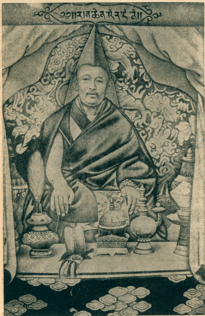
尼德爾額禪班師大慧廣化宣國護