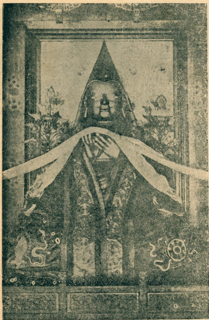
黃 教 祖 師 宗 喀 巴