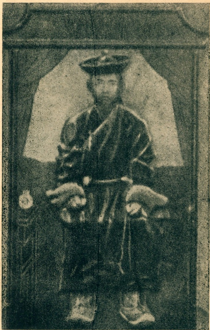
外蒙翊善輔化博克多克布尊巴丹呼圖克圖汗