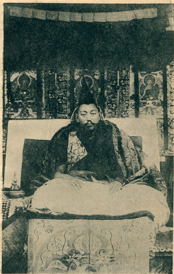
護國宏化普慈圓覺大師達賴喇嘛