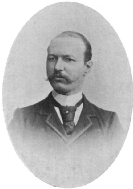
Prof. Dr. A. F. HOLLEMAN.