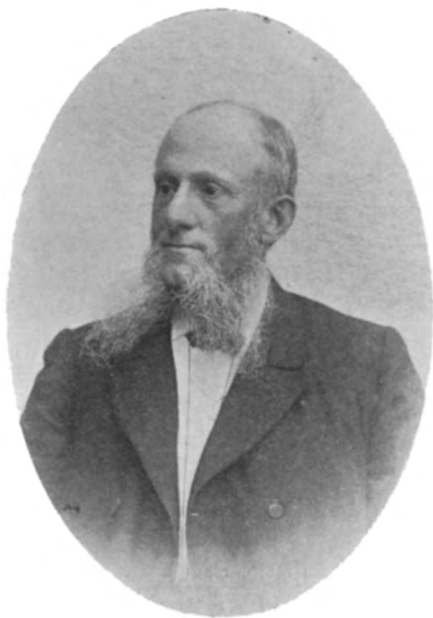
Prof. Dr. P. D. CHANTEPE DE LA SAUSSAYE.