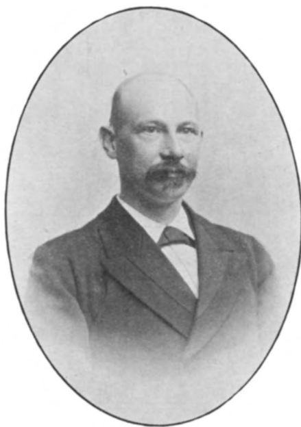
Prof. Dr. H. KAMERLINGH ONNES.