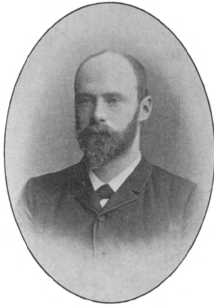
Prof. Dr. W, EINTHOVEN,