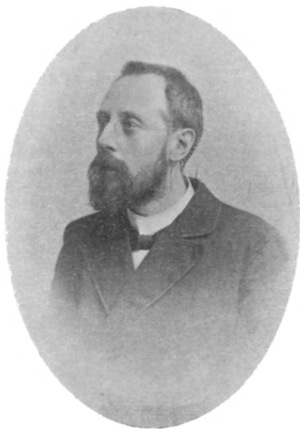
Prof. Dr. C. C. UHLENBECK.