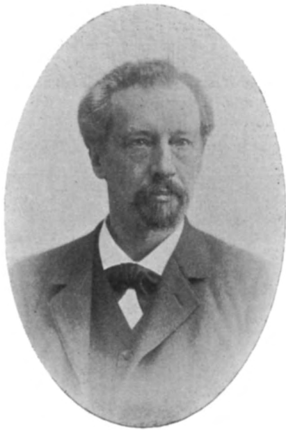
Prof. Dr. HUGO DE VRIES.