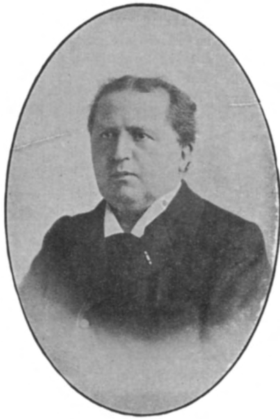
Prof. Dr. A. KUYPER.