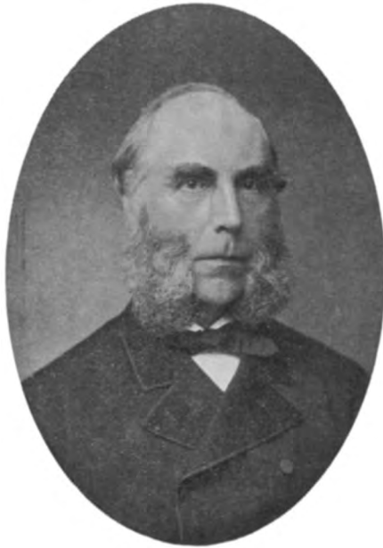
Prof. Mr. J. DOMELA NIEUWENHUIS.