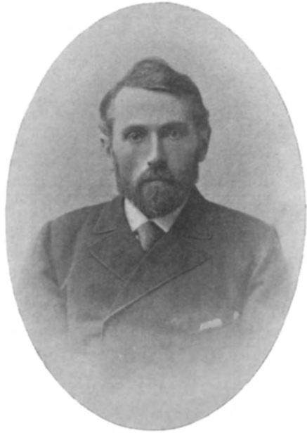
Prof. Dr. W. H. BAKHUIS ROOZEBOOM.