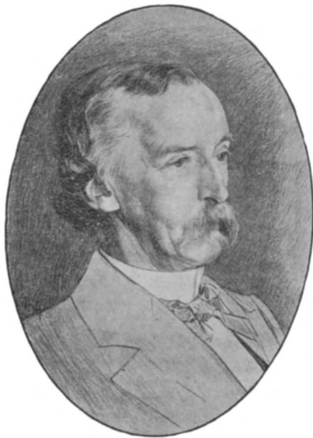
Prof. Dr. C. P. TIELE.