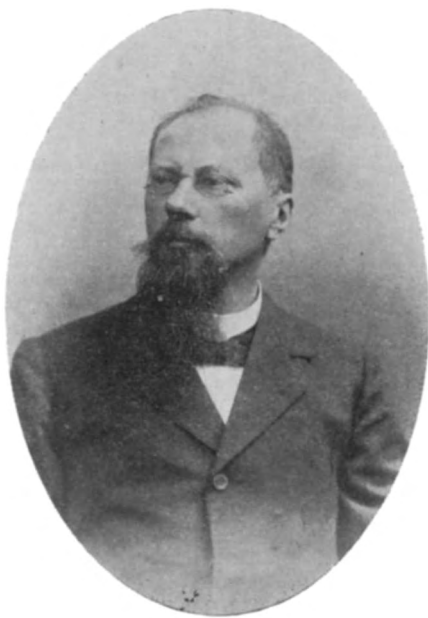
Prof. Dr. C. A. PEKELHARING.