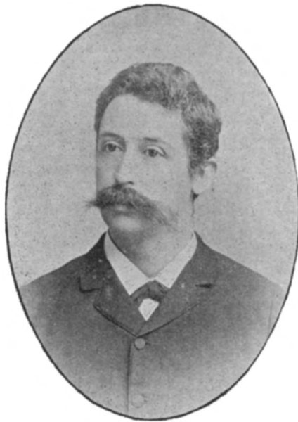
Prof. Dr. C. EYKMAN.