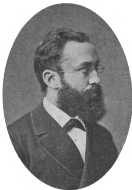
Prof. Dr. H. A. LORENTZ.