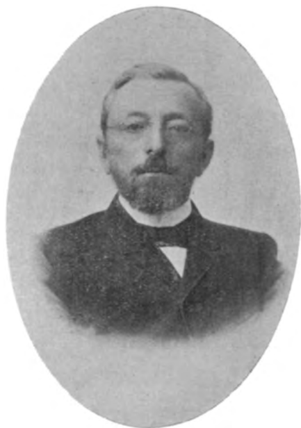
Prof. Dr. M. Th. HOUTSMA.