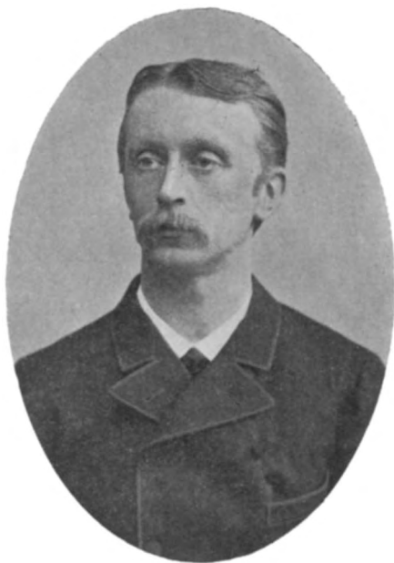
Prof. Dr. J. C. KAPTEIJN.