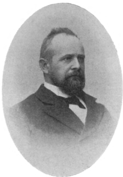
Prof. Dr. J. RITZEMA Bos.