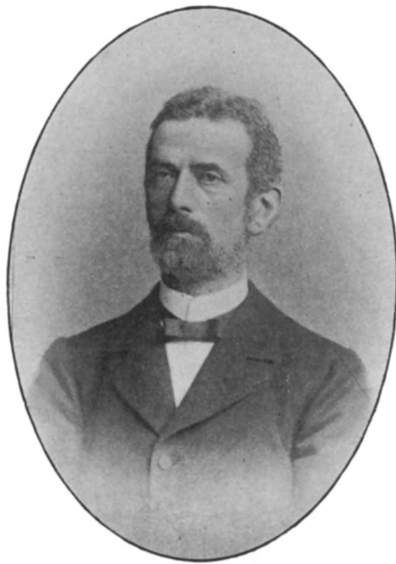
Prof. Mr. C. Asser.