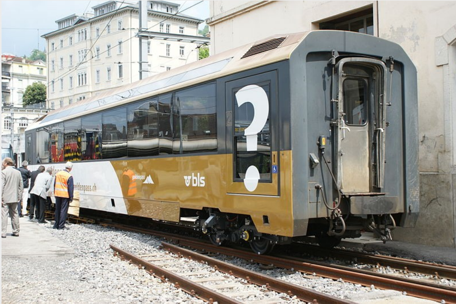
MOB BDs 220 by Markus Giger