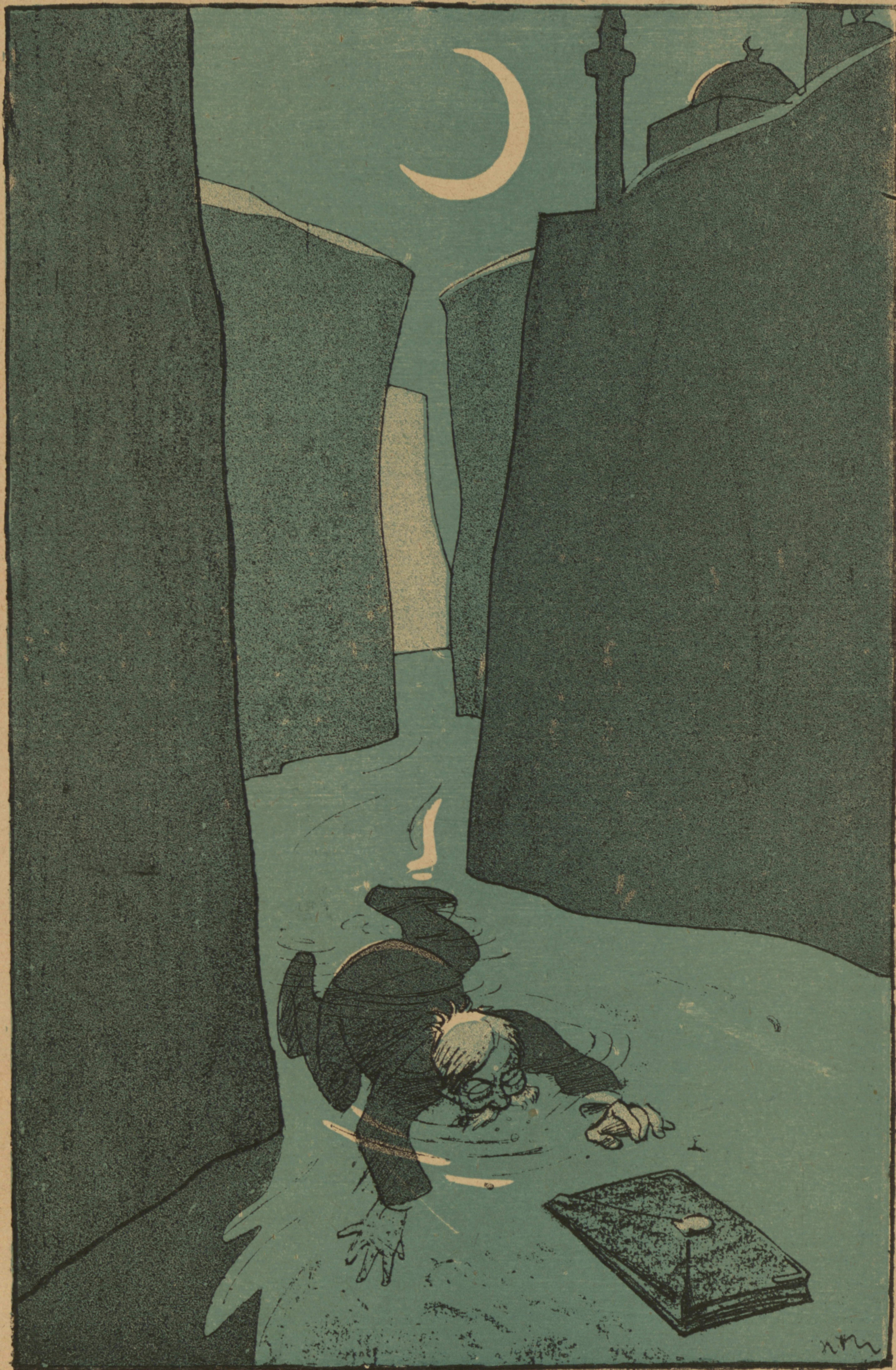
Милуковъ: — Какое, однако, чертовски быстрое теченіе въ этихъ проливахъ!