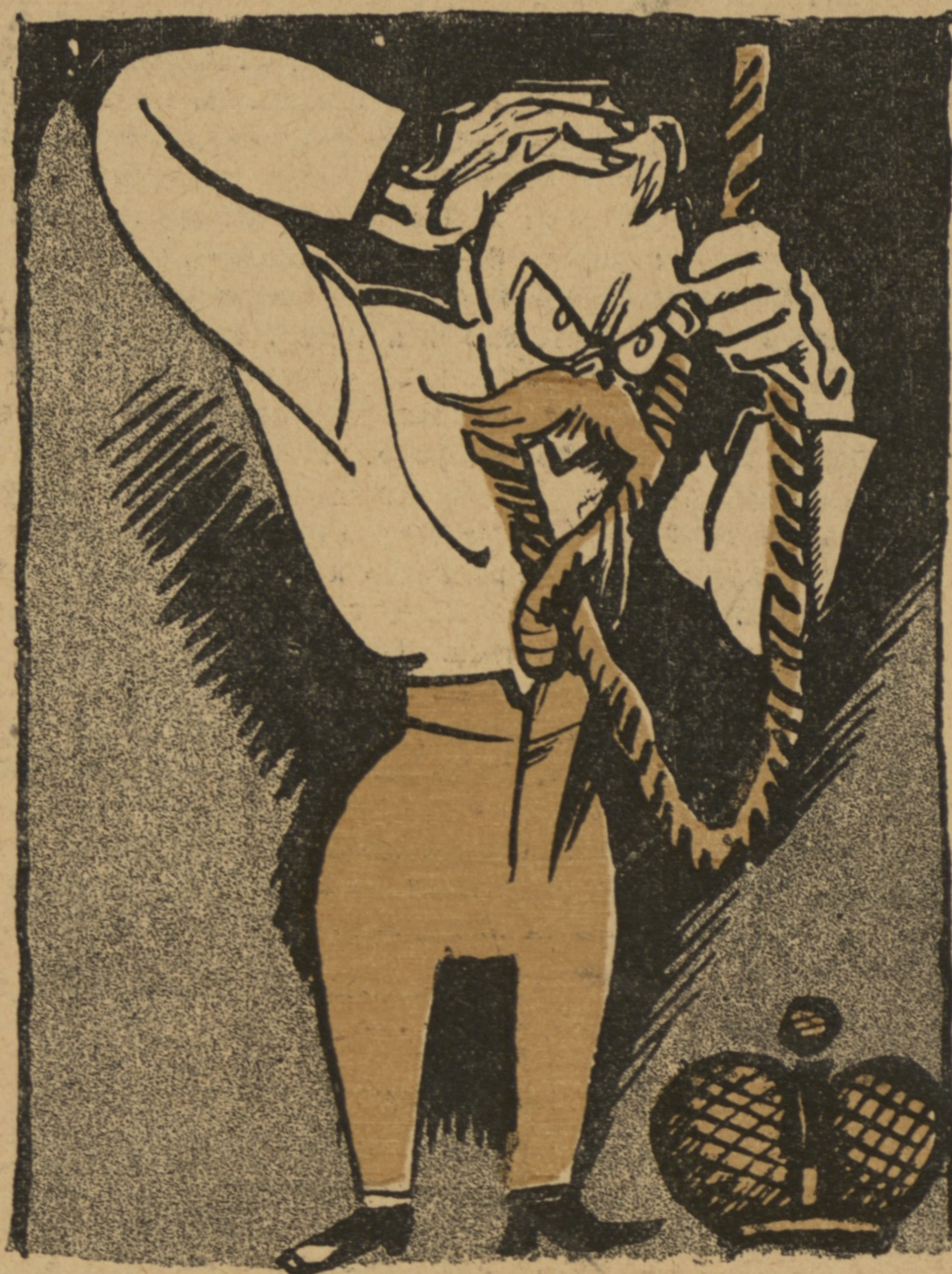
1) Одни представляют себѣ Николая въ заточеніи такъ.