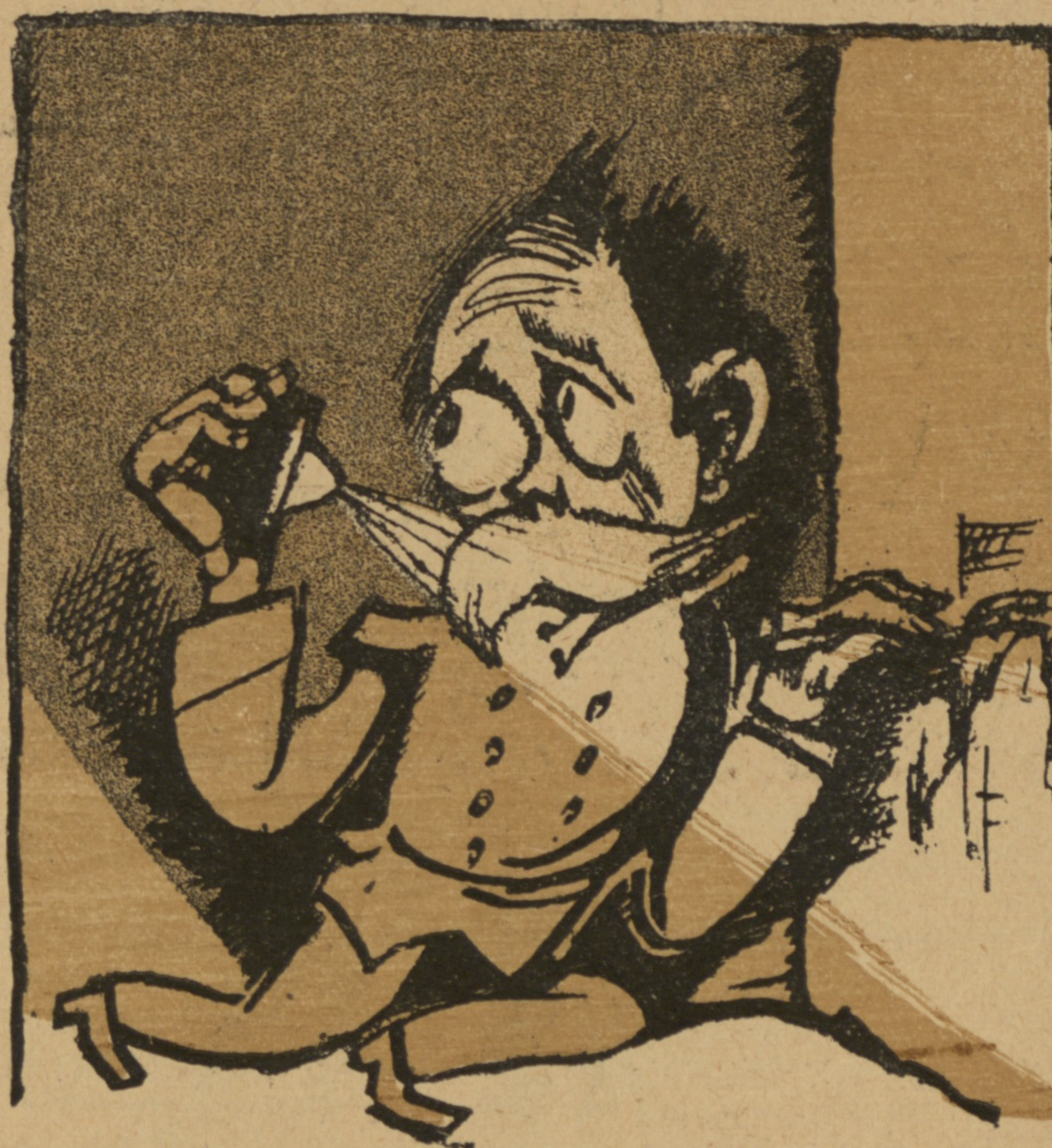
3) Или такъ.