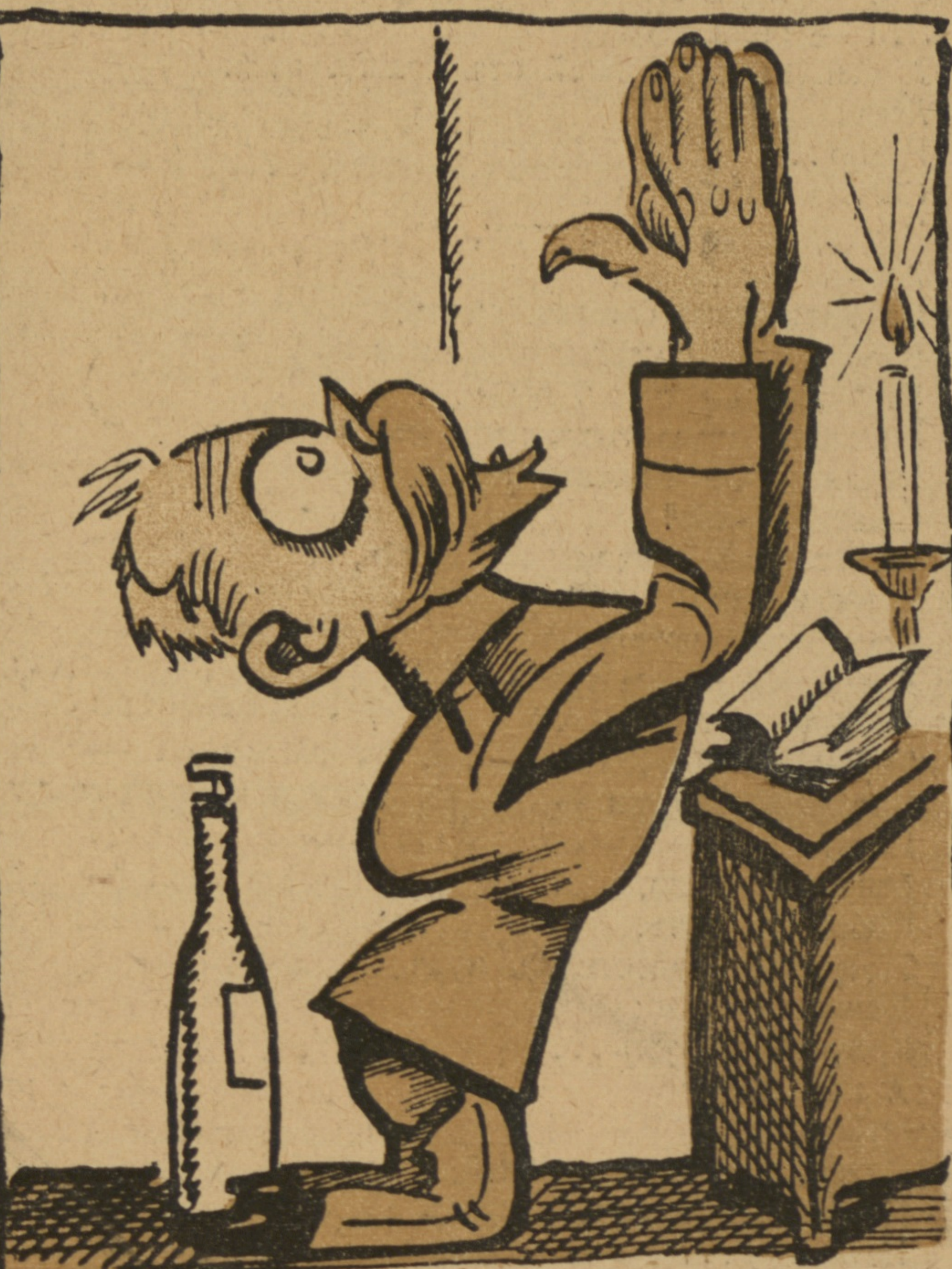
2) Другіе вотъ какъ.