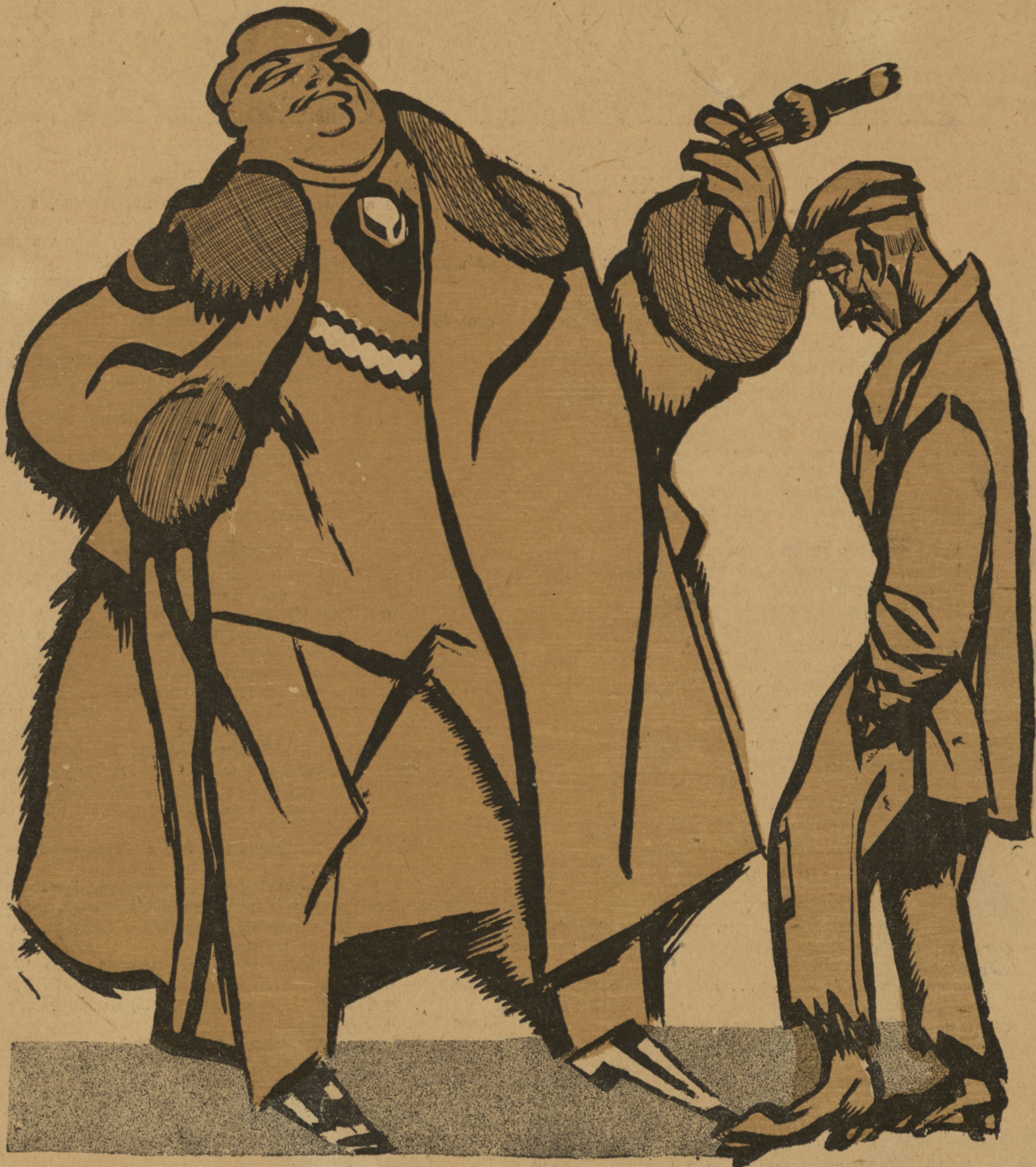
Рис. А. Радакова.