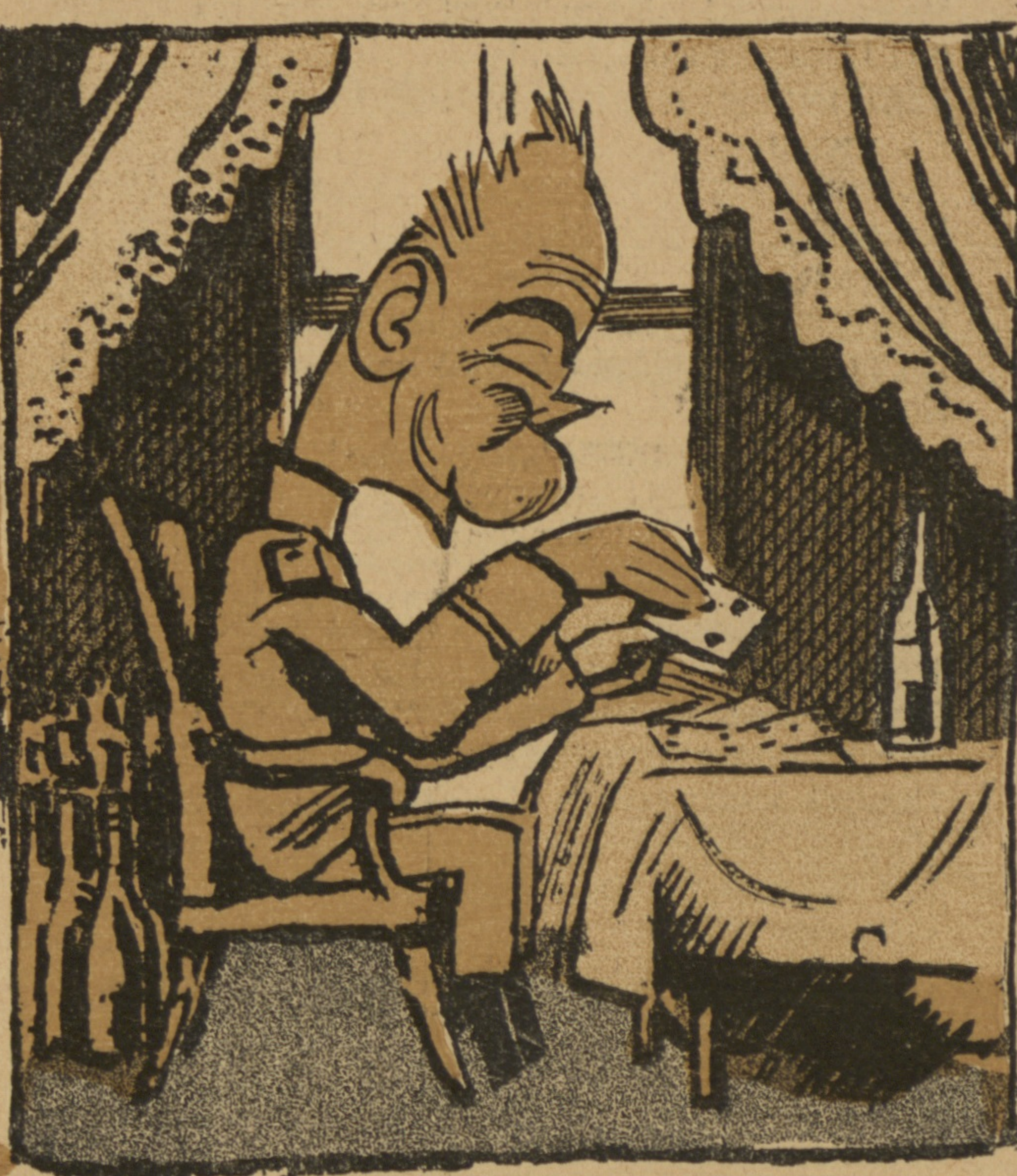
4) А онъ сидитъ тихо и мирно и на картахъ гадаетъ, когда его Родзянко опять царствовать позоветъ.