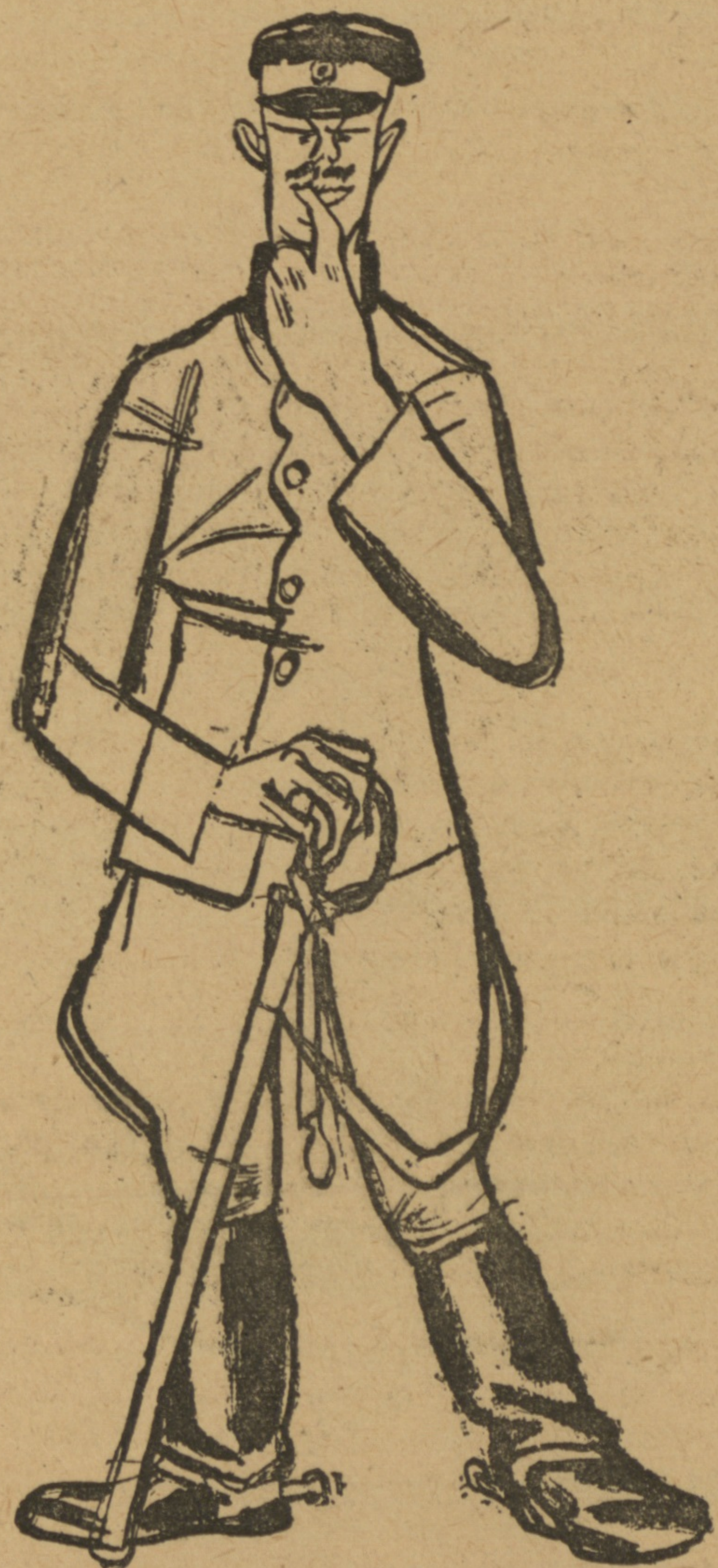
Рис. В. Л.