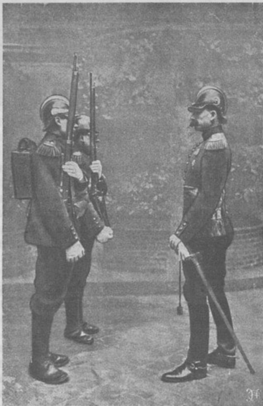
Новая форма обмундированія французской пѣхоты, по рисункамъ художника Детайля. Пѣхотинцы отдають честь.

— Загадочный человекъ,—сказалъ, покачивая головой, Савурскій. Это какой-то поэтъ карточной игры и вмѣстѣ съ тѣмъ удивительно симпатичная личность... Взглянуть на тебя своими лучистыми голубыми глазами, и такъ вотъ и