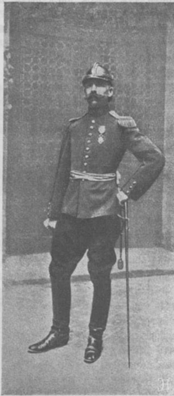
Новая форма обмундированія французской пѣхоты, по рисункамъ художника Детайля.

Какъ извѣстно, въ мартѣ мѣсяцѣ текущаго года исполнилось ровно полтора года, какъ въ пѣхотныхъ полкахъ учреждена новая должность старшаго штабъ-офицера въ чинѣ полковника безъ опредѣленнаго положенія.