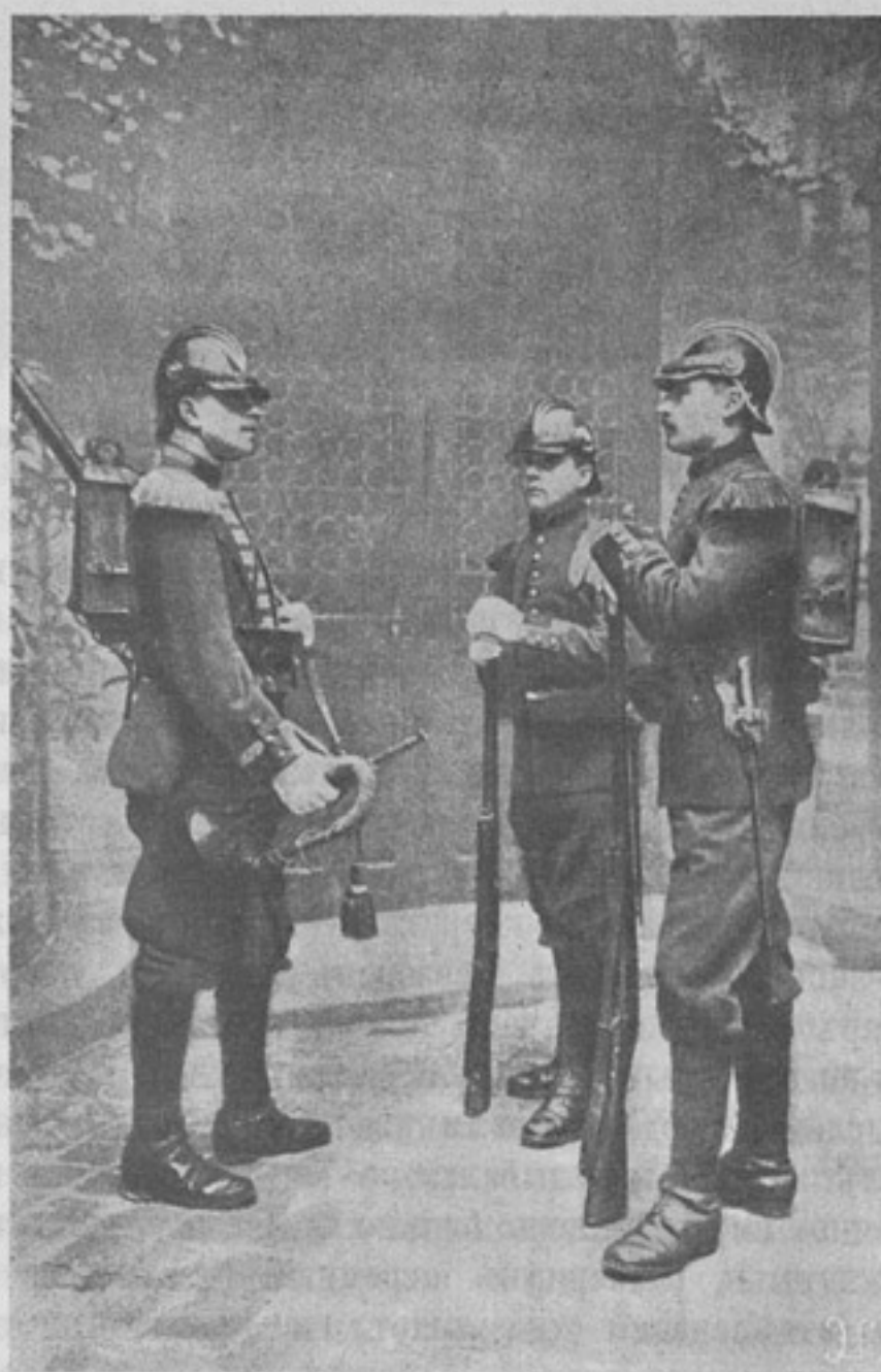
Новая форма обмундированія французской пѣхоты, по рисункамъ художника Детайля. Горнисть и пѣхотинцы.

— Я думаю хватить заплатить за ужинъ,—сказалъ онъ, смѣясь, и высыпалъ на столъ тридцать шесть тысячъ. Испуганный лакей, разливавшій шампанское, выронилъ бутылку и облилъ эту кучу денегъ виномъ.