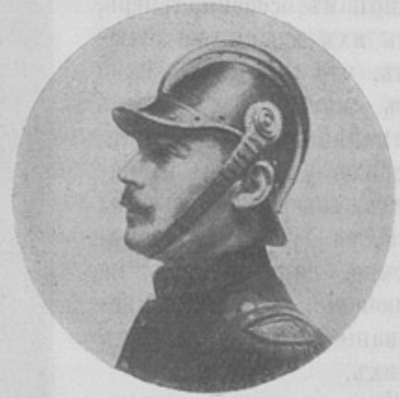
Новая нарка французской пѣхоты.

почти для всѣхъ насъ были часами отдыха и веселаго развлечения потому, что тутъ изобрѣтательность классныхъ шалопаявъ и остряковъ доходила до своего апогея. Но, проходя съ невольной улыбкой мимо воспоминанія, какъ у насъ у француза читали вмѣсто молитвы передъ ученіемъ «Птичку Божію», а толстаго нѣмца чуть не довели до апоплексическаго удара, такъ что онъ обозвалъ весь классъ юнкеровъ мерзавцами, я быстро теряю веселое настроеніе, такъ какъ эти веселые часы недавно припомнились мнѣ въ такой обстановкѣ, что я горько пожалѣлъ, что они были такъ веселы.