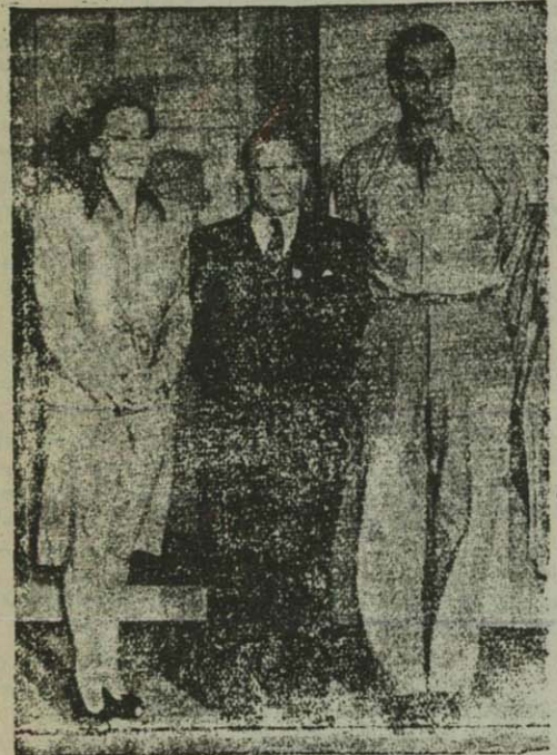
الیوت روزولت در حال بود

عقبتی ایوت روزولت در مجلس شورای ملی امریکا و در حال بود نشان میدهد. عکس هنکای برداشته شده که نمایندگان ملل متفق در کنفرانس سانفرانسیسکو جمع شده بودند و عده ای از آنها یک روز سفری به ایلیوت شهر شمالی امریکا کرد. آقای اردمیر رئیس اداره کلرنامه وزارت خارجه، یکی از آنها بود که ستیاست روزولت در وسط ایستاده است. در طرف راست آقای اردمیر، «دنی امرسن روزولت» دیده میشود. «دنی امرسن» زن «الیوت روزولت» از متزیشان برجسته هالیوود است که در این وقت در خانه «علامت خطر» بازی تکریم