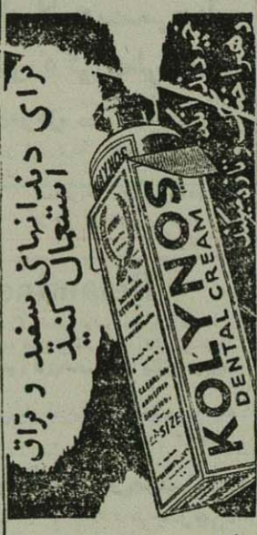
کرای دندانپزشکی استعجال کننده سفید و براق

آبپول هبار لاندول قوی روش (پنج سی سی) HEPARGLANDOL FORTE AMPOULE ROCHE (5cc) که بهترین ترکیب عصاره کید ساخت کارخانه معروف روش سوئیس است وارد شد. فروش در تمام داروخانه‌های معتبر و عده فروشان دارو-خیابان قاص خسرو ۸۴۷۱-۲ ۵-۵