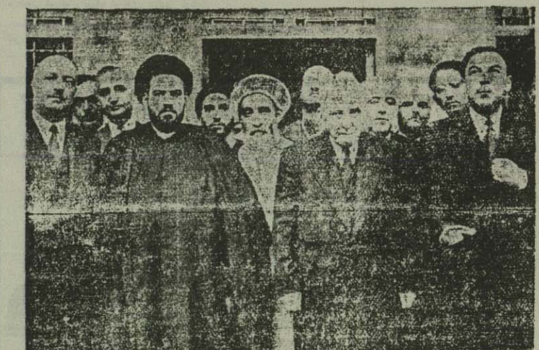
در کسولگری ایران در نجف

ظهر روز پنجشنبه، باستانفار رؤسای شرکت هواپیمایی سوئدی که باین هواپیمای تهران آمده بودند و امروز صبح با مسافری از ایران حرکت کردند، ضیافتی در سفارت سوئد داده شد که هدای از رجال ایرانی نیز حضور داشتند. در این مجلس، آقای وزیر مختار سوئد