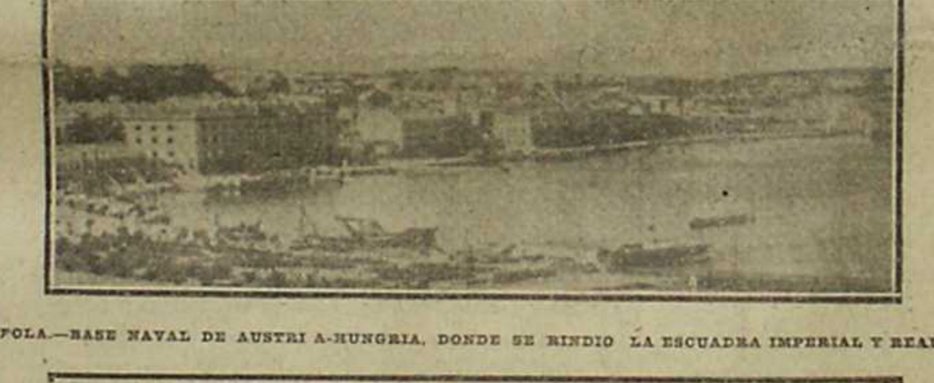
POLA.—BASE NAVAL DE AUSTRIA-HUNGRIA, DONDE SE RINDIO LA ESCUADRA IMPERIAL Y REAL