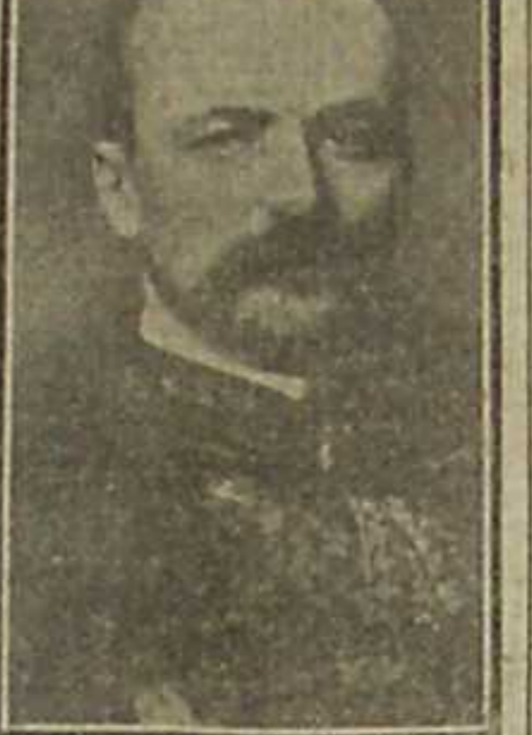
EL CONDE DE TISZA, ASESINADO AYER