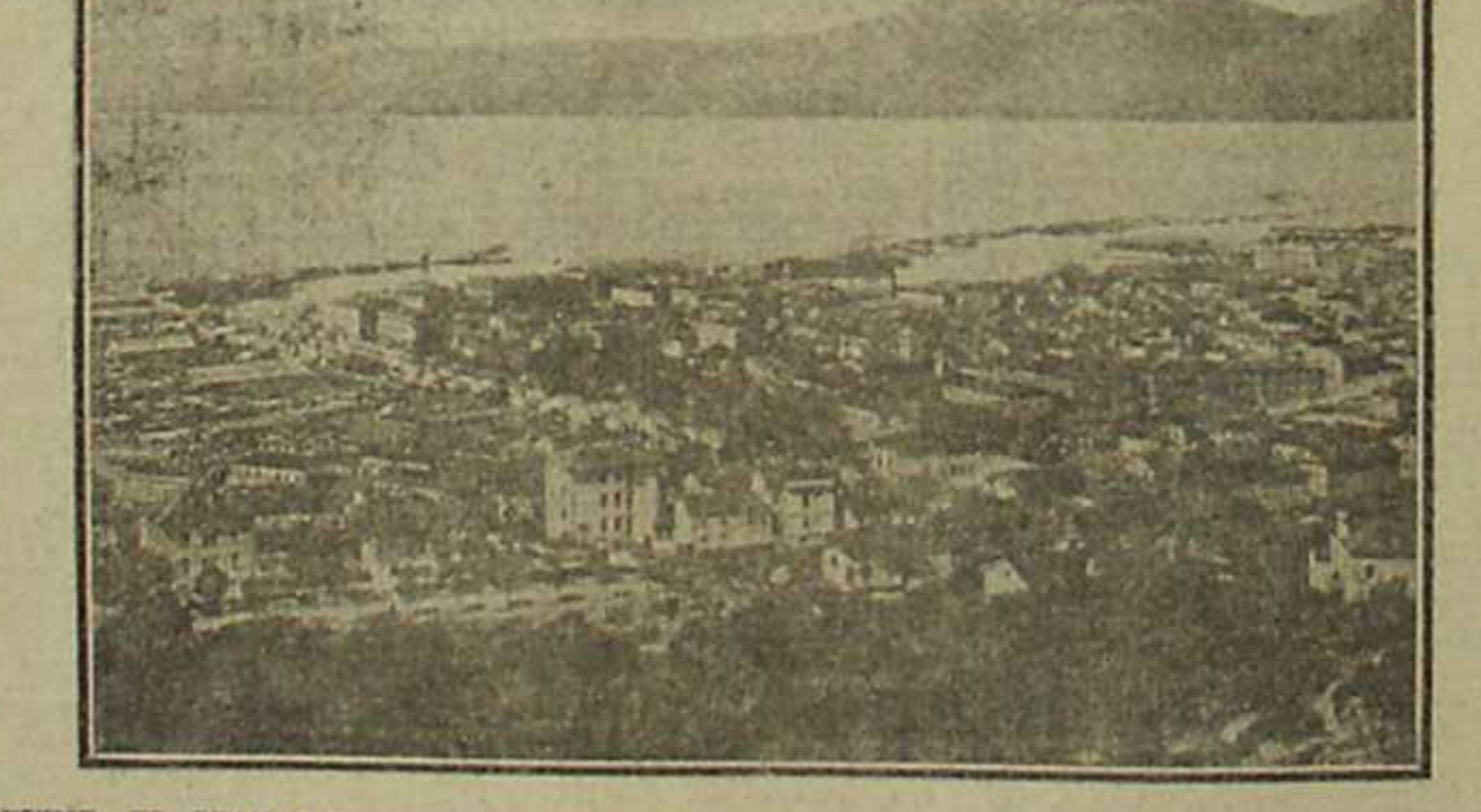
FUME.—EL GRAN PUERTO DE HUNGRIA, QUE FUE DESALOJADO POR LOS EJERCITOS AUSTRO-HUNGAROS Y EN DONDE YA GOBIERNA EL CONSEJO NACIONAL CROATA

felada, sucia, sinistra, abandonada, que rezumaba humedad... Pero pensaron, estremecidos, en la pieza que podrian tener ellos.