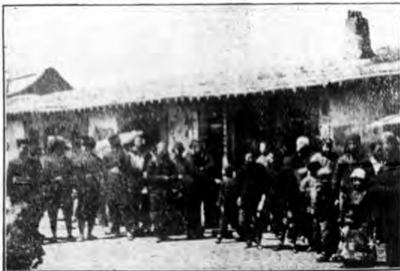
六寶昌縣臭水井村民眾候診情形

本館下鄉工作時，病民就診者頗多，往往室內不能容納，即候診院中，依次仔細診斷，對正下藥，病者咸多痊癒，成績甚佳。