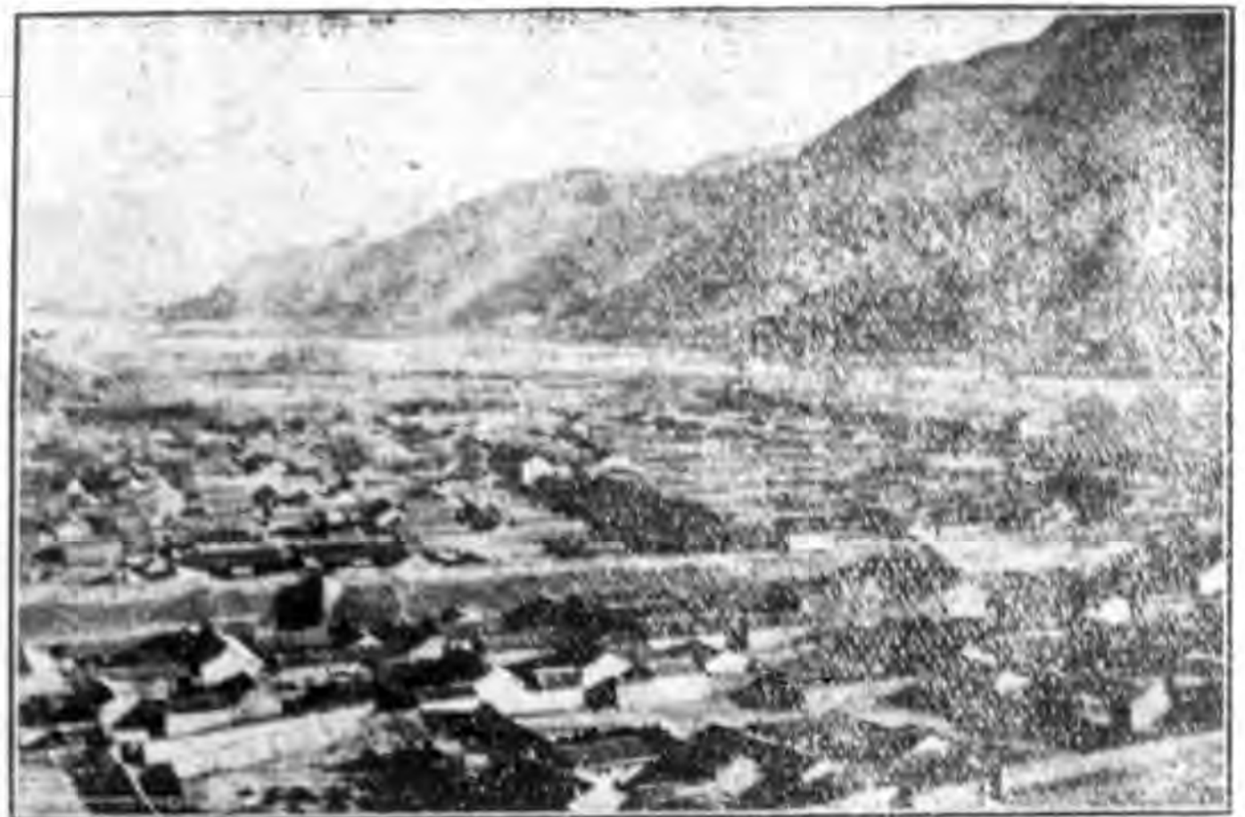
五龍關縣鷓鴣鎮全景

龍關縣鷓鴣鎮，為龍關東南隅之繁區，且為通沙赤二城之咽道，高山環繞，街衢整齊，此片即係全鎮鳥瞰。