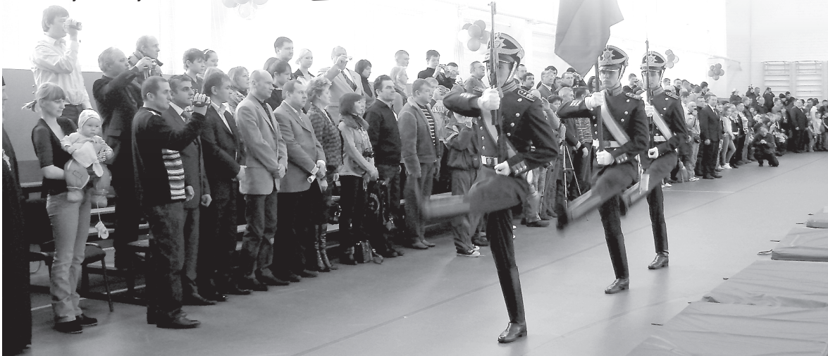
2010 год. Торжественное открытие международного чемпионата по единоборствам