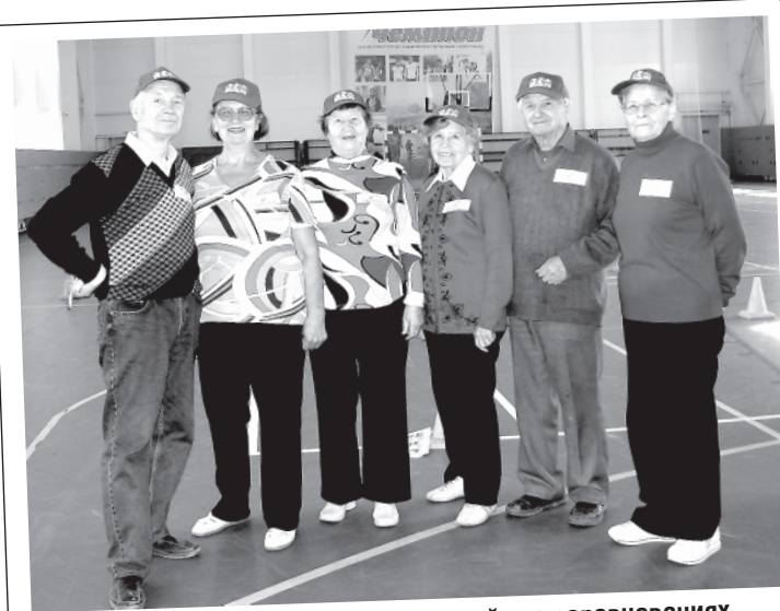
Команда треста «Переславльстрой» на соревнованиях в ФОКе, посвященных Дню пожилого человека. 2011 год