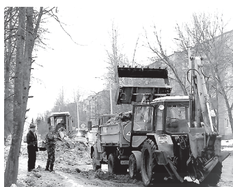
Коммунальщики вывозят снег с улицы Маяковского