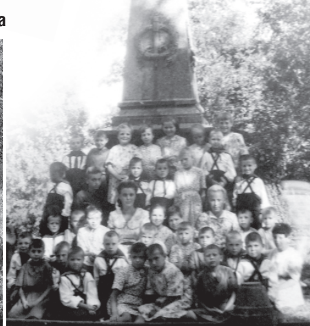
В первые годы детдом был на Ботике