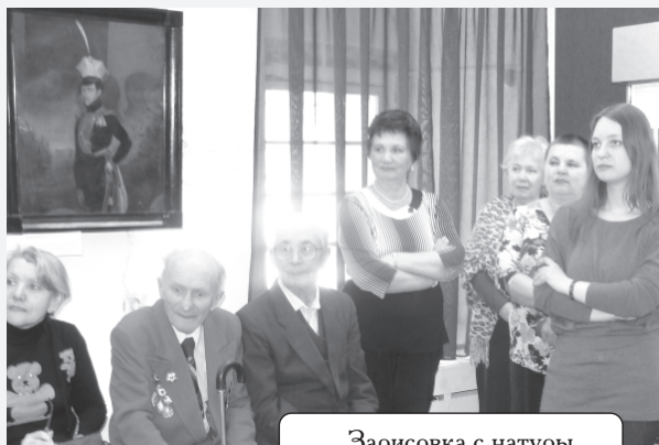
Зарисовка с натуры