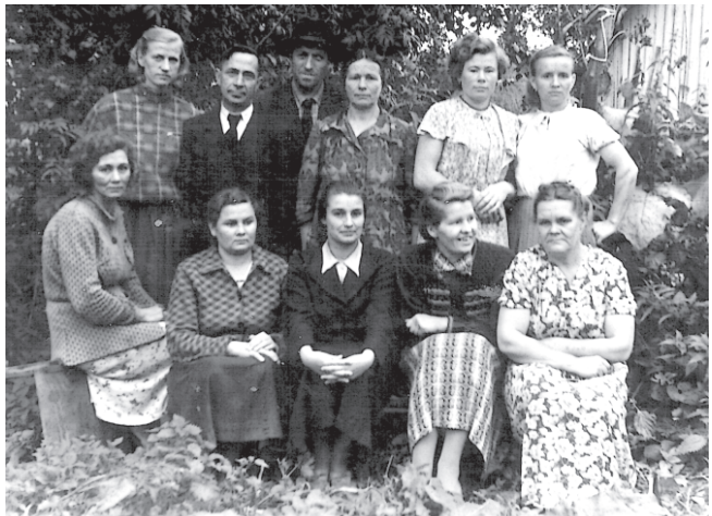
Коллектив д/д № 96, 1957 г.