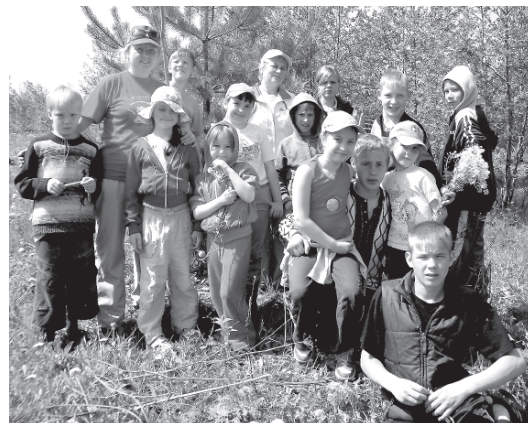
Наше время. Все вместе отдыхаем на природе