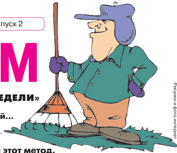
Рисунки и фото интернет