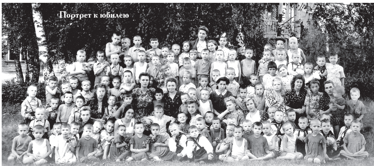
Портрет к юбилею