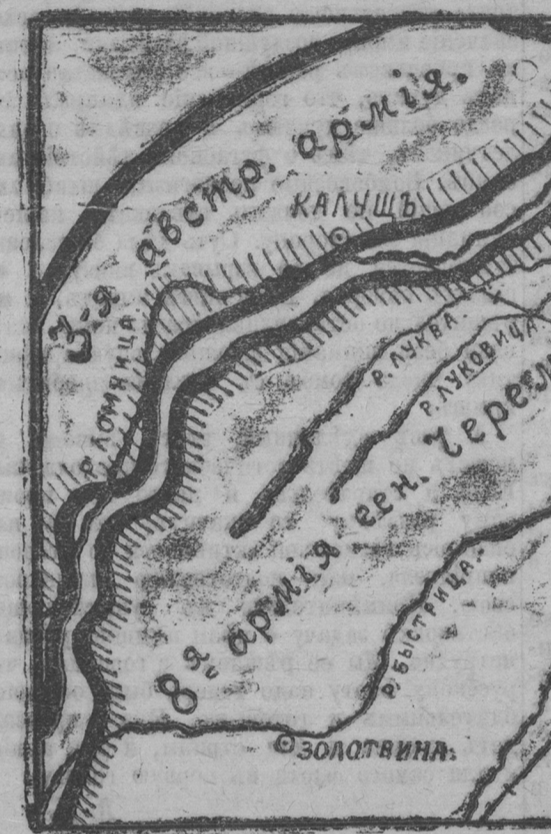
На краю пропасти.

Прорывъ нашего фронта расширяется. Полчища германскаго императора устремляются сквозь образовавшуюся брешь въ глубь революціонной Россіи, той самой Россіи которая провозгласила на весь міръ великія идеи справедливости и братства и въ первомъ порывѣ революціоннаго энтузіазма протолкнула руку германскому народу, оставившись висѣть въ воздухѣ. Русскія войска на многихъ частяхъ прорваннаго фронта не опаздали должнаго производствѣмъ неспирителю, не исполнили боевыхъ приказовъ и побѣжали со своихъ позиций, видя оружіе, сдаваясь въ плѣнъ.