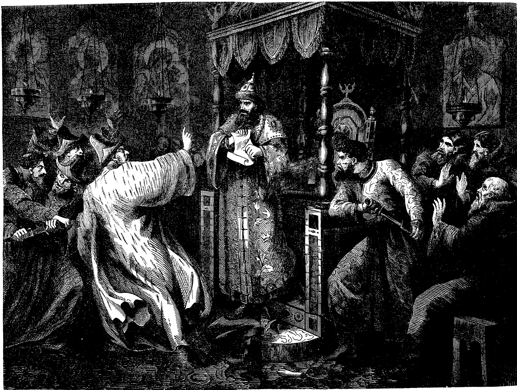
Иоаннъ III уничтожаетъ ханскую басму.