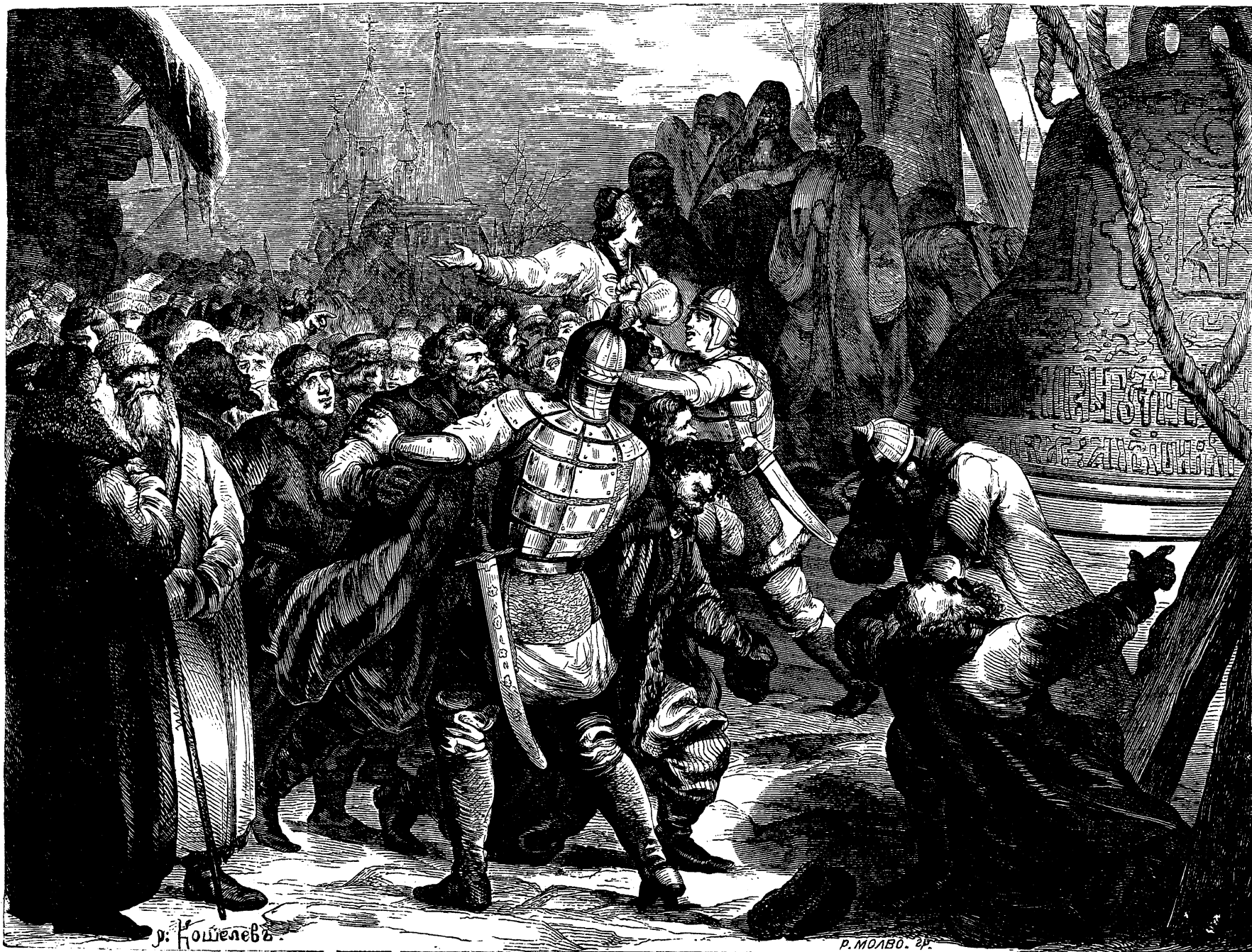
Уничтоженіе новгородскаго вѣча.