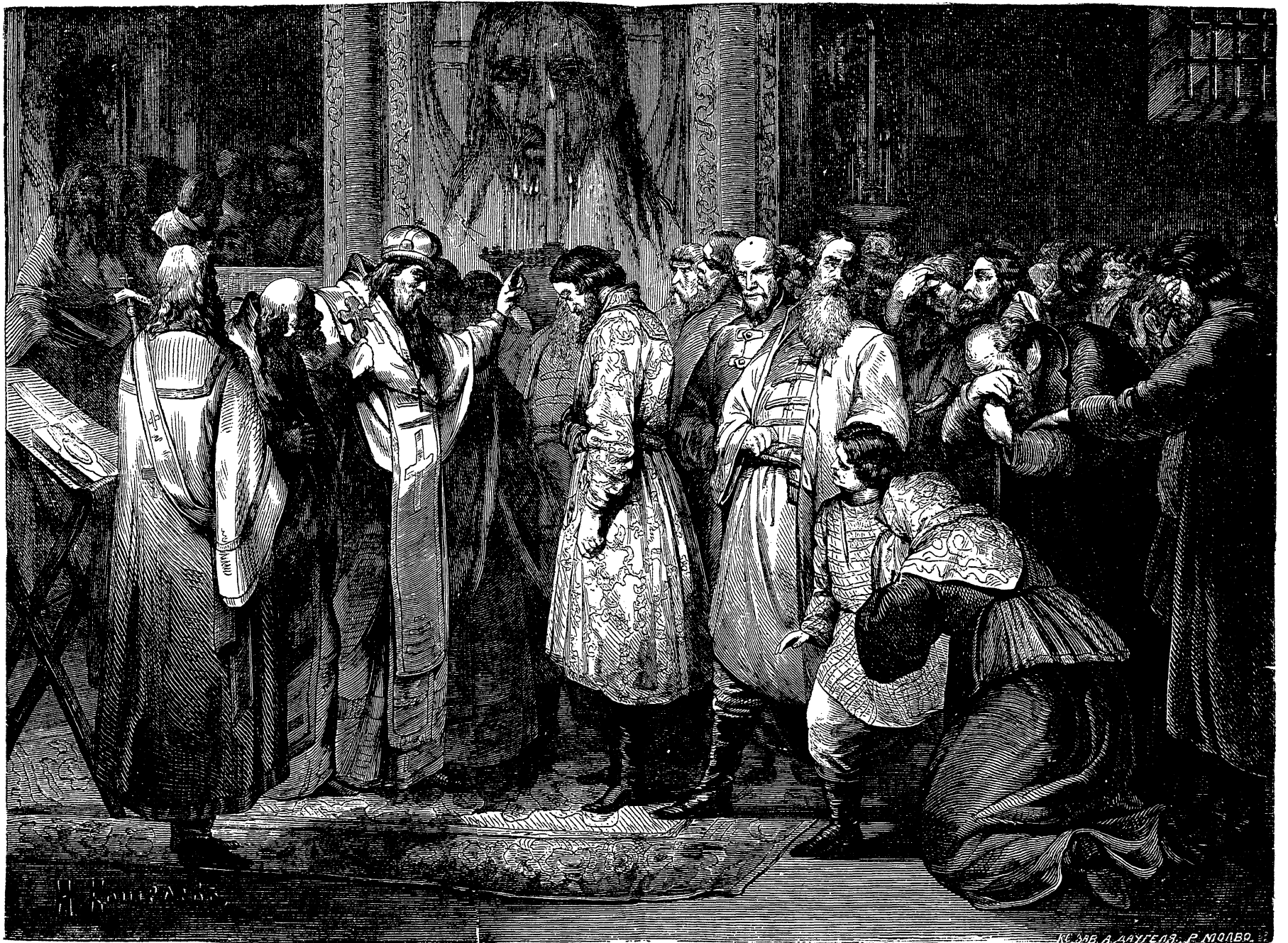
Торжество Василя III и вручина псковитянь.