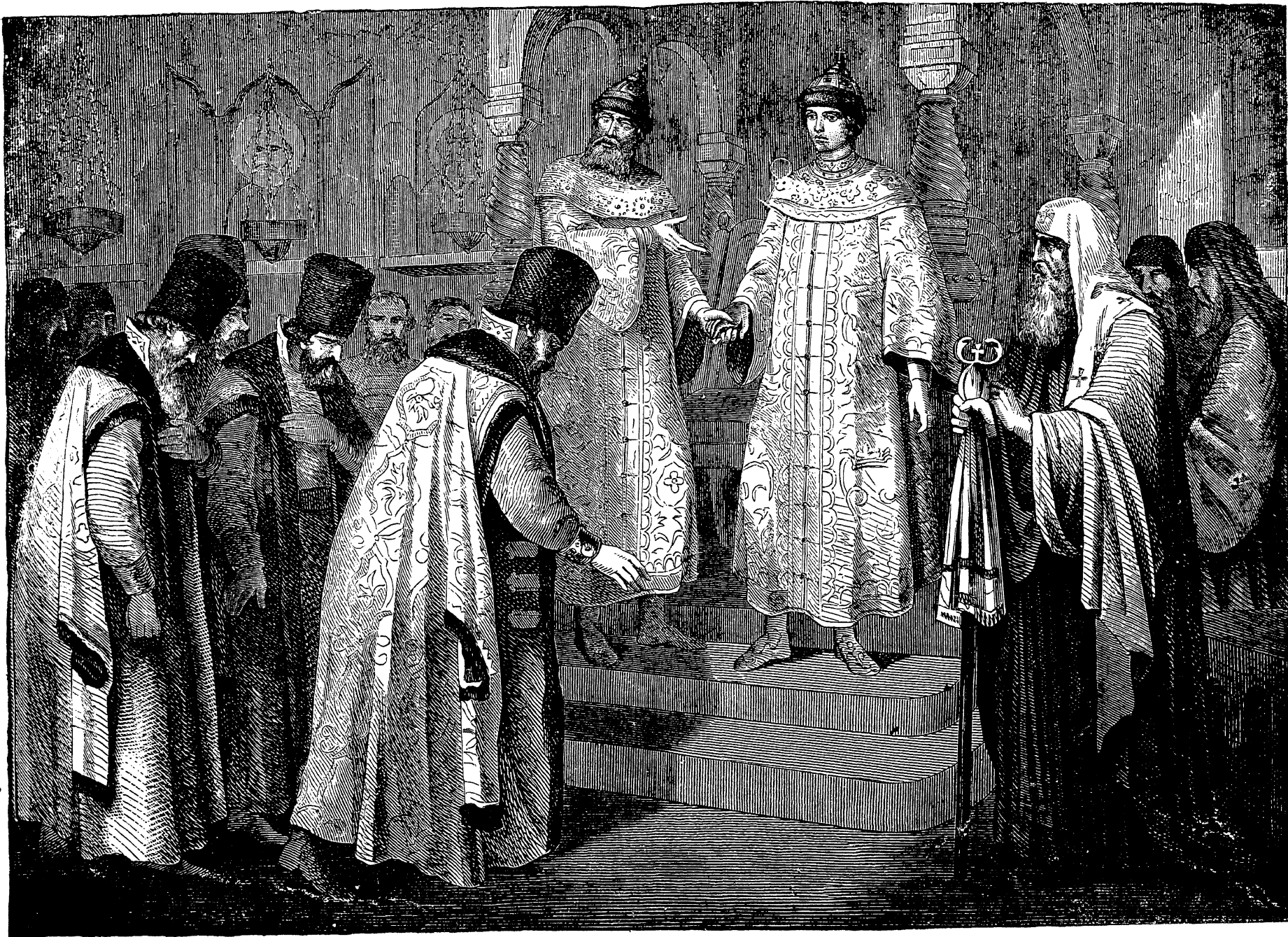
Василій и сынъ его Иванъ III.