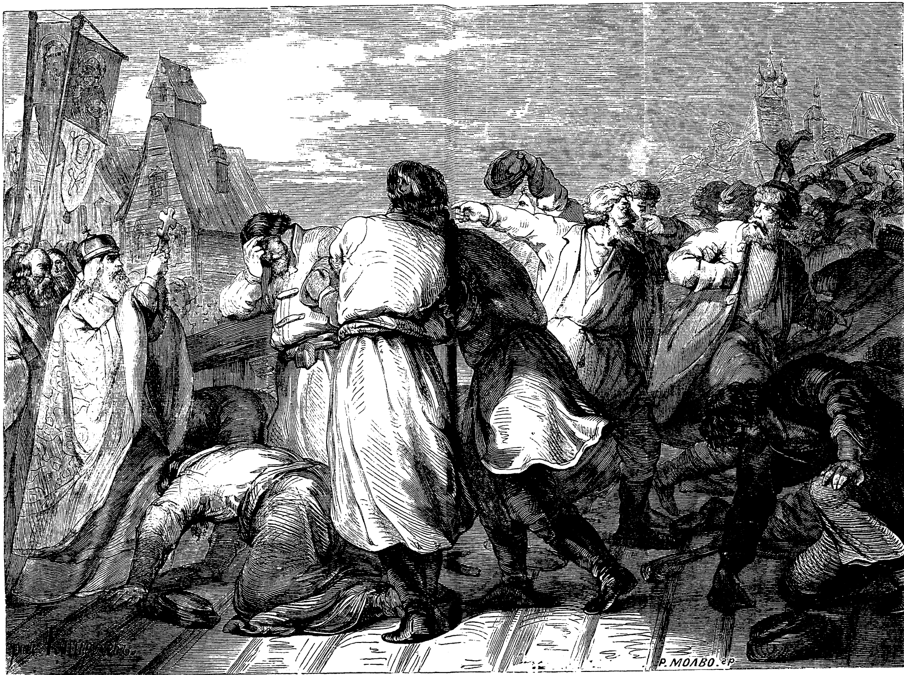
Владыко Новгородскій Симеонъ примиряетъ гражданъ.