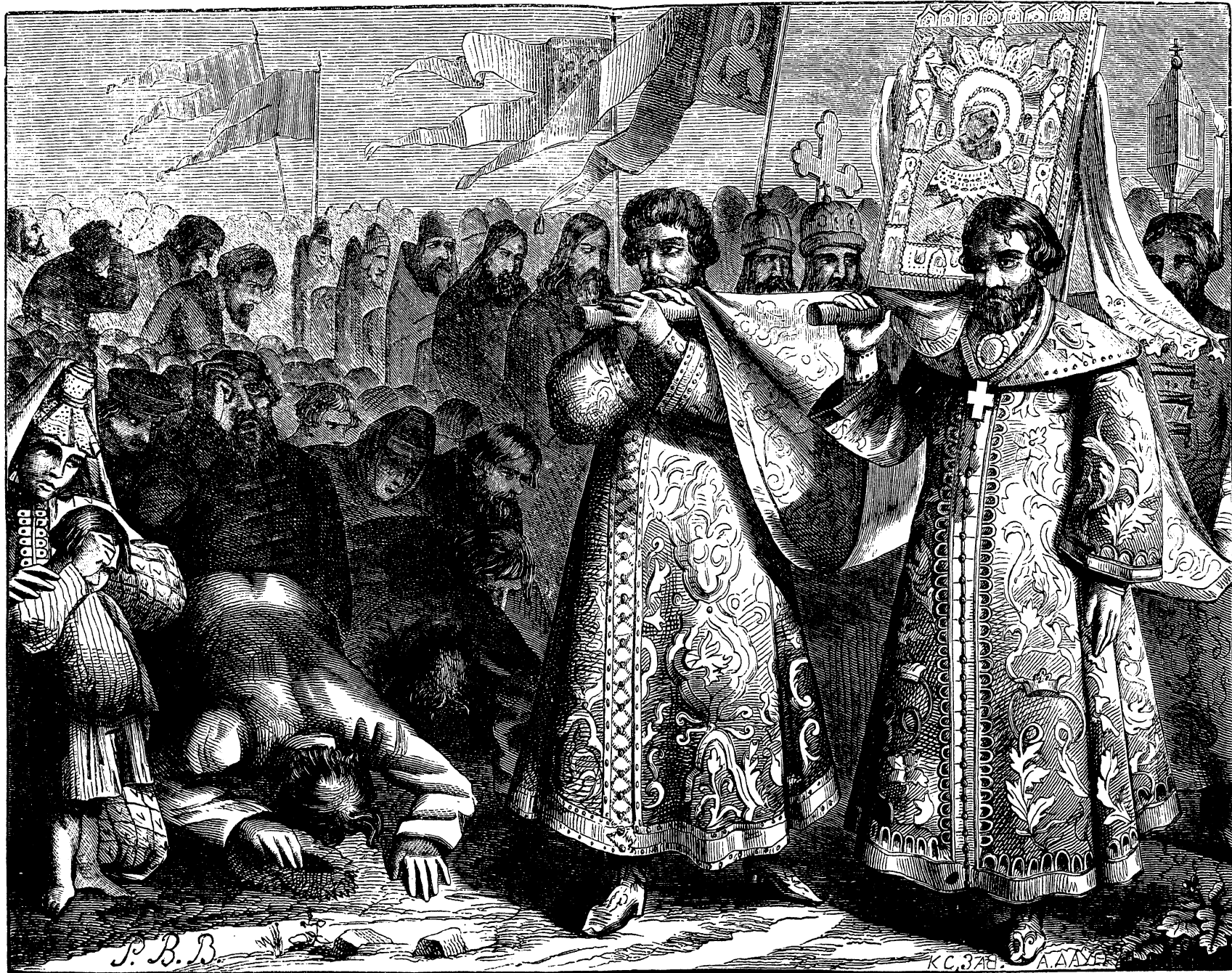
Встрѣча иконы на Кучковомъ полѣ.