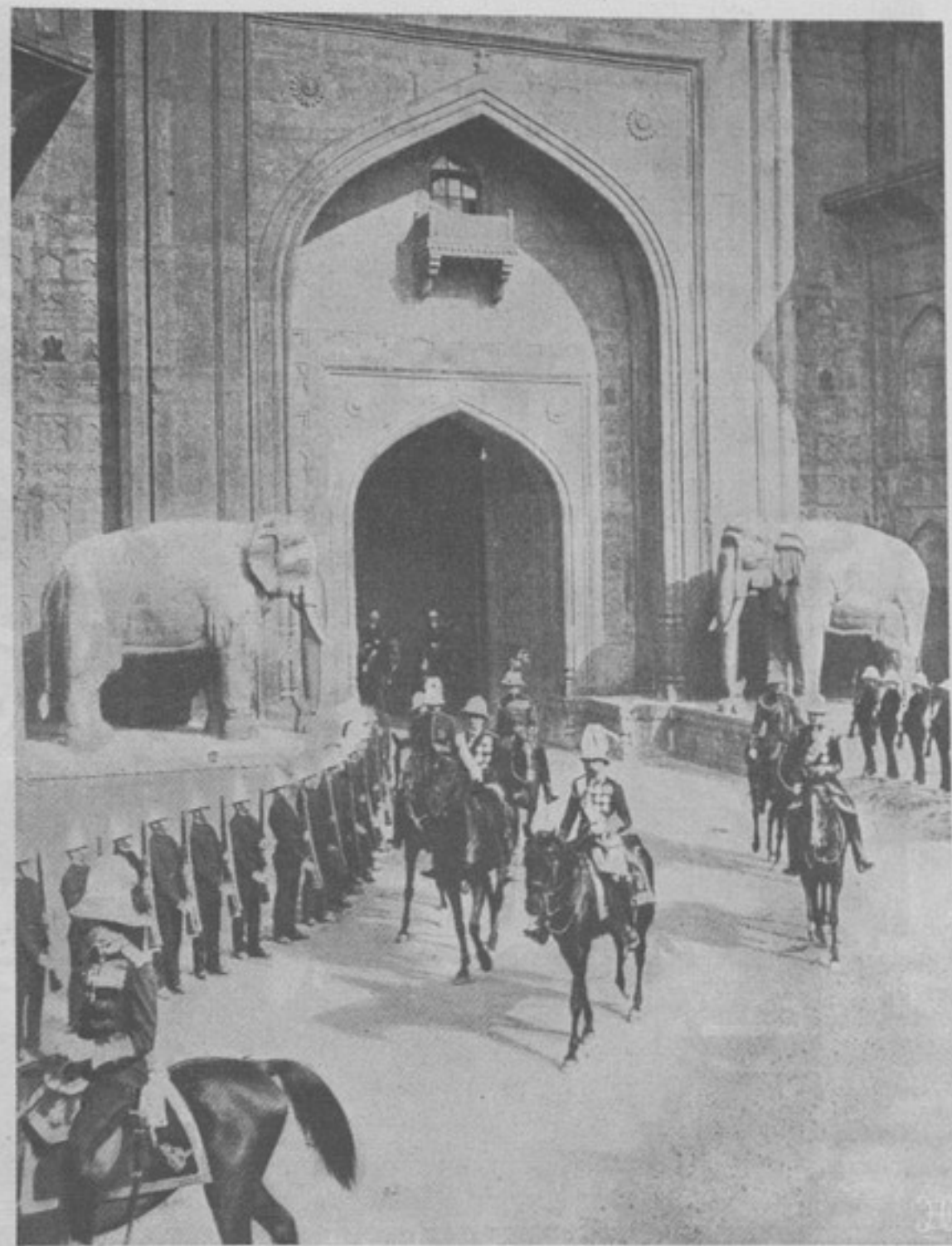
Коронаціонныя торжества въ Индіи. Императоръ выѣзжаетъ изъ знаменитыхъ воротъ Дели на смотръ войскамъ.