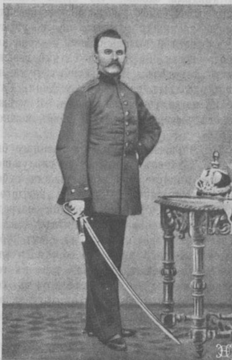
Фридрихъ Ницше въ 1868 г.

Три, перечисленные въ заголовкѣ, новыя изданія весьма полезны для военныхъ читателей. Знакомство съ проповѣдникомъ грядущаго «сверх-человѣка» Фридрихомъ Ницше