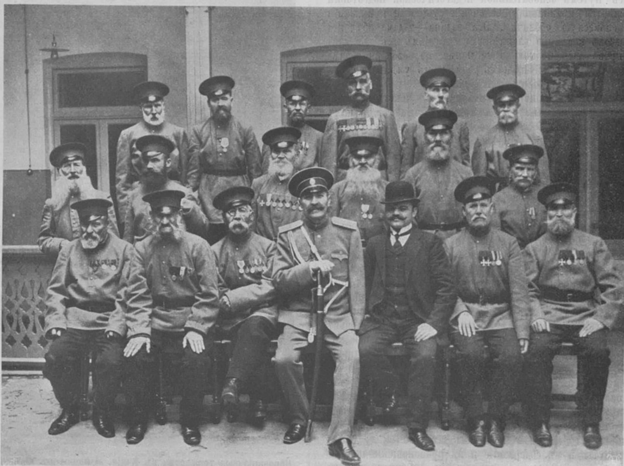
Группа кавказских ветерановъ. (Къ ст. „Кавказское военное общество помощи инвалидамъ“).