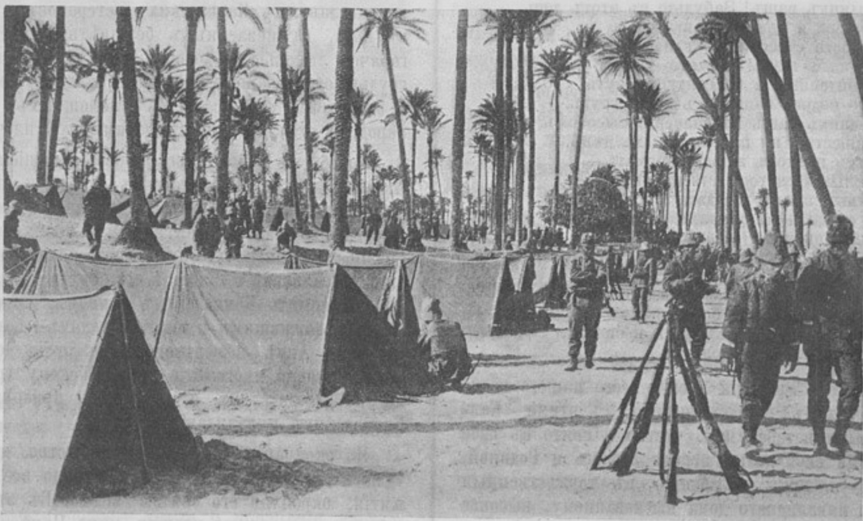
Биванъ италіанской пѣхоты на опушкѣ оазиса. (Къ ст. „Рекогносцировка въ пустынь“).

Закончимъ нашу скромную замѣтку, посвященную «Кавказскому инвалидному дому», тѣмъ, чѣмъ закончилось и торжество его освященія—воздаяніемъ чести и славы всѣмъ