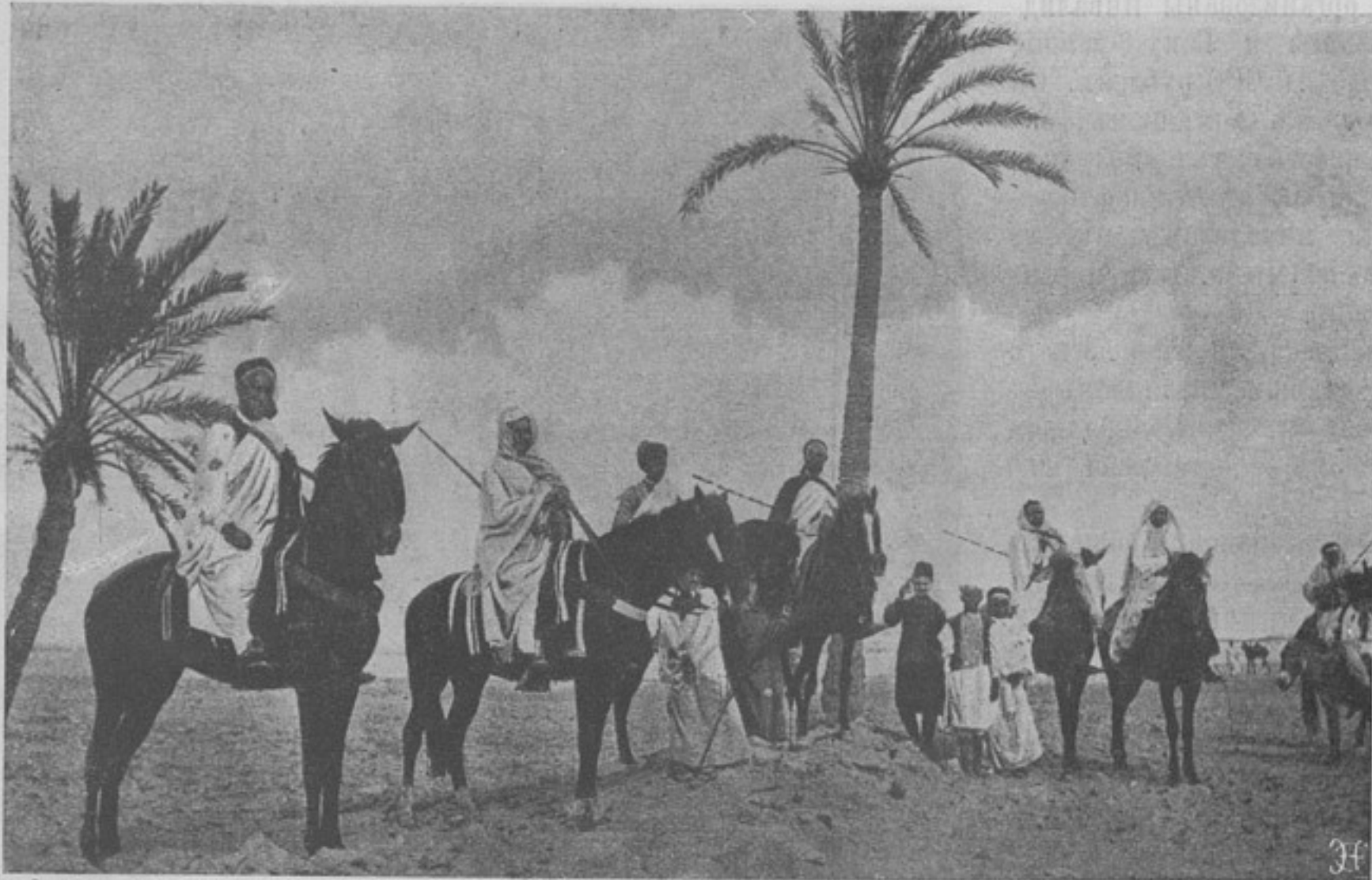
Типы арабской конницы въ Триполитани. (Къ ст. „Рекогносцировка въ пустынь“).