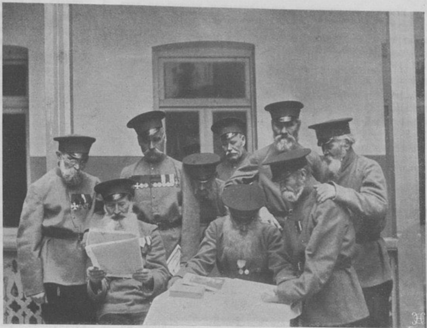
Кавказскіе ветераны за чтеніемъ. (Къ ст. «Кавказское военное общество помощи инвалидамъ»).

Въ этомъ братскомъ единеніи прежде всего нашего военного общества, а затѣмъ и гражданскаго, съ этими «Кавказа славнаго сѣдыми ветеранами», честно и свято въ свое время исполнившими свой долгъ передъ Царемъ и Родиной, и заключается, по нашему убѣжденію, въ торжественныя минуты освященія инвалиднаго дома высказанному, высокое нравственное и воспитательное значеніе дня освященія инвалиднаго дома. Этотъ домъ—живое и краснорѣчивое выра-