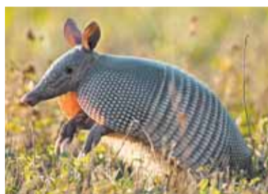
Броненосцы – разносчики лепры

терия лепры – ее «родственница». Вообще лепра – самый первый известный человеку возбудитель инфекционной болезни. Лепра упоминает-