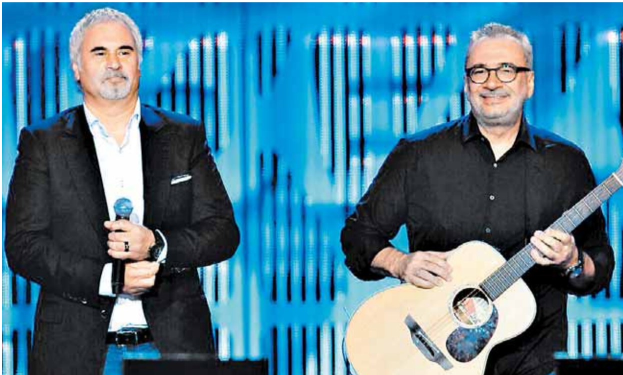
Валерий и Константин: прощальная самба белых мотыльков

Меладзе что-то отвечает шепотом, что явно радует просителя.