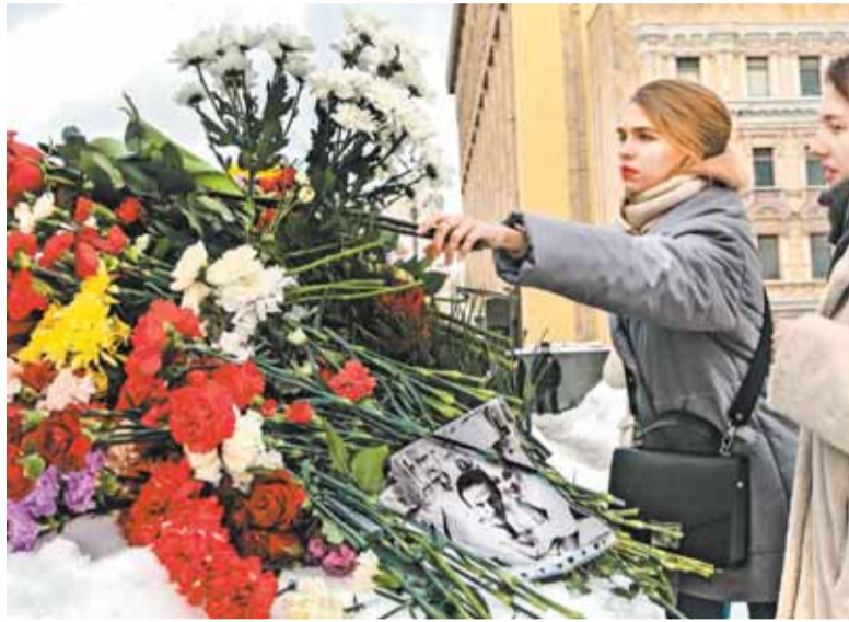
Цветов было море

В Москве один из стихийных мемориалов в память об Алексее Навальном* возник возле Соловецкого камня на Лубянской площади. Люди стали нести цветы к памятнику жертвам репрессий, как только появились сообщения днем 16 февраля 2024 года о смерти политика.