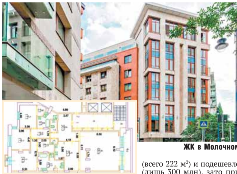
ЖК в Молочном

«Компания «Тепло-Инвест» была «дочкой» газпромского ОАО «Межрегионтеплоэнерго»,