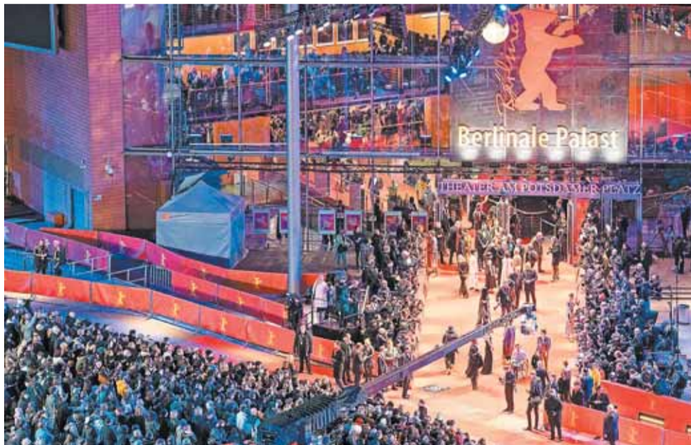
Берлинале. Церемония открытия