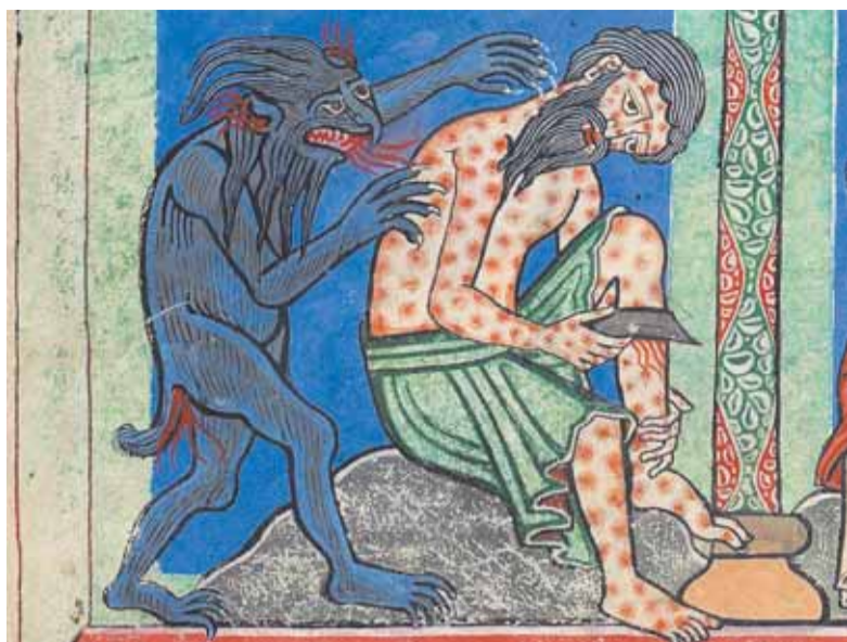
На древних гравюрах проказа всегда изображалась «в обнимку» с нечистой силой