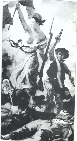
الثورة الفرنسية تعهدت بتقديم العونة المسلحة للشعب الراقية في ممارسة حقه في تقرير مصيره

ويعتبر استقلال السودان في 1/1/1968 مثلا حيا لتقرير المصير عن طريق مجلس وطني أو هيئة ممثلة للشعب حيث تقرر في 12 شباط (فبراير) 1963 توقيع اتفاق بين مصر وبريطانيا لانهاء الحكم الثنائي على السودان وحدد الاتفاق لذلك فترة انتقالية لا تتجاوز الثلاث سنوات يقرر خلالها الشعب السوداني مصيره وذلك من خلال هيئة وطنية أو جمعية مستقلة للشعب لتتخب لهذا الغرض(18) . وبالمعمل تم انتخاب مجلس وطني مستقل للشعب في أواخر عام 1963 ومارس هذا المجلس ، باقتضاه الهيئة في السودان في أواخر عام 1963 ، هذه الوسيلة وقررت السياسية الرسمية الممنحة للشعب السوداني ، هذه الوسيلة وقررت بالاجماع اعلان استقلال السودان في يوم 19/12/1960(17) . وكذلك يقرر المجلس الوطني السوداني في آذار (مارس) 1960 من استقلال عن المجموعة الفرنسية وانصلت موريتانيا في 28 تشرين ثاني (نوفمبر) 1960(18) .