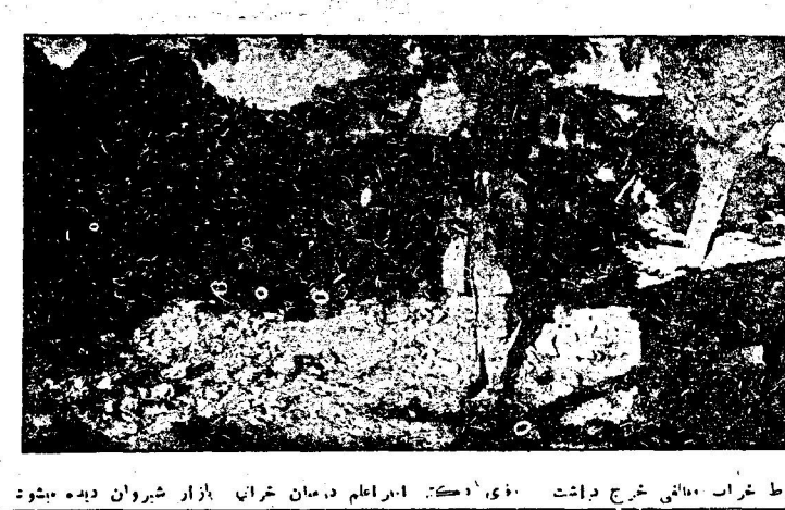
داد راضی این امر نبودند زیرا تنها شاک درواری این نقطه شراب باستانی خراج داشت. برای آنکه ابراهام دستان خراب بازار شیروان دیده میشود.

که با آنجا رفته بودیم از این اداره اداره اوراق در توش و مضطرب بود. مات و متعجب مانده هیچ نمیدانستند در برابر این رویه اداره اوراق چه بکنند. بقیده ما ادارات دولتی وظیفه دار ایجاد آسایش سردمنده مامور زحمت و بیچارگی و بدبختی مردم و اداره اوراق مجبور است در برابر این وضعیت طرفی که موجب خسارت و ضرر رها بگذرد پیدا نموده و رنم این وحشت را از اهالی قراه و