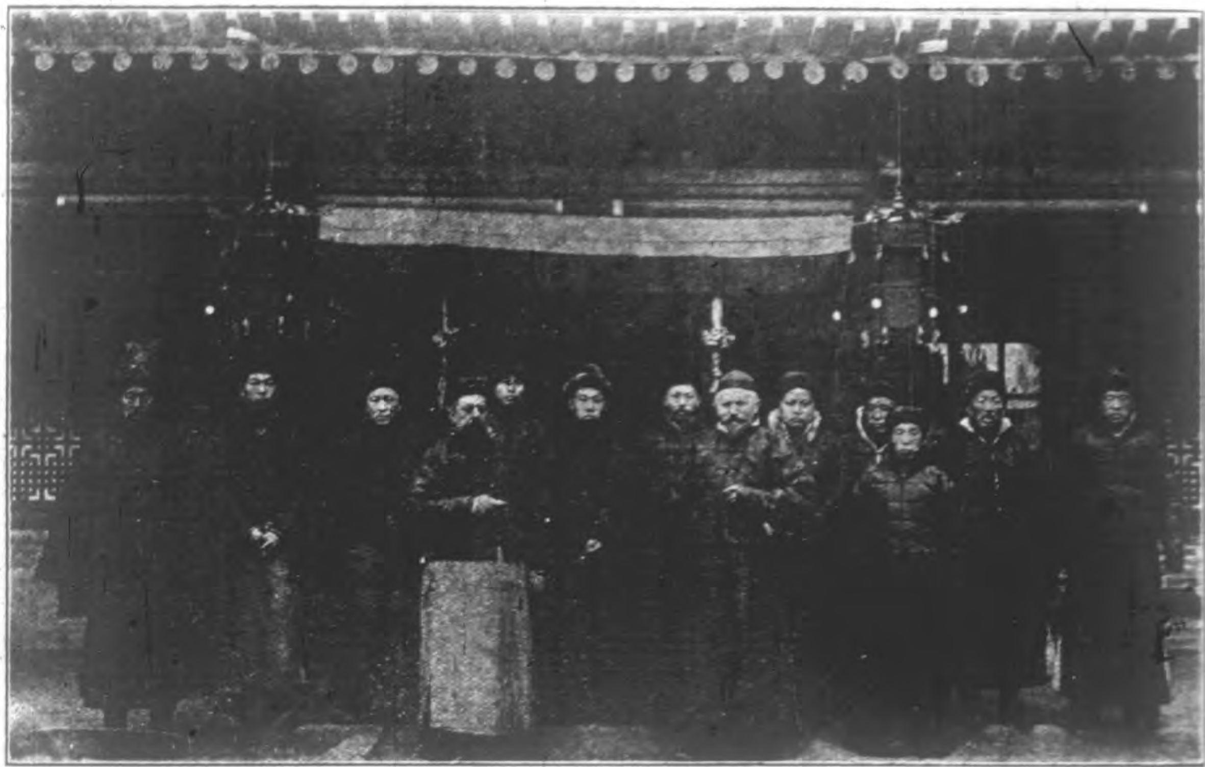
甘肅司鐸及官紳攝影