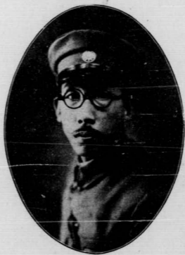
鍵何席主府政省南湖