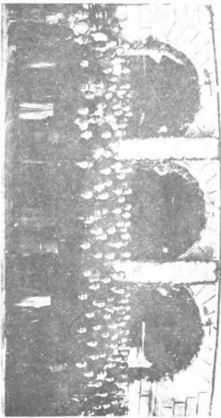
民國政府主席連任就職典禮攝影