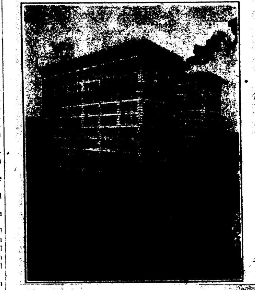
LA MAISON BLANCHE.