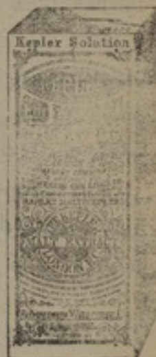
شكله مصغر جداً