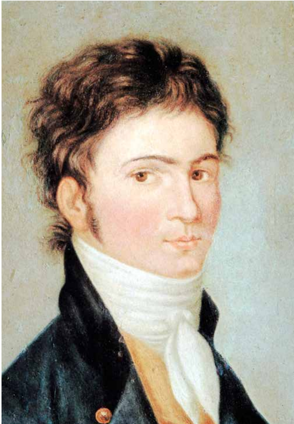
Ludwig van Beethoven, anoniem olieverfschilderij, ca. 1801

die werd aangedaan was echter Praag, waar de jonge sterpianist, net als Mozart tien jaar eerder, erg genereus werd ontvangen. Buiten het componeren van 'Ah! Perfido!' en het spelen van twee concerten is verdere informatie over Beethovens eerste verblijf in Praag schaars.