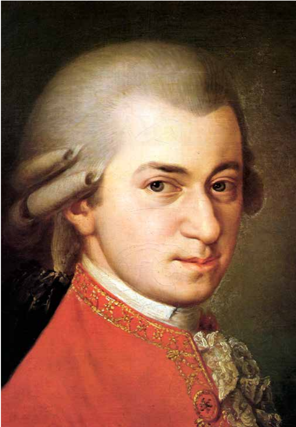
Wolfgang Amadeus Mozart. Schilderij van Johann Nepomuk Della Croce, ca. 1780

Sinds zijn vorige symfonie, de zogenaamde 'Linz Symfonie' (1783), had Mozart zichzelf heruitgevonden als componist. De jaren 1783-1786 waren jaren van experiment, waarin hij onder meer een nieuwe