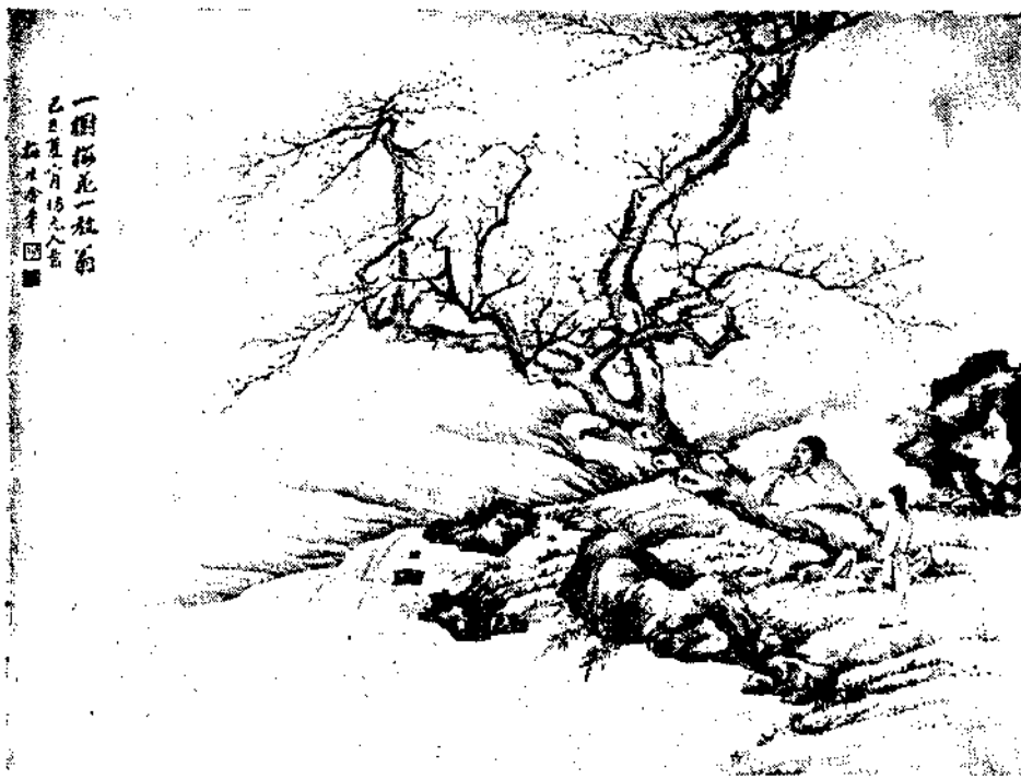
一樹孤花一枝影 已上畫一月十八日 畫月香月四日