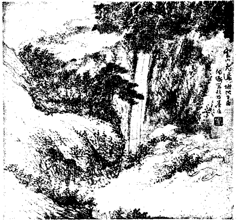
胡佩衡山水册 卷一 松壽軒隨筆