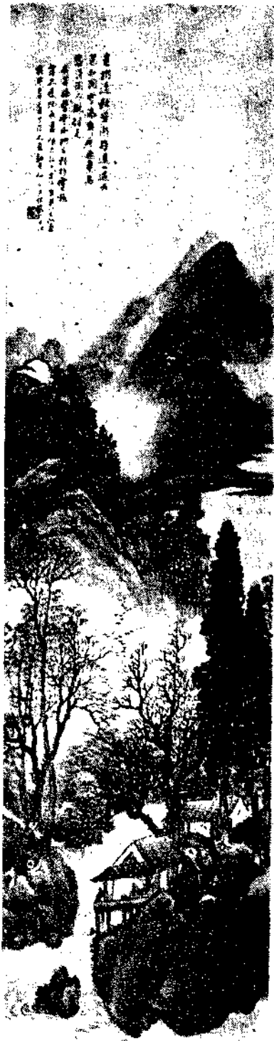
汪琨字仲山浙江人山水學畫東變化自然極生動之致