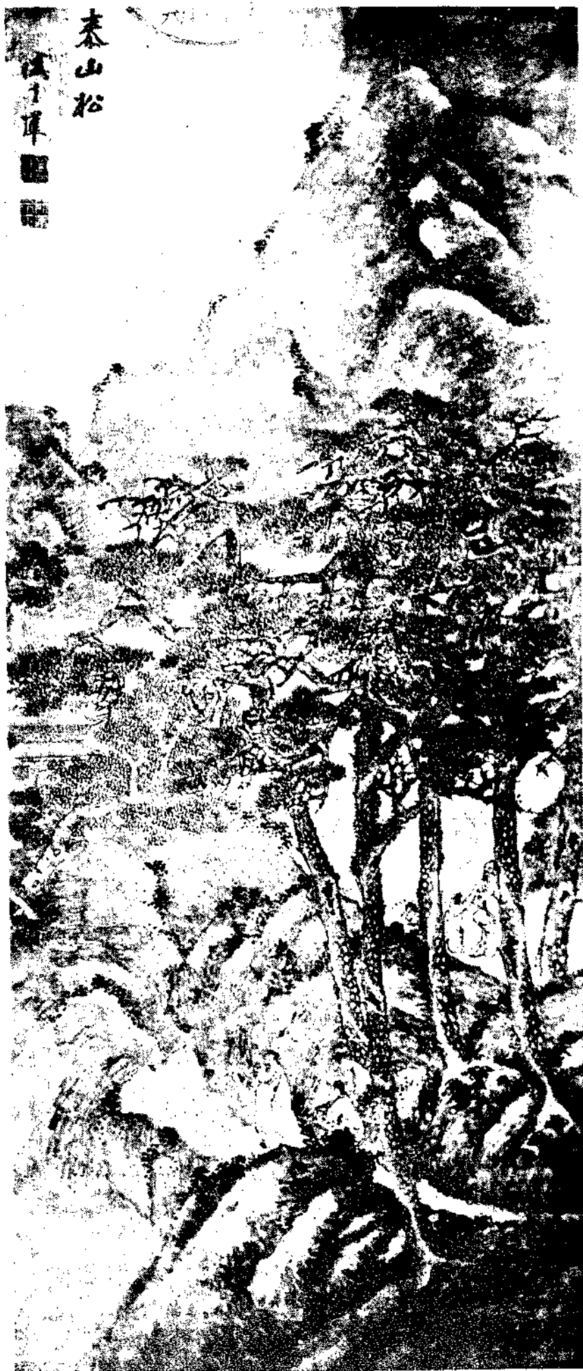
湖盛茂輝秦山松圖