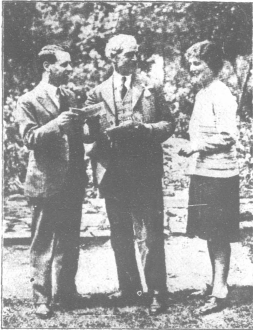
(上) 麥克唐納與其國民內閣之閣員，左首第二人即保守黨領袖鮑爾特溫 (左) 麥克唐納與其子(Malcolm)女(Ishbel)