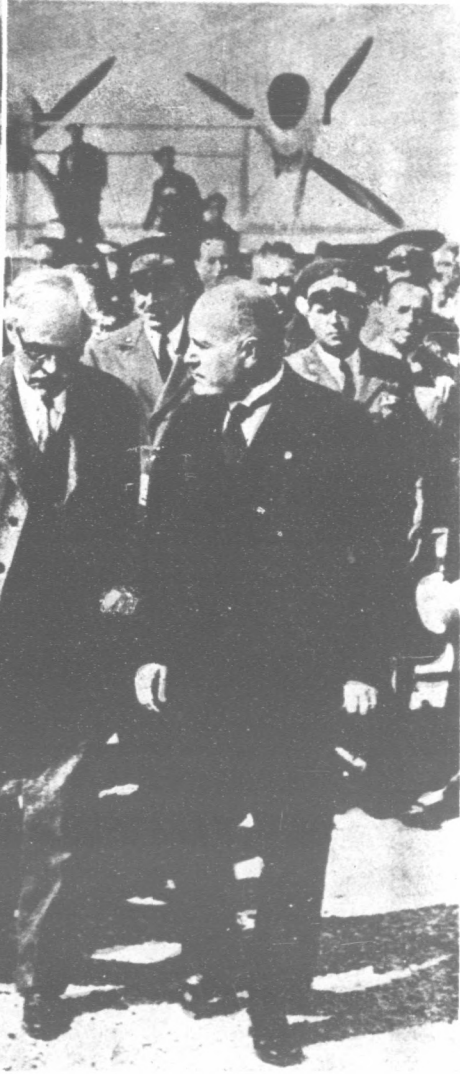
(右) 麥克唐納飛抵羅馬與墨索里尼並行出飛機場 (上) 麥克唐納在大西洋船中