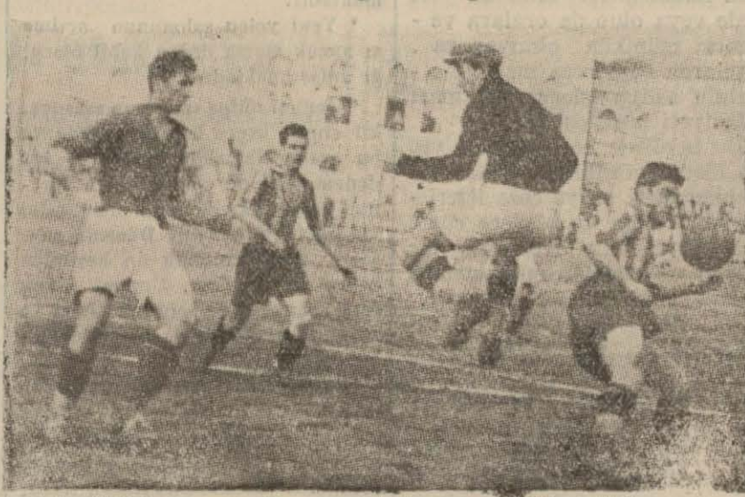
Dün Galatasarayın Yugoslav takımını mağlûp ettiği maçın bir enstantane (Yazısı 6 merda)