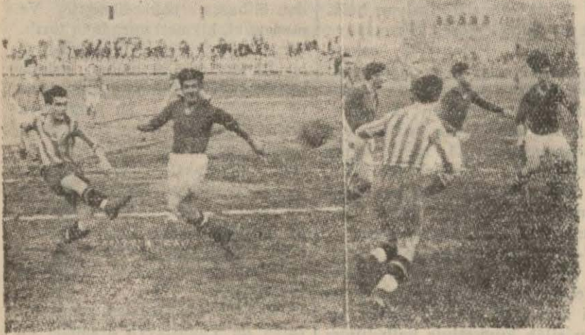
Galatasaray - Yugoslav takımı maçından iki görünüş

Şehrimizde bulunan misafir Yugoslavya klübü oyuncularını, dün, Taksim stadında dördüncü oyunlarını Galatasaray'a karşı oynadılar. Baştan başa zevkle geçen oyundan sonra maçı 1 - 0 kaybettiler.