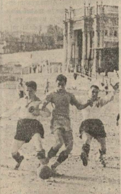
Dün oynanan mektepler maçından bir enstantane

Hakem, Tarık Özerenin'in idaresi güzeldi.