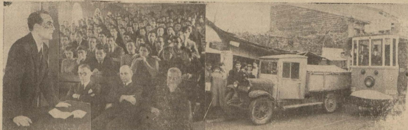
1 — İktisat haftası münasebetiyle Yüksek İktisat ve Ticaret Okulunda yapılan toplantıdan bir intiba.