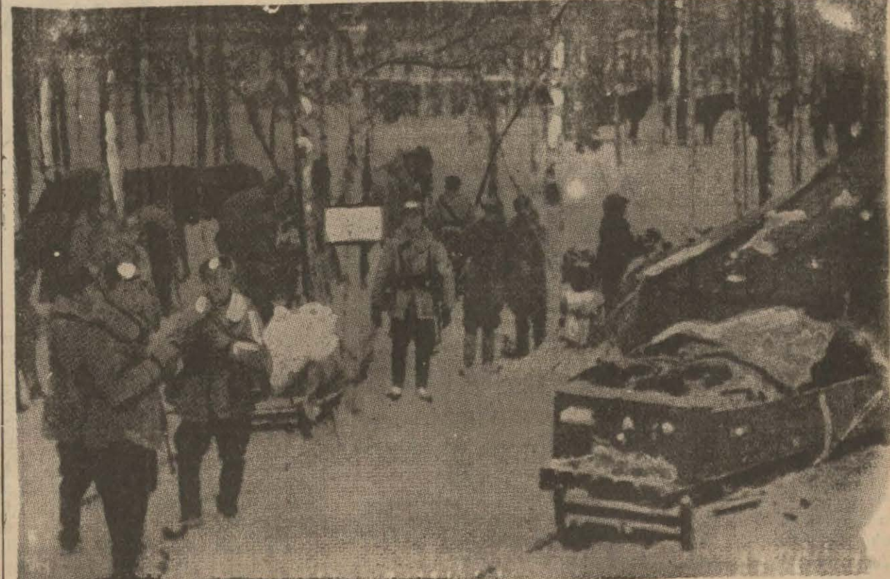
Kareli mmtalsasında harbeden Finliler