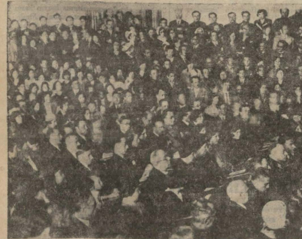
Tıbbiyelerin dünkü bayra mına iştirak edenler...

BERLIN, 12 (A.A.) — Volf Ajansından: Prusya adliye nezareti Prusya mahkemelerinde dava vekilliği etmeğe mezuhan yahudi avukatların millî inkılâptan evvel 3515 kişi iken şimdi 2518 kişiden ibaret olduğu ve mahkemeler nezdinde day. 8299 dur. len avukatların sayı,