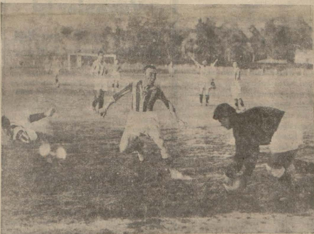
Vefa kalecisi Fenerin bir hücumunu keserken...

Dün lik maçlarına devam edildi, Kadıköy ve Taksim sahalarda müteaddit maçlar yapıldı. Fenerbahçe stadında sabahın küçükler maçlarından Kasımpaşa, İstanbulspor gençleri oynadılar ve İstanbulspor gençleri bir saat zarfında yaptıkları bir golle maçı kazandılar. İkinci karşılaşmada, Fenerbahçe, Vefa B takımları arasında idi. B takımları içinde oldukça kuvvetli bir takıma malik bulunan Vefalılar, kümede en son mevkiye bulunmaları dolayısıyla, bu defa hiç olmazsa iyi bir netice almak için kuvvetli bir takımla Fenerin karşısına çıktılar. Bir buçuk saatlik müddet zarfında Fenerin sekiş golüne mukabil bir tane olsun yapamayan Vefalılar, mütemadiyen sert oynamak, favi yapmaktan başka, üstelik hakeme de itiraz ediyorlardı. Oyunun ikinci devresinde hakem Fenerden Avniyi, Vefadan da iki oyuncu çıkarmıştı, orta hakları Münir çok sert oynuyor ve hakeme de itiraz ediyordu. Fenerbahçe B takımı bugün gene cidden çok güzel bir oyun oynadı ve bir çok birinci takımlarımıza örnek olarak derecede paslı ve seri bir oyun göstermişlerdir.