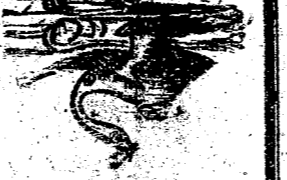
送附下剪標欄把的信通要

袁金凱要就東路的督辦。辭去吉林的省長。 魁陞想任吉林的省長。于副與又做黑龍江的省長了。