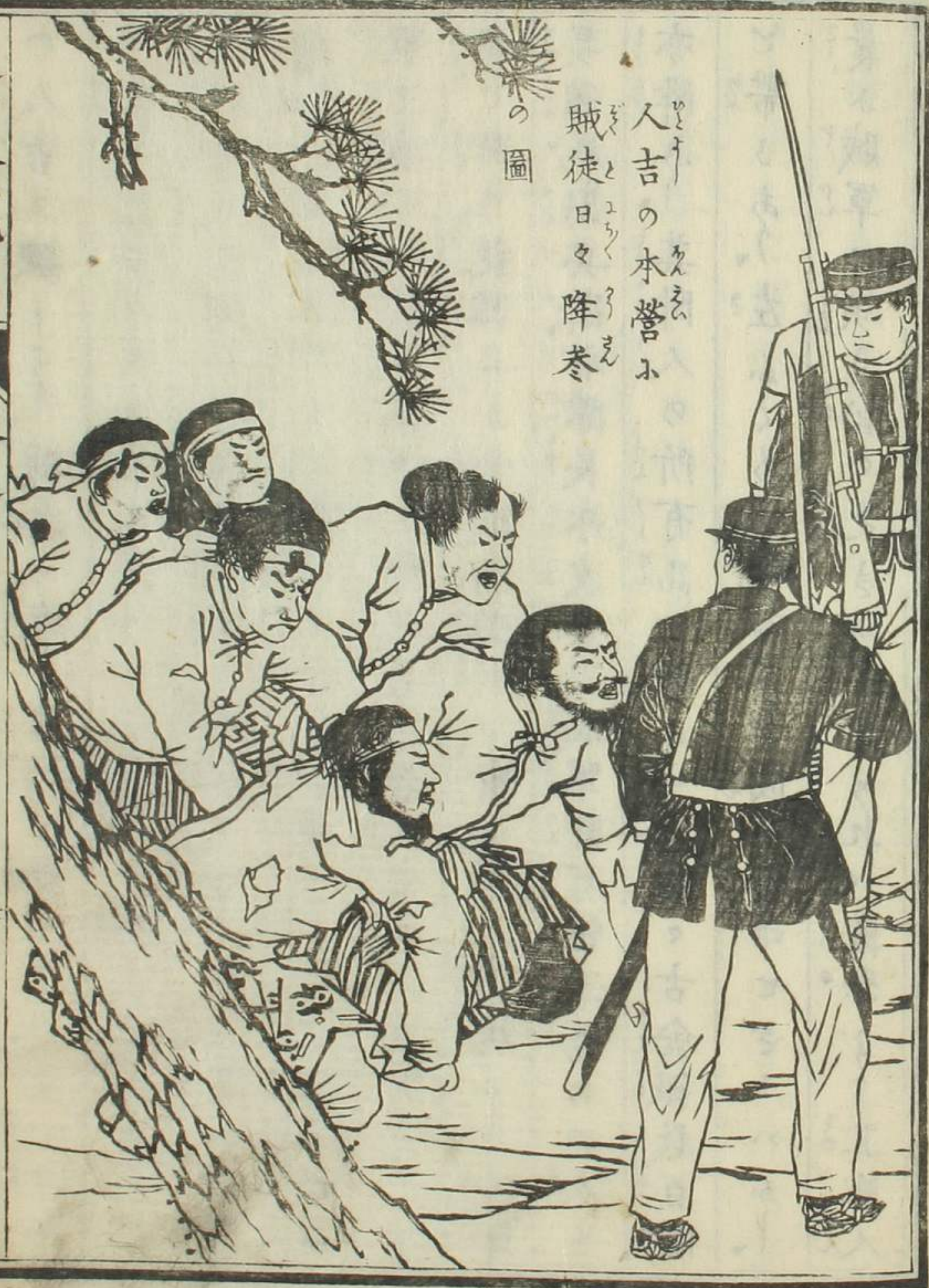
人吉の水營小 賊徒日々降参 の圖