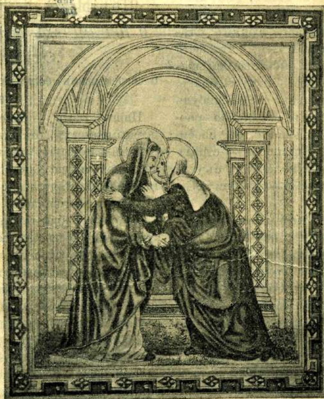
Изображеніе святой иконы „ЦѢЛОВАНІЕ ЕЛИСАВЕТЫ“.

О всемилостивая Госпоже Дѣво, Владычице, Богородице! Услыши насъ молящихся Тебѣ, и яви милость Твою на людехъ Твоихъ, моли Сына Своего избавитися намъ отъ всякаго зла, и сохрани насъ благочестно прибогающихъ и призывающихъ имя Твое святое, отъ всякія напасти, губительства, глада, труса, потопа, огня, меча, нашествія иноплемениковъ и междоусобныя брани, отъ всякія болѣзни, и всякаго обстоянія, да ни ранами, ни прещеніемъ, ни моромъ, ни всякимъ праведнымъ гнѣвомъ Божиимъ умалятся рабы Твои: по соблюдай и спасай милостію Своею, Госпоже, за ны молящихся, и полезное благораствореніе воздуха ко времени плоднаго при-