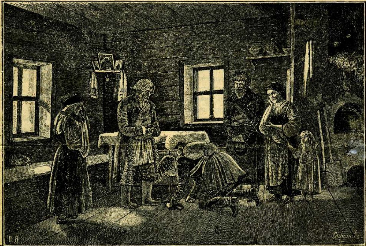
Отправленіе новобранца на военную службу.

одежды. Тутъ узнали и о его поступкѣ съ нищимъ и всѣ поняли, что видѣнное на немъ одѣяніе царское было къ нему особеннымъ чудеснымъ знакомъ милости Божіей. Всѣ прославили Бога.