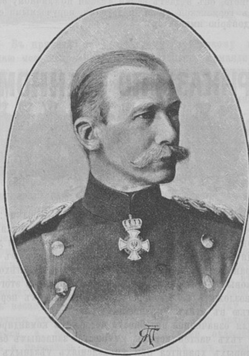
Начальникъ прусской военной академіи, генералъ-лейтенантъ Бернгардъ фонъ-БРАУХИЧЪ. Родился 12 октября 1833 г. въ Берлинѣ. Вступилъ въ