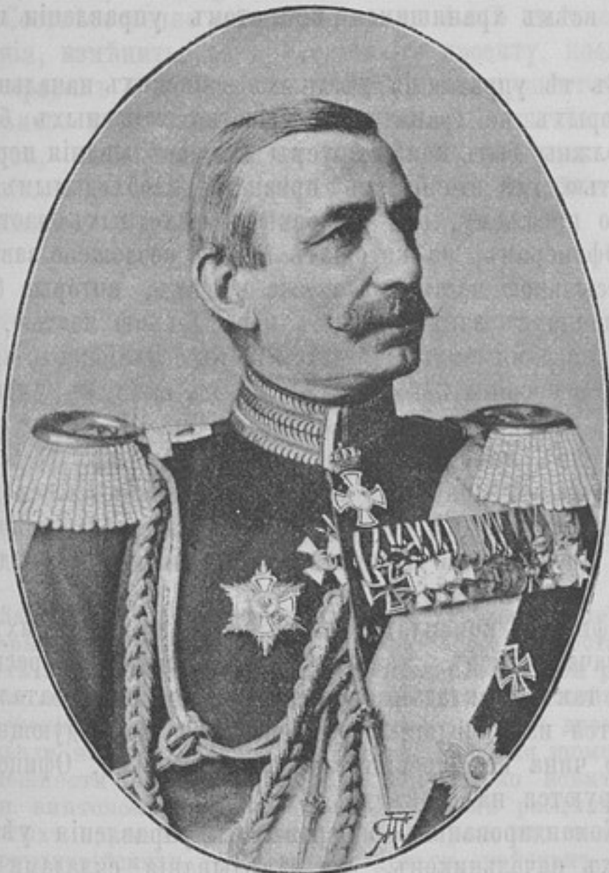
Генералъ-отъ-инфантеріи, генералъ-адъютантъ и шефъ военнаго кабинета Его Величества императора германскаго Вильгельмъ фонъ-ГАНКЕ (Hahnke). Родился 1 октября 1833 г. въ Берлинѣ. Воспитывался въ

Денги могутъ быть высланы почтовыми марками, каждая не дороже 50 к. Безденежная подписка не принимается. За перемѣну адреса 25 к. Отдѣльные №№ высылаются за 15 к. Объявленія принимаются по особой расцѣнкѣ, высласемой по требованію.