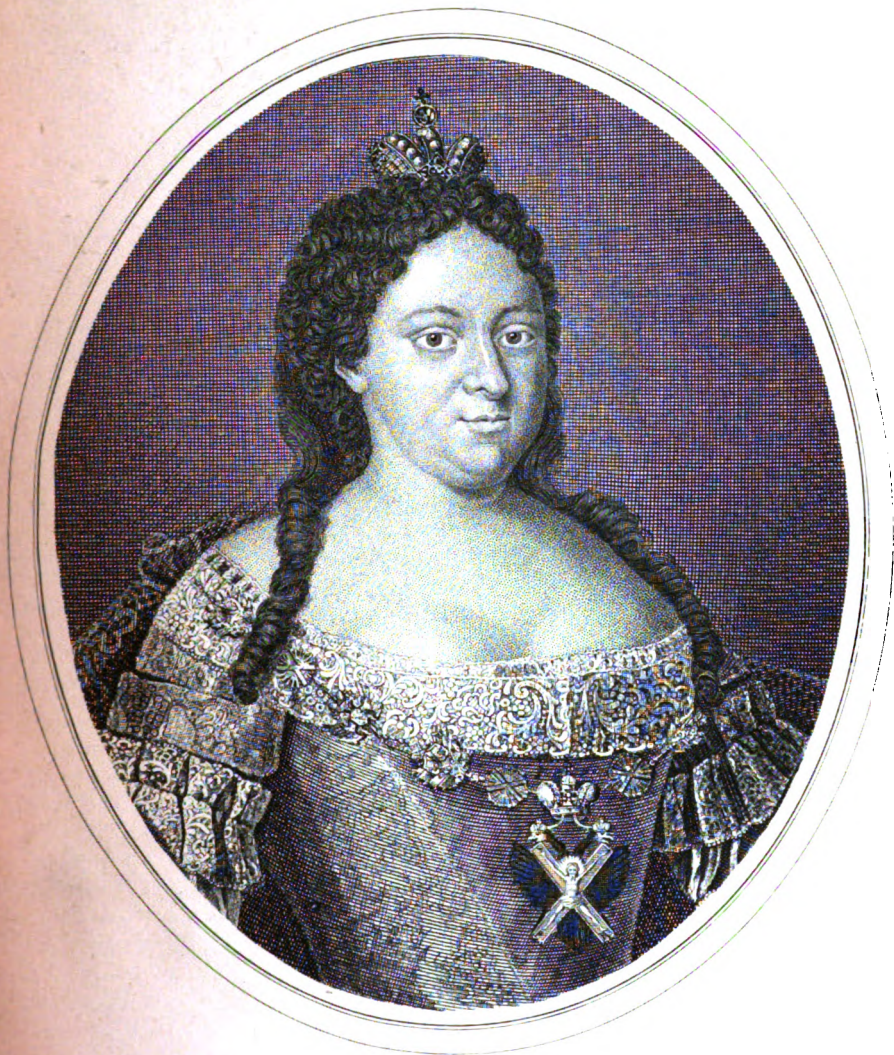
ИМПЕРАТРИЦА АННА ИОАННОВНА.