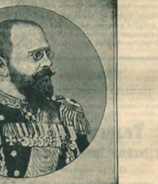
Высшій командиръ Цесаревича Григоровичъ, бывшій начальникъ Портъ-Артура.

корреспондентъ этотъ постигъ русский лагерь въ Нью-Чуань и сообщаетъ свои наблюдения.