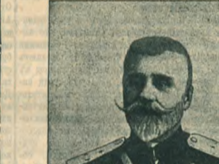
Генералъ-лейтенантъ Смирновъ, командиръ крепости Портъ-Артура.

Полковникъ Куропаткинъ, басорно, одинъ изъ самыхъ лучшихъ офицеровъ нашей армии Новокавказскаго роста, храбрый, равный и жалостливый, онъ былъ японскимъ чертлкомъ протискивающимъ Скобелеву, который давно уже былъ съ нимъ друженъ, уважалъ и ценилъ его, хотя часто съ нимъ спорилъ, и надобно сказать, что въ споркахъ отъ разсудительнаго начальнаго штаба, Куропаткинъ, оказавшаясь большею частью правъ, больше чѣмъ бастователю, уважавшему генерала А. Н. Куропаткина, напримеръ, расхолабилъ съ Скобелевымъ и ворузничалъ.