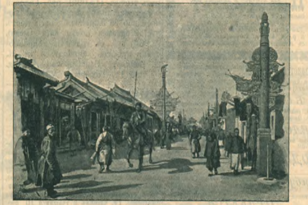
В Манчжурии. На улице Мухлена.