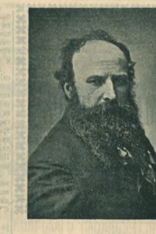
Художник В. В. Верещагин, погибший на «Петровской».