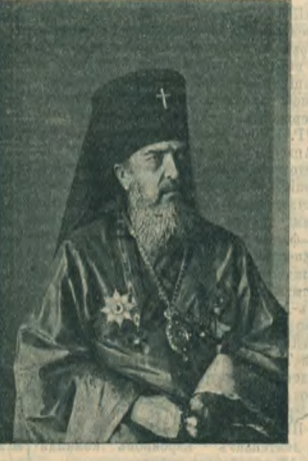
Епископ Николай, начальник русской православной миссии в Японии.

В настоящее время, когда мы накануне переживаем события в Южной Манчжурии, Ляоянь — наша база на этом театре войны.