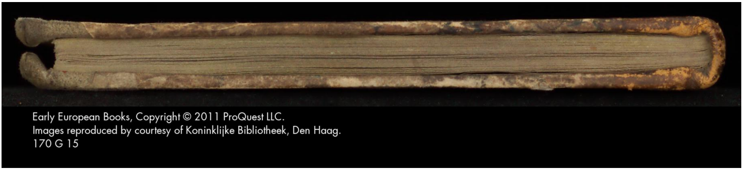
Early European Books, Copyright © 2011 ProQuest LLC. Images reproduced by courtesy of Koninklijke Bibliotheek, Den Haag. 170 G 15