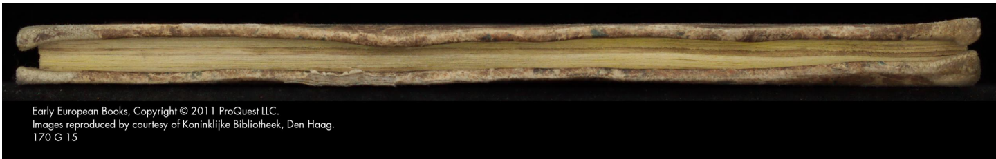
Early European Books, Copyright © 2011 ProQuest LLC. Images reproduced by courtesy of Koninklijke Bibliotheek, Den Haag. 170 G 15