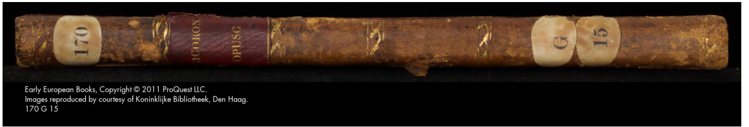
170 G 15