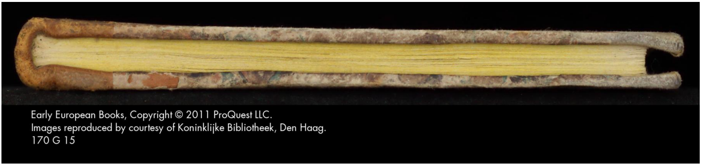
170 G 15