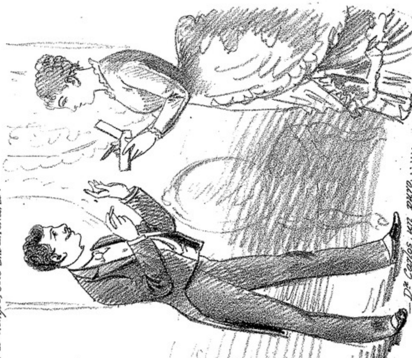
- ¿Que significará ese pie con un moñito? - Hombre, si lo puedes activitar, harás el anly de este redas un inmensa servicio, pues el tiempo lo sabe.

SALON DE LA SOCIEDAD OPERA ITALIANI LUNES 21 de NOVIEMBRE GRAN CONCIERTO CON ORQUESTA DEL CEREARE PIANISTA THIBAUT