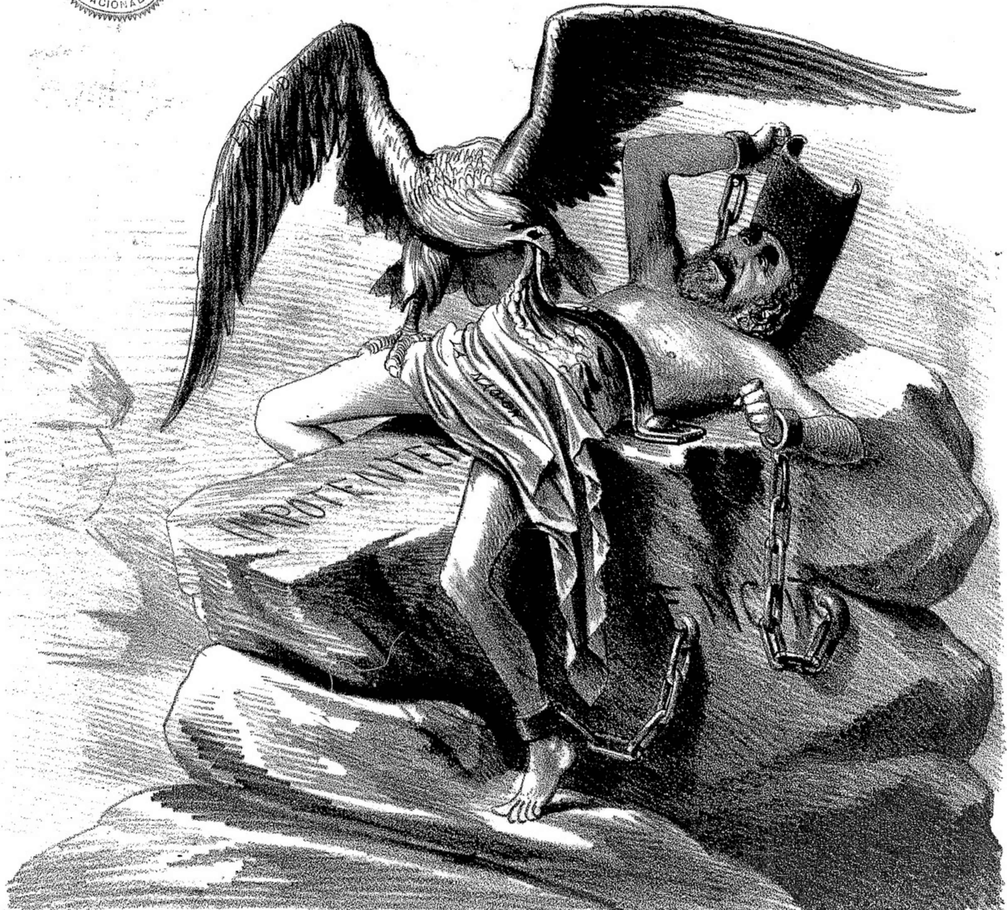
EL PROMETEO DE LA ACTUALIDAD