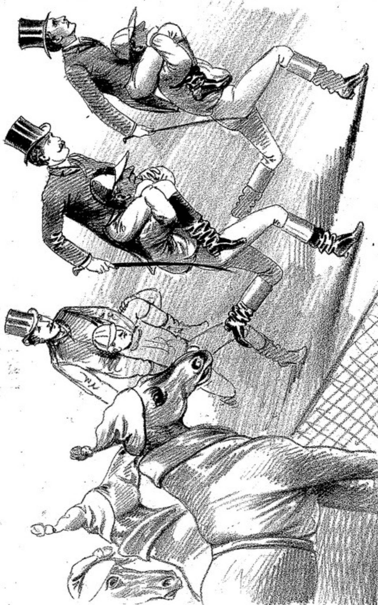
YA QUE NO PUEDEN CORRER LOS EXELENTEBES CABALLOS DE LOS STUO LUIS CHICO Y BUENOS AIRES, QUE CORRAN SUS BRIBONES JOCKEY, MONTADOS POR LOS SPORTMAN DAMNIFICADOS

SALON DE LA SOCIEDAD OPERA ITALIANI LUNES 21 de NOVIEMBRE GRAN CONCIERTO CON ORQUESTA DEL CEREARE PIANISTA THIBAUT