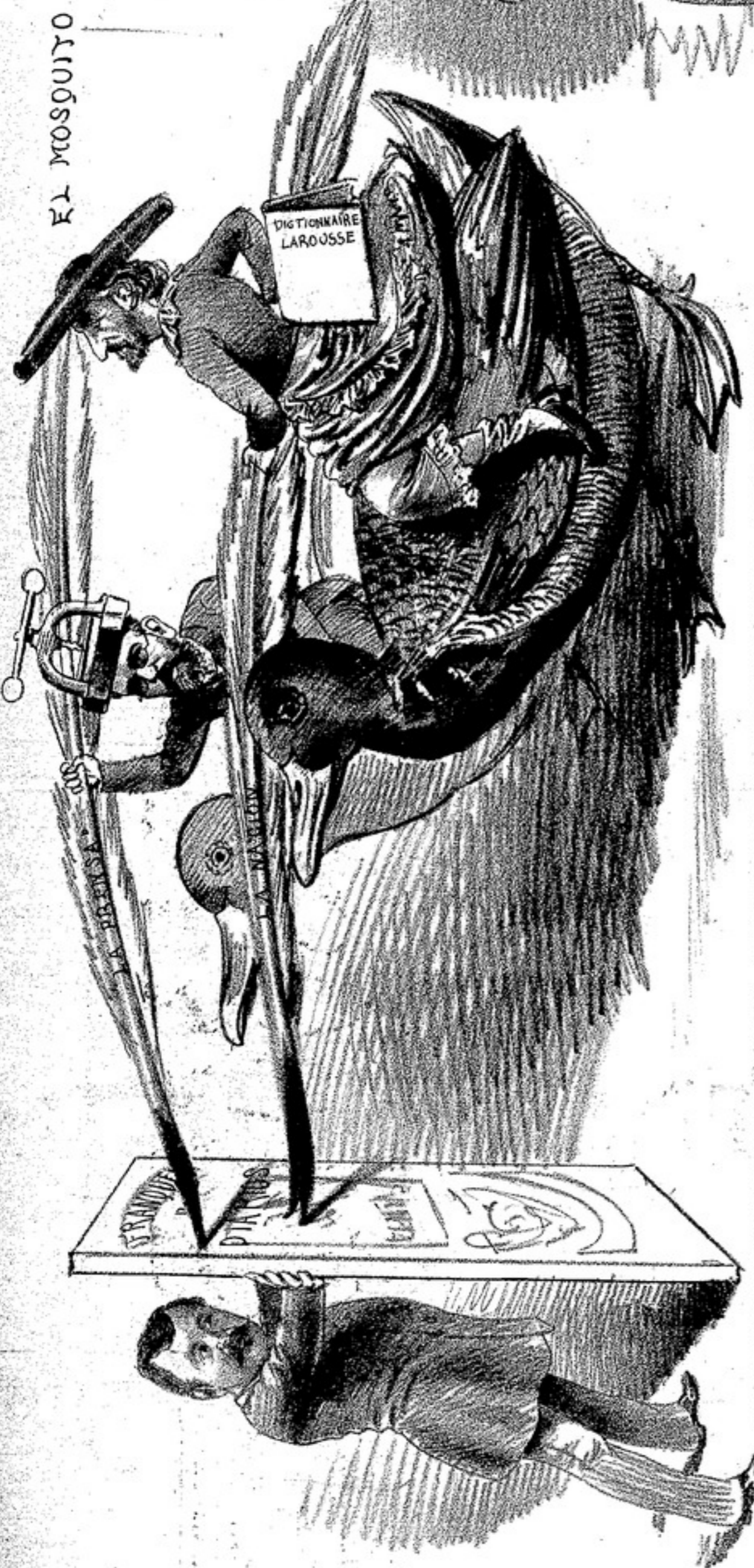
LA CAMARA DE DIPUTADOS HA HECHO TRIUNFAR EL BUEN SENTIDO EN LA CUESTION FRANCO DE DIARIOS MALGRADO LA CARGA A FONDO DE LOS DOS MASTODONTES DE NUESTRA PRENSA.