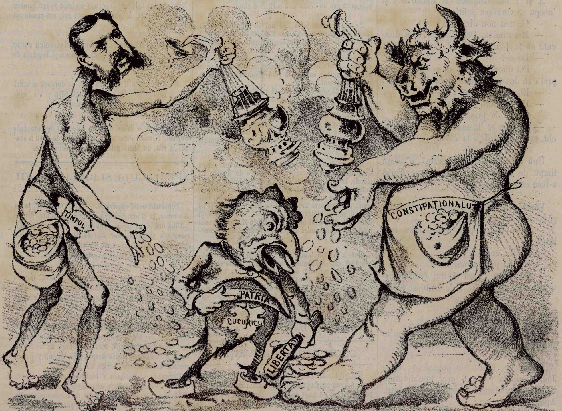
— Ađi, cândū PATRIA ne cere Sacrificii și veghiere, Dați sărmanulū golanū Furgăsitulū vostru banū!