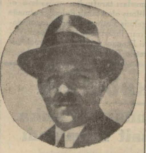
Saracoğlu Şükrü Bey

ANKARA, 18 (Milliyet) — Pariste imzalanan borçlar itilâfnamesi ve itilâfımızın tasdikî hakkındaki lâyhayı hükûmet Meclise verdi. Bu lâyhaya gelecek hafta heyeti umumiyeye gelmiş olacaktır.