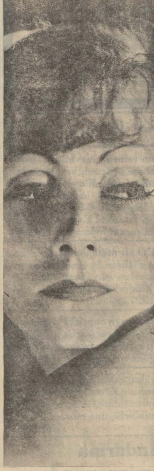
Esrengeçiz Greta Garbo'nun yeni bir poz