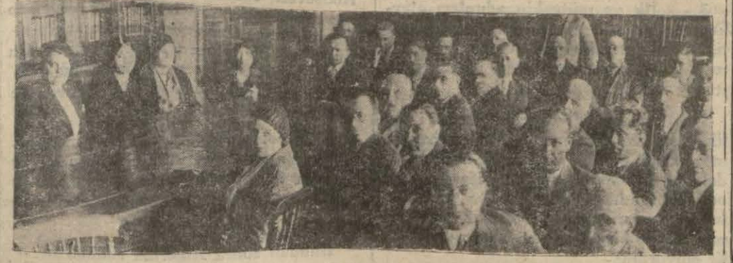
Tarih muallimleri dün bir toplantı yaptılar. Yazısı kısmı mahsusumuzdadır.

Şükrü B. tekrar Parise gidebileceği gibi, Banka mümessillerinin Ankara'ya gelmeleri de muhtemeldir. Şükrü Bey Pariste imza edilen borçlar itilâfnamesinin esaslı hatları hakkında bize şu beyanatta bulunmuştur: — Pariste imzalanan itilâfname (Devamı 2 inci sahifede)