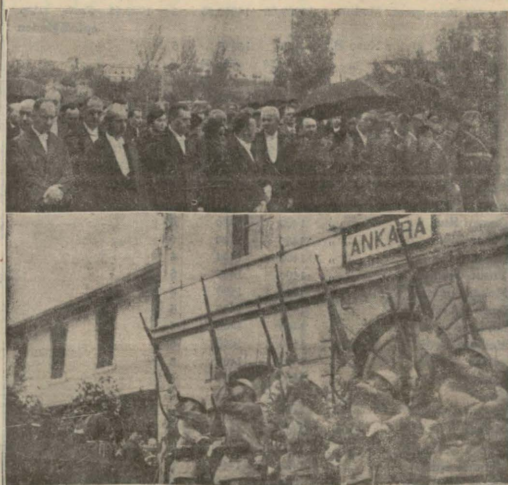
Polonya sefirinin cenaze merasiminde Devlet erkânı ve bir manganın havaya ateşi...

volan ve 75 bin esir ve 360 top zayi ederek 14 günde 600 kilometrelik bir ric'at neticesi kadro haline inkılâp eden Yıldırım orduları grubu lâğve - dilmis ve bu suretle açıkta kalmış olan Mirliya Mustafa Kemal Hazretleri, sözlerini, imalarını hangi kelime ile ifade etmeli?