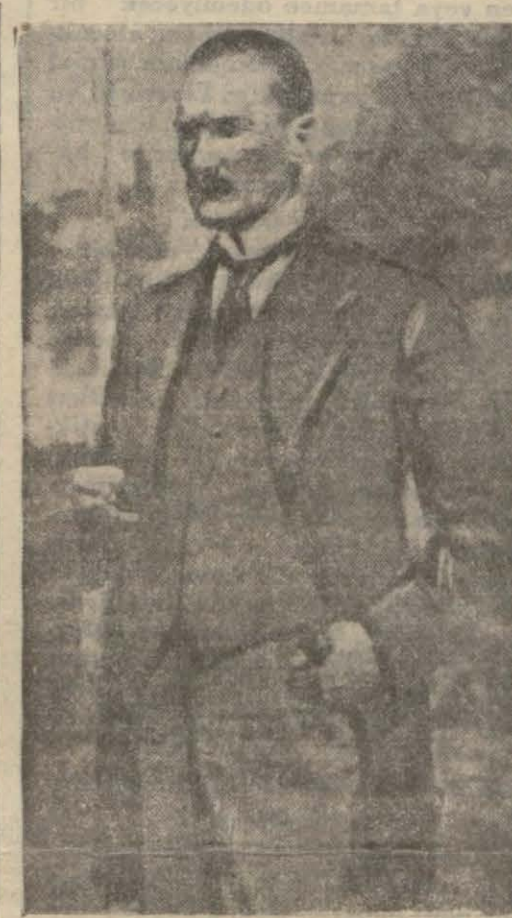
Gazi Hazretlerinin Sivas kongresi esnasında çekilmiş bir resimleri...

Millî mücadele ve İstiklâl tarihinin ilk günlerine ait bütün vesikalar elimizdedir. Onun için mevzu etrafında bütün yazdıklarımız, hakikatin tam ifadeleridir. Bu hakikatleri kuru sözlerle tezkibe yeltenmek gülünç bir şey olur. Millî nüveyi kim yarattı? Erzurum kongresine kimler karar verdi ve nihayet kim yaptı? Bu sorguların cevabını; kuru iddialarla değil, vesikalar üzerinde araştıracağız: Umumi merkezi İstanbulda olan "Vilâyetî Şarkiyeye Müdafaa-i Hukuk," Cemiyeti var. Bu cemiyetin Erzurum Şubesi idare heyetinin karar defteri, bugün elimizdedir. Erzurum Şubesi 335 senesi martın üçünde teşekkül ediyor, ayın onunda vilâyetten ruhsatnamesini alıyor. Ondan sonra da çalışmaya başlıyor. Cemiyetin aldığı bütün kararlar; bu defterde yazılıdır. Cemiyet; ilkönce mülhakatla anlaşılıyor, sonraları Sivas, Harput, Bitlis Vilâyetlerle temas temin ediyor. Mart nihayetinde mülhakat ve bazı civar vilâyetlerle temas ve anlaşma olmuştur.