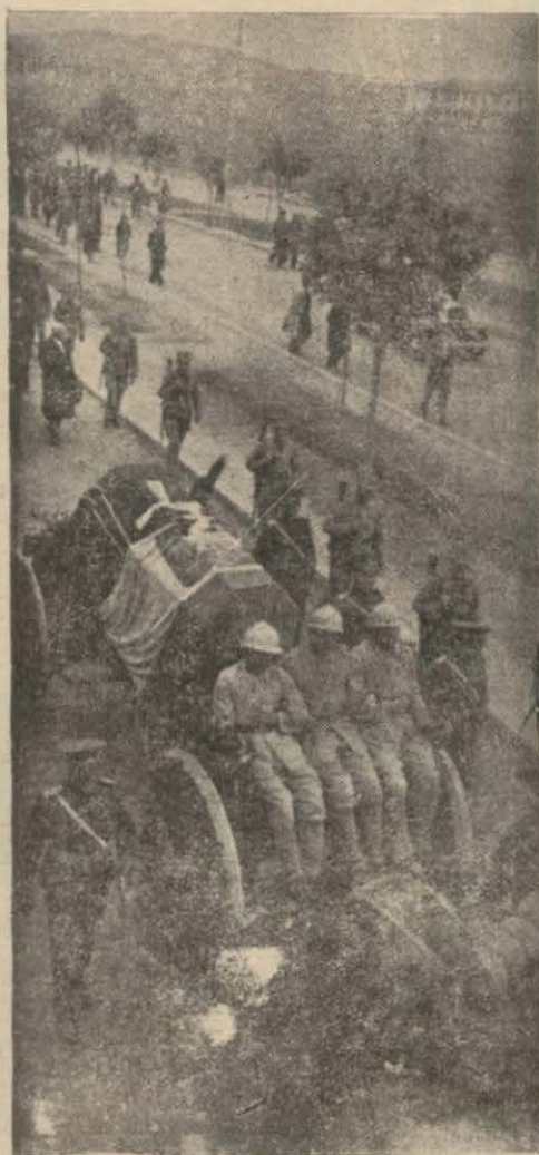
Polonya sefirinin cenazesi merasimle naklediliyor

şu şekilde grupun başından ayrılacak İstanbul'a gitmiştir. Onun, hiç bir vakit açık muamelesine tâbi tutulduğu vaki olmamıştır. O halde, kolordu ve ordu kumandanlıklarında bulunan her zat gibi, bu hakikati bilmesi lâzım gelen Kâzım Karabekir Paşanın mektubundaki "11 Nisan 335 — Li-