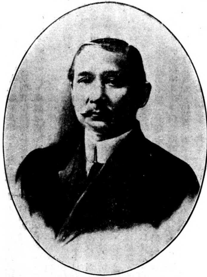
總 理 遺 像