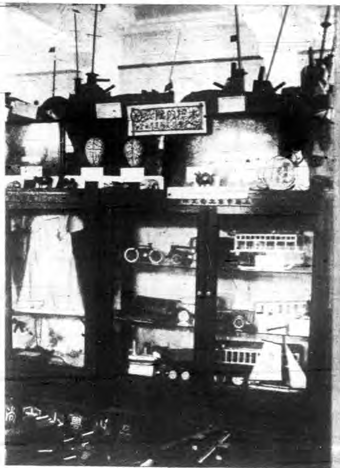
學小文尚 積成元單件製型模通交市海上