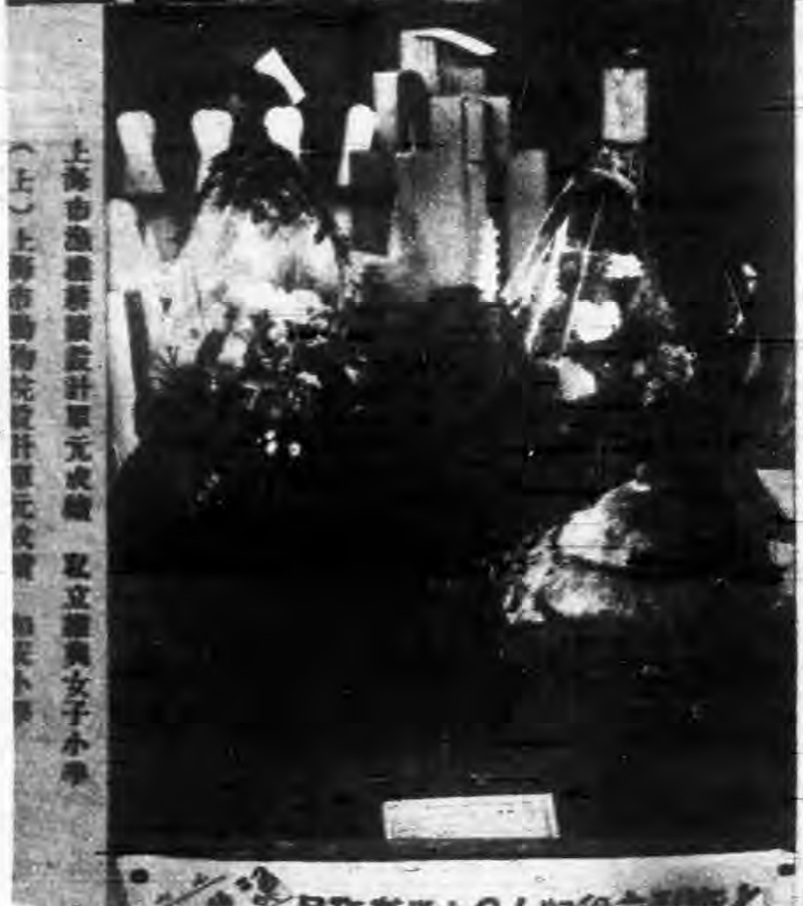
上海市漁業學校設計單元成績 私立維興女子小學 （上）上海市動物院設計單元成績 尚文小學