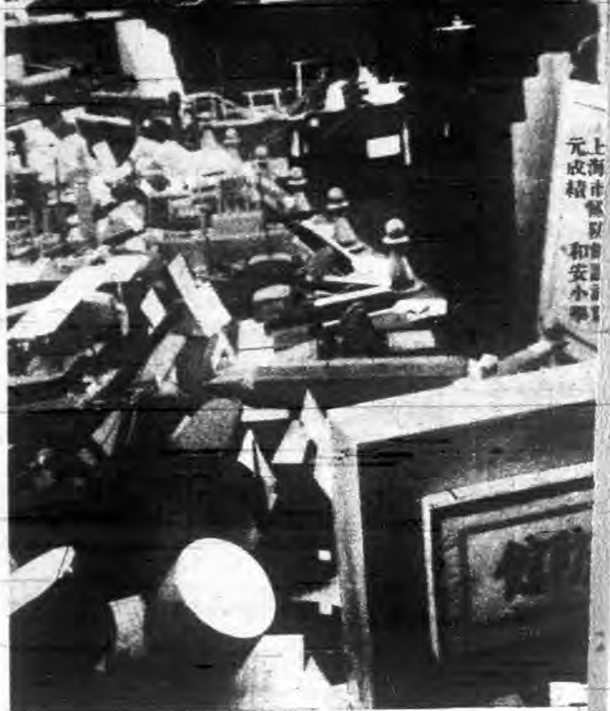
上海市各 元成績 和安小學