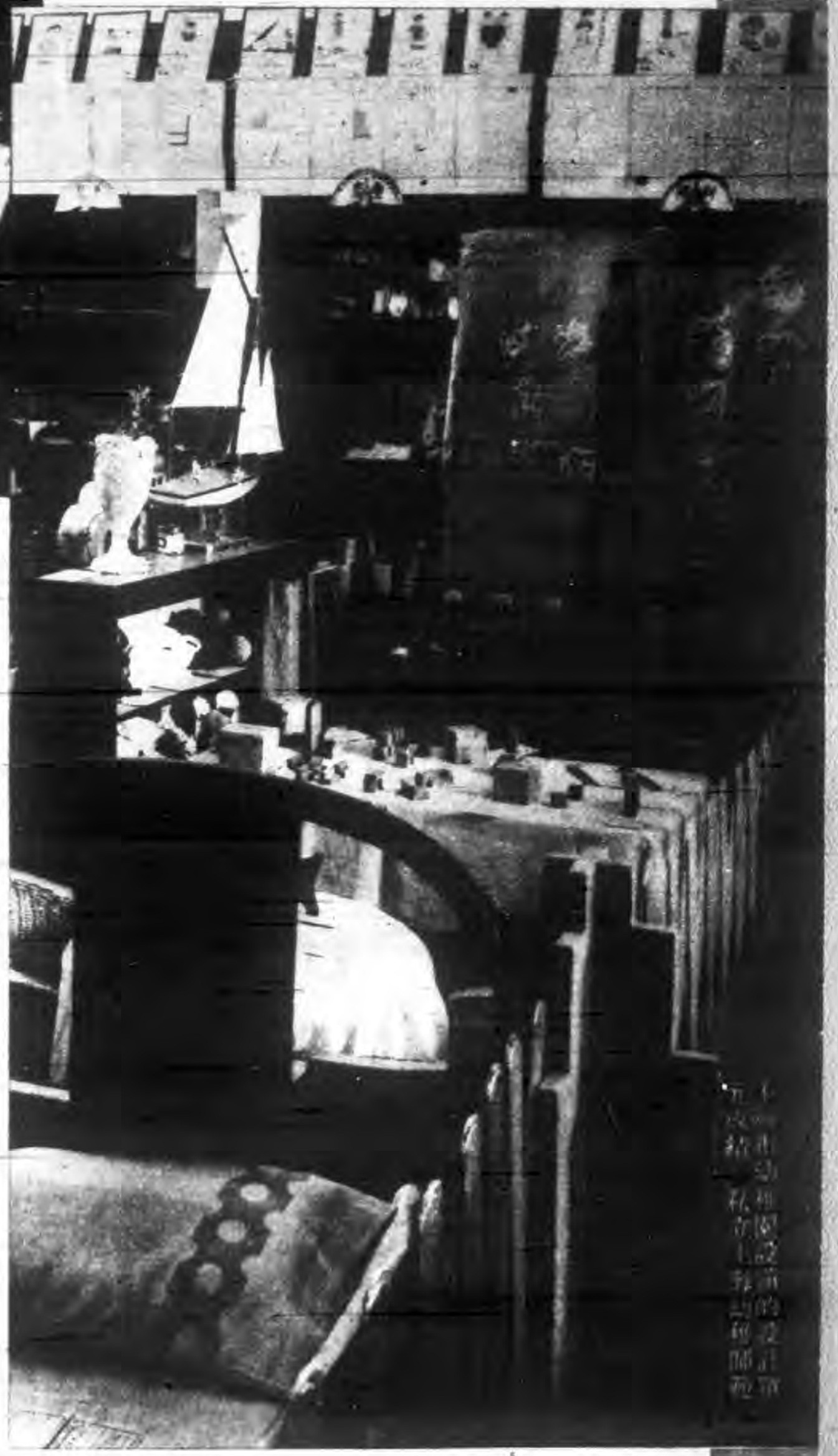
部品海覽成校全舉教 之市會績勞國辦育 一出上展作學之部