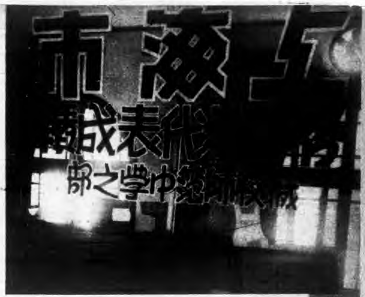
角之之中師職 成代學市上 一部學範校 績表校各海