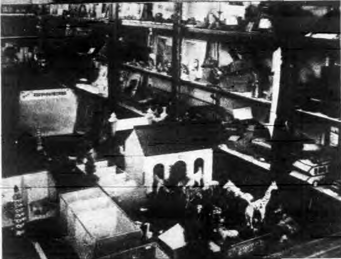
（下）上海市 小學勞作 科目之 陳列部分