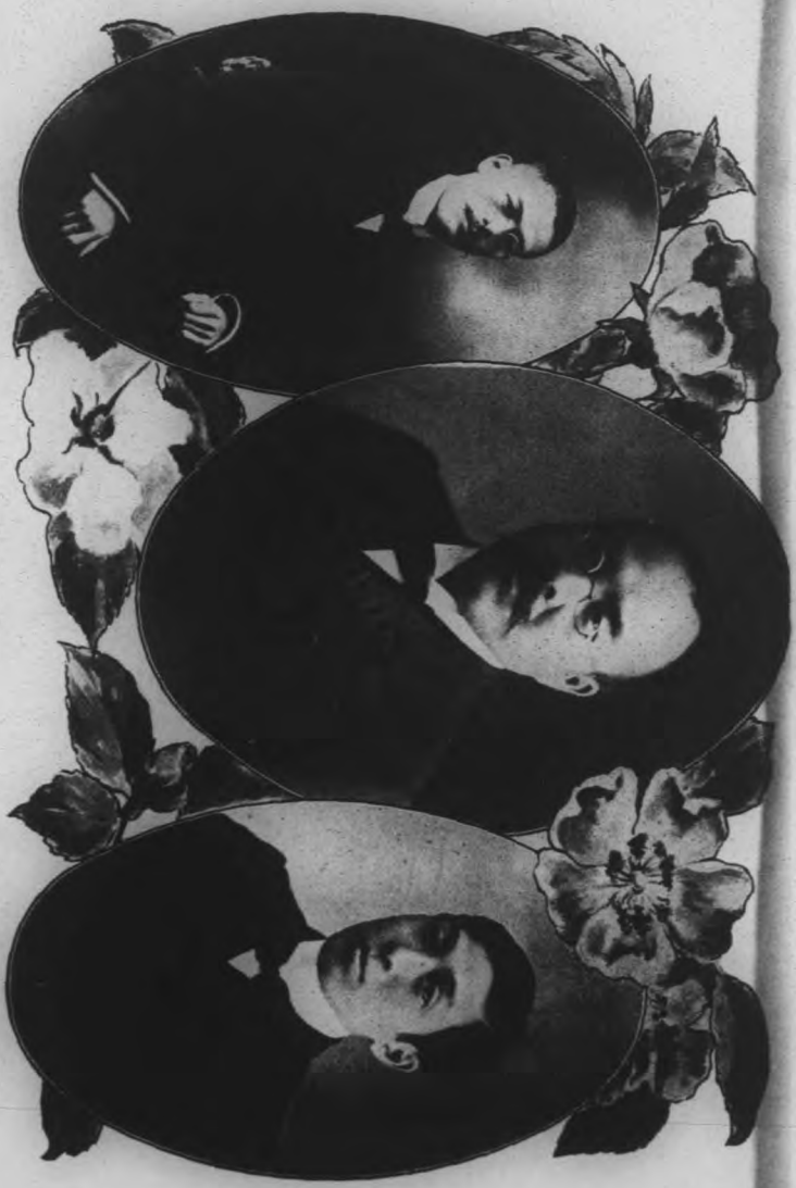
授教學大田稻早 臣貞君松村士學文