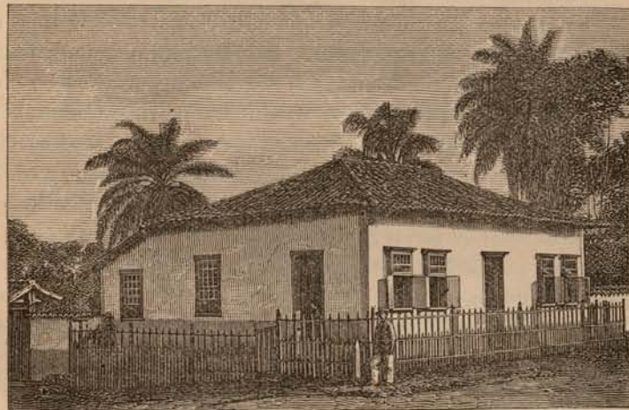
Habitação de Lund

Quando em 1835 chegou á Lagôa-Santa, alugou uma pequena casa, de que fez sua residencia até á morte. Esta casa não fica á beira do lago, como geralmente se conta; mas á pequena distancia deste, que dá o nome á povoação — Arrayal de N. S. da Saude da Lagôa-Santa . Como um exemplo da barateza, ao menos naquelle tempo, das propriedades e meios de vida, convém notar que, quando Lund depois, no começo de 1839, comprou esta mesma habitação, e mandou edificar no seu