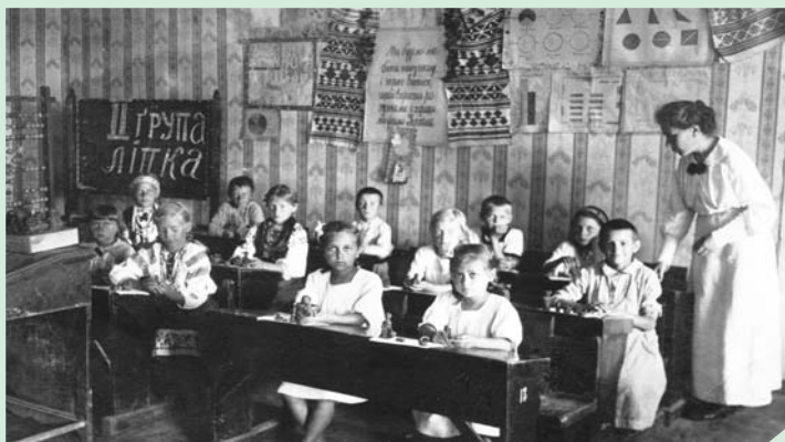
З учнями 18-ї Української школи ім. М. Коцюбинського. Чернігів, 1922–1926 рр.