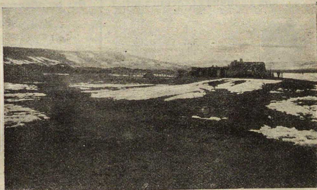
Самое холодное мѣсто земного шара—городъ Верхоянскъ. Средняя температура за годъ—66 град. ниже нуля. На полюсѣ температура выше.

Останавливаться на почевки мы будемъ каждый день. Спать будемъ въ особыхъ мѣховыхъ мѣшкахъ. Свой путь, отъ мѣста зимовки до полюса, я рассчитываю пройти туда и обратно въ полгода, проходя десять верстъ въ день. Если мы