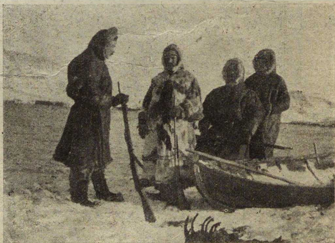
Полярные изслѣдователи отправляются на охоту.