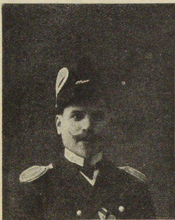
Кап. Г. Я. Сѣдовъ, популярный путешественникъ, отправляющийся въ июль мѣсяцъ съ экспедиціей на Сѣверный полюсъ.

Статья для «Синяго Журнала» кап. Г. Я. Сѣдова *).