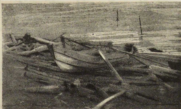
Разбитый баркасъ, выброшенный на берегъ Ледовитого океана. На этомъ углу суднѣ путешественники были занесены въ море. После страшной бури, ихъ выбросило на берегъ.

Последней моей полярной экспедиціей было путешествие на губу Крестовую, въ Сѣверномъ ледовитомъ океанѣ, на Новой Землѣ.